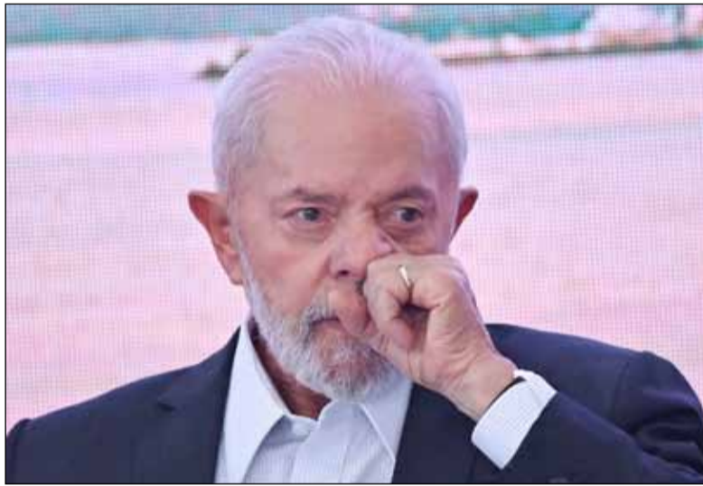
Anuncio. Del presidente de Brasil, Luiz Inácio Lula da Silva, en Planalto

Hay cerca de 1,5 millones de damnificados en Rio Grande do Sul, fronterizo con Uruguay y Argentina, donde las lluvias torrenciales han causado una destrucción sin precedentes