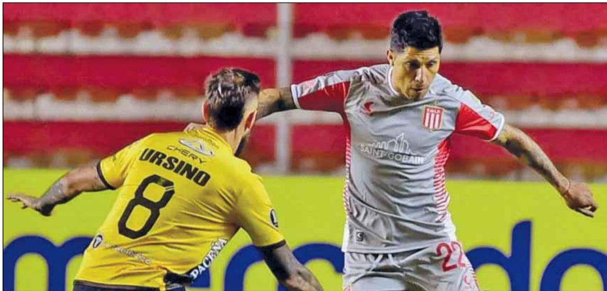
Estudiantes no puede con The Strongest en la altura