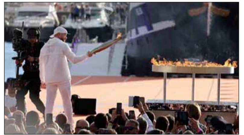
En Francia. La llama olímpica ya está en el país

El certamen se celebrará desde el viernes 26 de julio, cuando iniciará la ceremonia inaugural en el Río Sena, hasta el domingo 11 agosto. En ese lapso, 32 deportes formarán parte del calendario olímpico, iniciando con rugby y con fútbol, dos días antes del inicio oficial.