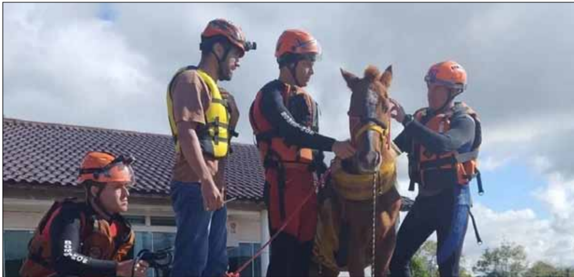
Rescatistas. En Rio Grande do Sul con uno de los caballos atrapados por la inundación

La Secretaría de Comunicación Social de Brasil anunció este jueves que el personal de las Fuerzas Armadas rescató a más de 5.000 animales por las inundaciones en Río Grande do Sul.