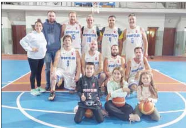
El equipo local cayó apenas por un punto: 41 a 42.

El equipo de Maxi masculino de Sport Club Trinitarios tuvo acción durante el fin de semana pasado. El sábado 4 recibió, en el gimnasio 'Padre Francisco Echevarría', a su par de Atlético 9 de Julio para disputar un partido amistoso. Fue un encuentro parejo, picante por momentos, que finalmente quedó para la visita por apenas un punto.