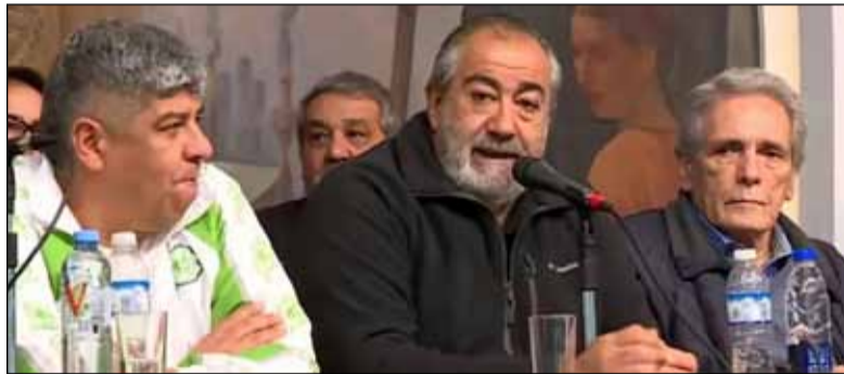
Balance. De los dirigentes de la CGT, sobre el paro general realizado ayer

trabajadores de la sanidad (ATSA) evitó responder los calificativos que llegaron desde los funcionarios de gobierno. "A las agresiones no contestamos. Creemos que tienen que ser educados. No vamos a contestar con agresiones a nadie, sólo les pedimos que tengan la precaución de ser educados, democráticos, civilizados, la CGT está dispuesta a conversar, no a través de insultos ni banalización de una medida tan importante como la de hoy", insistió.