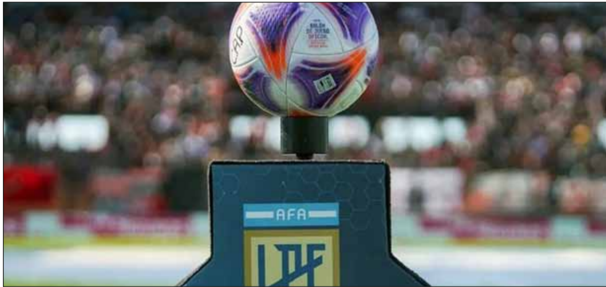
Comienza a rodar la pelota. La Liga Profesional arranca con tres partidos

Sarmiento recibe a Instituto; Argentinos Juniors va contra Rosario Central y Newell's enfrenta a Platense