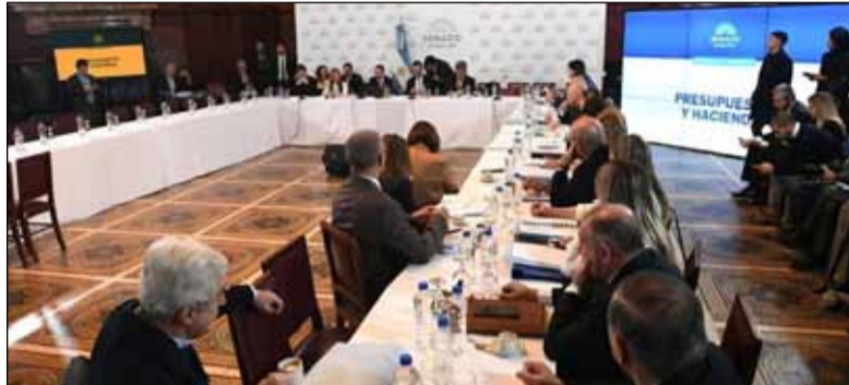
Sin dictamen. La Ley Bases continuará en debate la próxima semana en el Senado

“Hay legisladores que no quieren la delegación de facultades, los patagónicos rechazan la privatización de Aerolíneas Argentinas, la presentación que se hizo sobre el blanqueo de capitales que hizo Guberman fue un desastre para el oficialismo; los senadores del radicalismo (entre