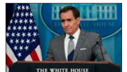
Portavoz presidencial. John Kirby

“Esa es una elección que Israel tendrá que hacer”, comentó en relación a la ofensiva en la densamente poblada Rafah. “Y es una que esperamos que no tomen”.