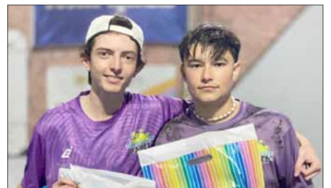
Cameroni - Plaza, ganadores en Octava.