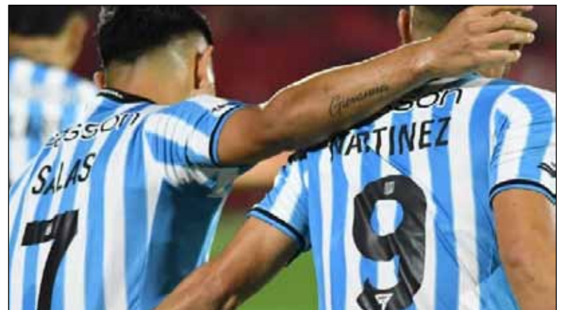
En Brasil. Racing va ante Bragantino