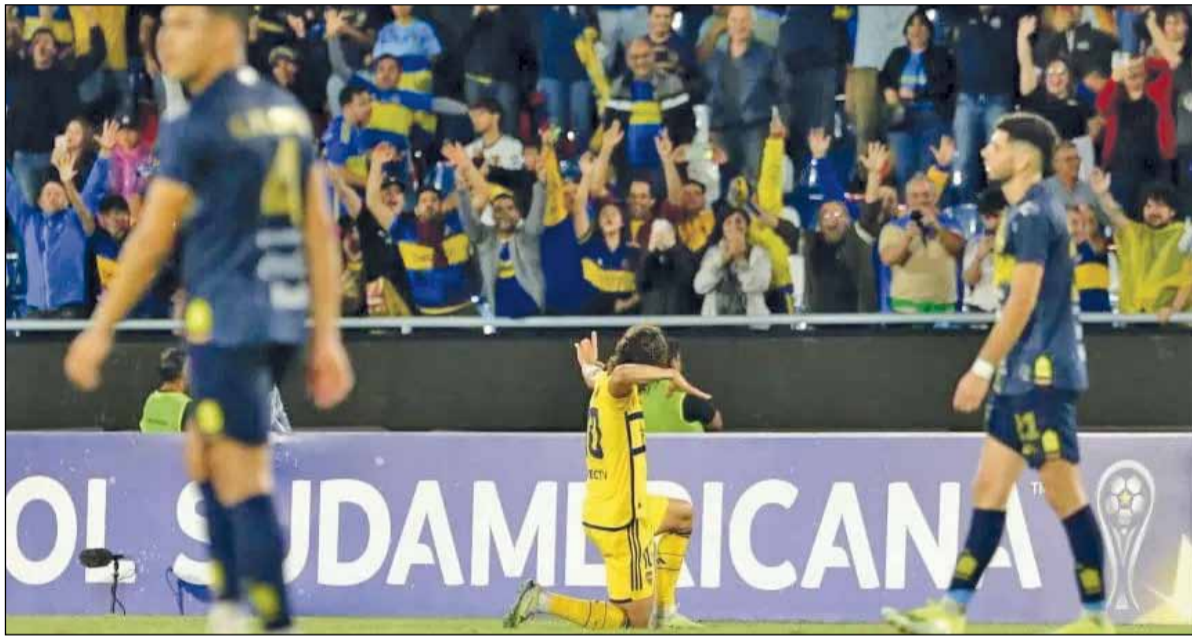
Edinson Cavani pudo acertar su flechazo de tiro libre para Boca vs. Trinidense