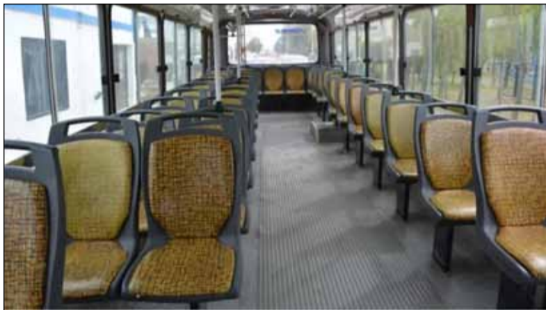
Sin transporte. El paro afectará a quienes se movilizan habitualmente en el transporte público

En reclamo por mejores condiciones para los trabajadores y en rechazo a las políticas libertarias de Javier Milei, distintos gremios paralizarán o afectarán parcialmente diversas actividades. No habrá transporte público de pasajeros por 24 horas y los bancos permanecerán cerrados. Sí funcionarán los hospitales con guardias mínimas y será casi nula la actividad en las escuelas.