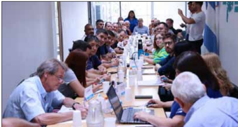
Reunión. La provincia recibió a representantes estatales bonaerenses

Según pudo saber esta agencia, en el encuentro se hizo referencia a una "situación económica dramática" por los recortes nacionales y, en este marco, la Provincia manifestó que su