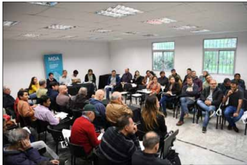
Presentación. Durante la 5ª Mesa Provincial del sector

La Mesa Provincial de Mercados Frutihortícolas reunió en la capital bonaerense a representantes de los principales mercados concentradores de la Provincia, operadores, productores y autoridades municipales. Durante su transcurso, “los participantes agradecieron el acompañamiento de la Provincia al sector