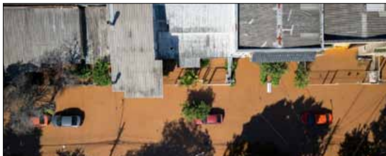
Fotografía aérea. Muestra vehículos en medio de calles inundadas en el barrio de Santa María Goretti en Porto Alegre

En ese estado, uno de los prósperos del país, unas 230.500 personas han tenido que abandonar sus hogares y en total suman 1,5 millones de damnificados, según la Defensa