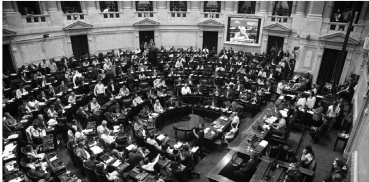
Inicio de la sesión para el tratamiento de la Ley Ómnibus en la Cámara de Diputados.

La parte más difusa y empinada vendrá después, en la votación en particular, ya que hay artículos que penden de un hilo y podrían caerse si el oficialismo no ajusta las clavijas hasta el último momento. Pese