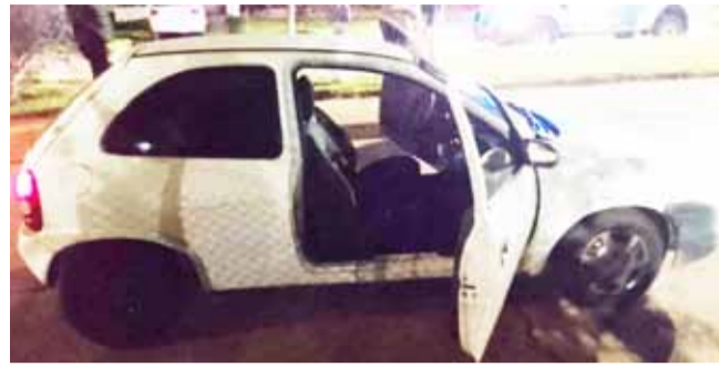
El Corsa que se llevaron y dejaron abandonado.

En forma inmediata, el personal policial realizó por el lugar patrullaje en móviles y caminando a los fines de interceptarlos y lograron atrapar a dos de los tres jóvenes que circulaban en el auto. Minutos después la pro-