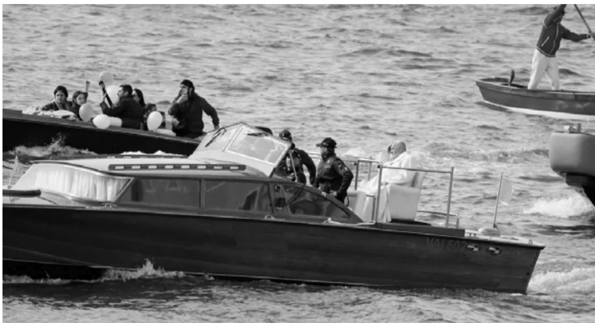
El Papa Francisco en una barca a su llegada el día de un encuentro con jóvenes en la Plaza frente a la Basílica de Santa Maria della Salute, en Venecia April 28, 2024.

“La cárcel es una dura realidad, y problemas como el hacinamiento, la falta de instalaciones y recursos, y los episodios de violencia, dan lugar a mucho sufrimiento. Pero también puede convertirse en un lugar de renacimiento moral y material”, dijo Francisco a reclusos y guardias.