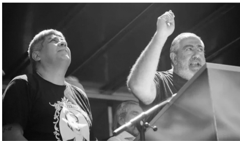
Pablo Moyano y Héctor Daer en el primer paro de la CGT contra Javier Milei.

“La Patria no se vende. En la calle para cambiar la vida. Los derechos se defienden”, publicó en sus redes sociales la CGT el jueves pasado para ratificar la marcha que habían anunciado días atrás. Esta nueva convocatoria de la CGT se da luego que participara también de la marcha nacional