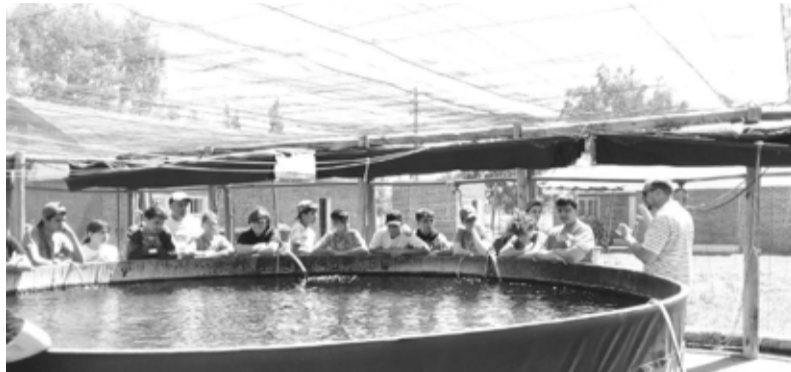
La Estación Hidrobiológica de Junín trabaja en la producción de pejerreyes. - La Verdad -

La Laguna de Gómez aún no recuperó su nivel. “Todavía falta agua para sembrar pejerrey y necesitamos más profundidad. Es importante que el agua haya llegado a la costa de la estación y se mantenga, ya que antes se absorbía. Habrá