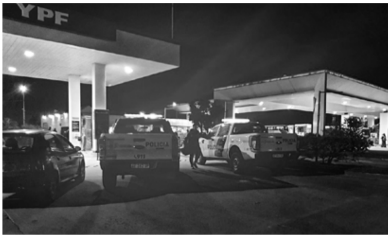
La detención de los policías federales se produjo en la estación de servicio YPF de ruta 3. - La Voz del Pueblo de Tres Arroyos -

Según trascendió, dos personas identificadas como policías le exigieron al empresario una suma de dinero para no implicarlo en la investigación. Ante esta situación, el empresario pactó el encuentro en la estación de servicio YPF ubicada sobre la ruta 3, junto a un oficial de la DDI. Tras la entrega del dinero y la identificación del efectivo policial, se dio un enfrentamiento cuerpo a cuerpo, hasta que finalmente los federales resultaron detenidos.