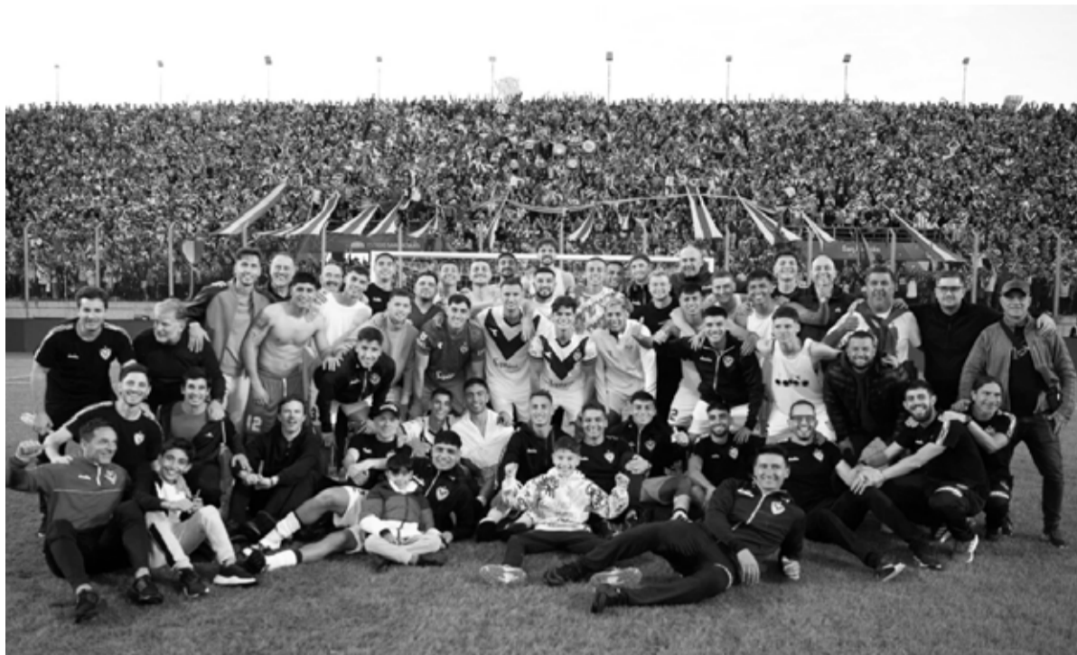
Vélez derrotó por penales a Argentinos en San Nicolás.