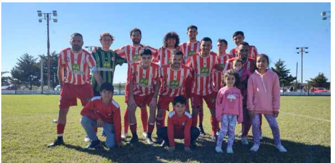
Formación de Empleados de Comercio, ayer.

Un bolivarenses radicado en Laprida fue protagonista central. Por un error de tipeo los fondos fueron a su cuenta cuando estaban destinados a un homónimo suyo que vive la Capital Federal. Lo que sucedió después se transformó en viral a través de redes. Página 5