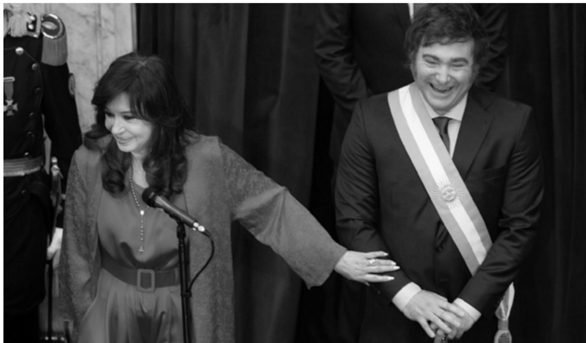
Cristina Fernández y Javier Milei, el día del traspaso presidencial.

En el análisis de la gestión propia, “las fotos que recibimos ya son prehistoria, hay sectores que se expanden con claridad, minería, petróleo, agricultura”. Así, Milei destacó: “Lo que tiene que ver con bienes de consumo no durables,