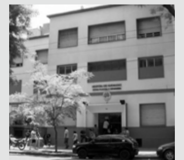
La niña fue atendida en el Hospital del Quemado de la Ciudad de Buenos Aires (CABA).

El caso recayó en la Unidad Funcional de Instrucción (UFI) del Fuero de Responsabilidad Penal Juvenil 1 del Departamento Judicial de Lomas de Zamora y fue caratulado como “averiguación de ilícito”. (DIB) ACR