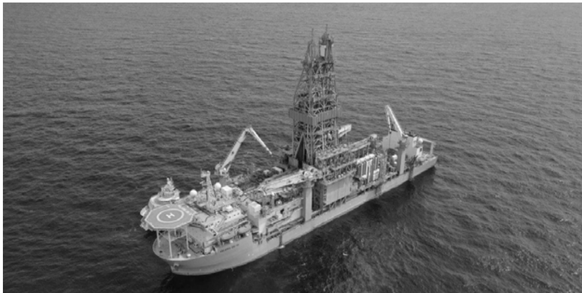
El buque Valaris DS-17 encarará las tareas de búsqueda de petróleo en el Mar Argentino. - EconoJournal -

Partió el sábado desde Mar del Plata rumbo a la Cuenca Argentina Norte -a más de 300 kilómetros de la costa- para iniciar la perforación del pozo offshore exploratorio Argerich X1.