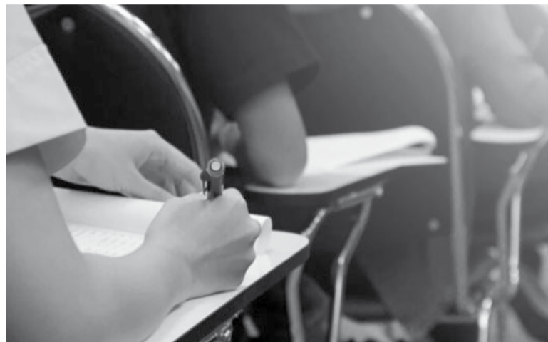
AIEPBA. Habilitan un canal de consultas online para que las familias puedan evacuar dudas.