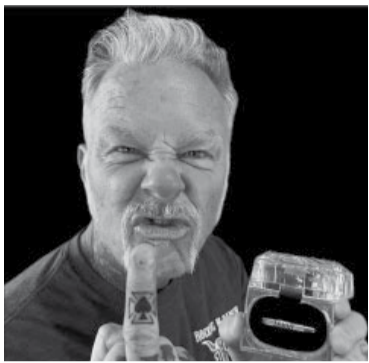
James Hetfield muestra el tatuaje.