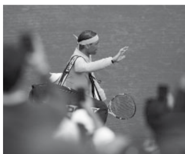
Tal vez, su último partido en suelo catalán. - Barcelona Open -

El rival de Real Madrid en las semifinales de la Champions será Bayern Múnich, quien ayer de-