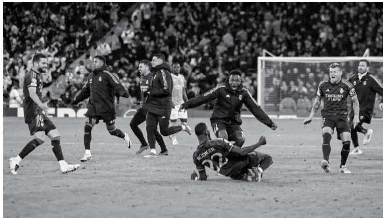
Revancha. El Madrid había sido eliminado por el City en la edición pasada. - Real Madrid -