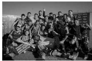
"Pásame la botella". - Chacarita -