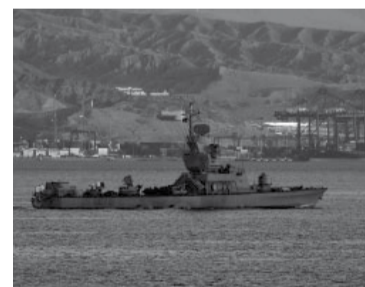
Israel continúa con el despliegue de sus defensas.

"El Cachila" fue detenido al comienzo de la investigación, pero quedó libre ya que dio negativo el cotejo de su ADN con el material genético hallado en los objetos de la víctima, pero en 2019 la Justicia uruguaya lo volvió a imputar y lo detuvo como encubridor al concluir que "estuvo presente antes, durante y después del homicidio" de la adolescente. - DIB -