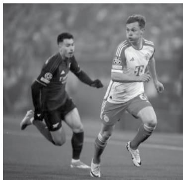
Bayern Múnich tachó al Arsenal. - Bayern -

Hasta que a los 30 llegó el merecido empate de los de Guardiola. Doku, ingresado por Grealish en el extremo izquierdo, llegó hasta el fondo y tiró un centro al área chica. Rüdiger se encontró con la pelota y rechazó mal, dejando la bola servida para De Bruyne, quien controló y con el segundo toque remató bien alto