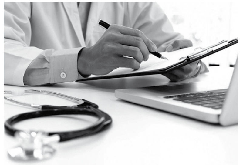
En la mira. Pese a la intención de que el mercado se autoregule, la cartelización de las empresas obligó a Milei y cía a intervenir.

El anuncio se da luego de la fuerte polémica por los exorbitantes incrementos que las compañías aplicaron desde diciembre del año pasado muy por encima de la inflación general. De hecho, las subas van del 143% al 165% en lo que va del año. Al desagregar esa información, se observa que en enero las variaciones en las cuotas de esas cinco empresas habrían fluctuado entre 39,8% y 44%; entre 27,5% y 29,4% en febrero; en marzo, entre 19% y 22,9% y en abril, entre 14% y