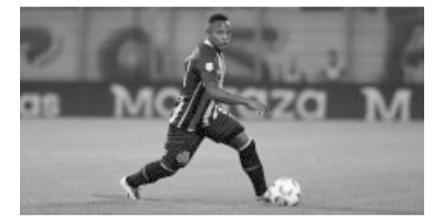
Campaz convirtió para el "Canalla". - CARC -