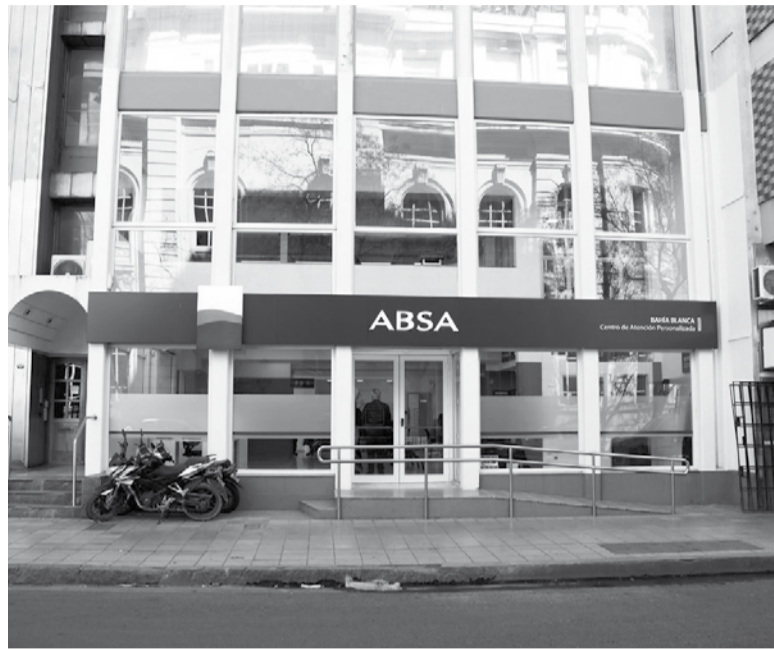
Salvataje. La transferencia fue confirmada en el Boletín Oficial.

En la resolución, se indica que el subsidio había sido solicitado por ABSA tras la devaluación de diciembre impulsada por la administración de Javier Milei, "lo que provocó un fuerte impacto sobre las finanzas de la empresa y en particular sobre la deuda con