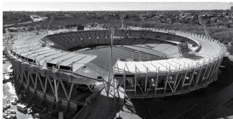
Sede. El estadio que tendrá el plato fuerte del fin de semana.