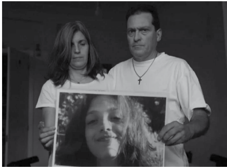
Condena. La familia de la adolescente argentina de 15 años esperaba la pena máxima.

Moreira fue liberado en junio de ese mismo año tras la absolución de primera instancia, pero volvió a ser detenido durante unos meses por violar una res-