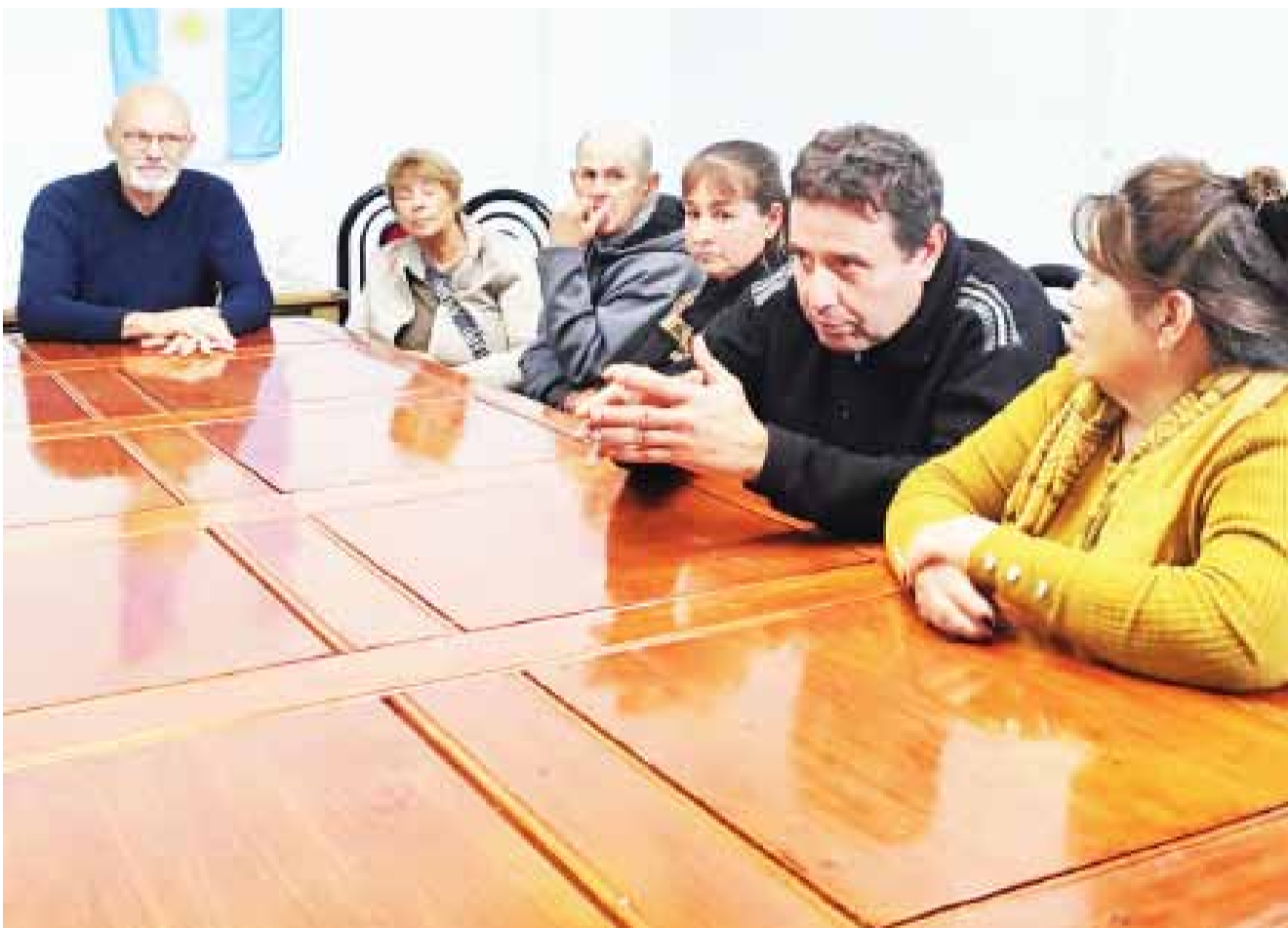
mercado bonaerense es nuestro propósito más

Sarraúa manifestó la importancia de crear este espacio de colaboración e intercambio, y convocó a todos los productores locales a sumarse a la Mesa: "Volcarlos al