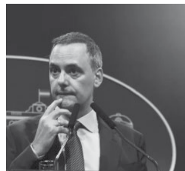
Cumplirá la misma función, pero ya no como vocero.

“El gasto que demande el cumplimiento de la presente medida será atendido con los créditos asignados a la Jurisdicción 20.01”, agrega la resolución sobre el au-