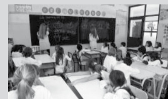
Un maestro pasaría a cobrar $ 420 mil.

El Gobierno bonaerense ofertó ayer a los docentes un incremento promedio del 9,5% de bolsillo para abril y, si la propuesta tiene el "ok" de los gremios, un maestro de grado con jornada simple que recién se inicia pasará a cobrar $ 420 mil. La oferta está siendo evaluada por los sindicatos que componen el Frente de Unidad Docente Bonaerense. Según pudo saber DIB, por fuentes gremiales, Suteba definirá hoy si la acepta o no, mientras que la respuesta de la FEB llegaría el viernes.