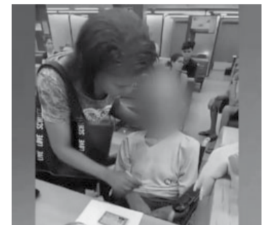
El hombre llevaba horas fallecido.