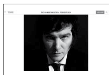
La portada web de la publicación internacional. - Revista TIME -

La periodista reconoce que mientras “decenas de miles de manifestantes salieron a la calle”,