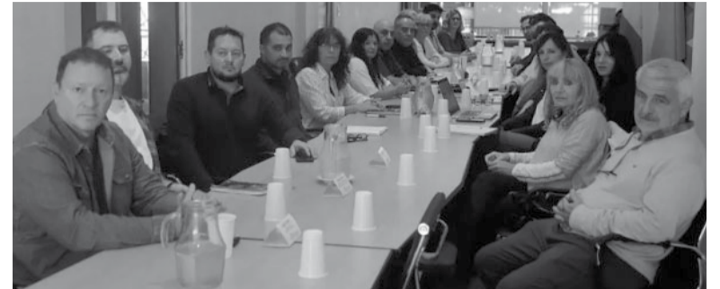
Gremios y Gobierno bonaerense, en negociaciones.

Desde el gremio convocaron a realizar asambleas presenciales en las 20 departamentales hoy para analizar la oferta.