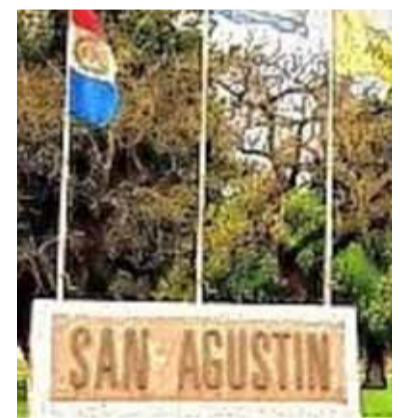
Robo. En la comuna de San Agustín

“La comuna tiene seis cuentas, hay una mayor donde está todo el dinero y las otras en distintas repar-