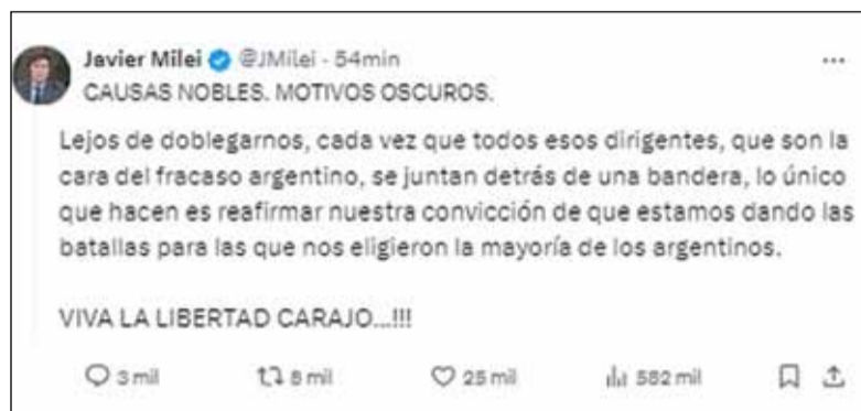
Posteo. Del presidente en redes sociales

En ese sentido, apuntó contra dirigentes del peronismo, el radicalismo y gremiales: “Ayer vimos las mismas