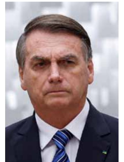
Expresidente. Jair Bolsonaro

En el marco del primero de estos casos, la Policía ordenó el 8 de febrero que Bolsonaro entregue su pasaporte y le impidió salir del país. La decisión fue apelada por la de-