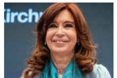
En Quilmes. Estará Cristina Fernández de Kirchner

“Esa misma noche escuché al presidente Javier Milei por cadena nacional explayarse sobre el resultado de su gobierno al que calificó de ‘milagro económico’ y ‘hazaña