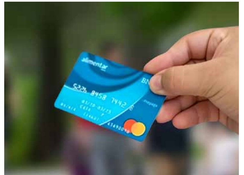
Alimentar. En mayo tendrá un aumento

El Gobierno anunció un nuevo aumento de la tarjeta Alimentar. Los hizo por medio del ministerio de Capital Humano, a cargo de Sandra Pettovello.