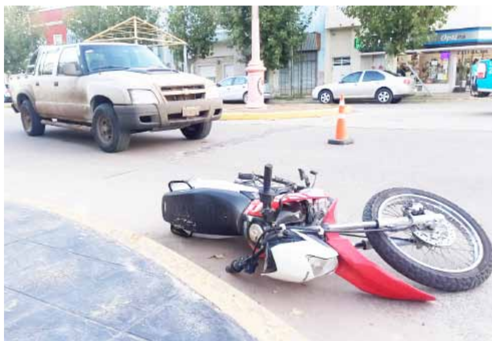
Una postal que se repite a diario, la moto en el piso, su ocupante trasladado al Hospital.