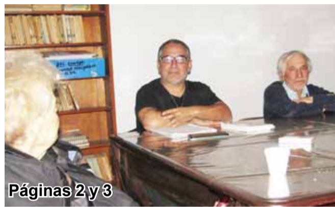
Páginas 2 y 3