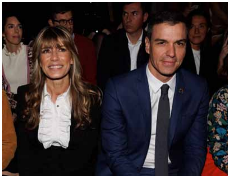
Crisis institucional. Pedro Sánchez y Begoña Gómez

"estrategia de acoso y derribo que lleva meses perpetrándose".