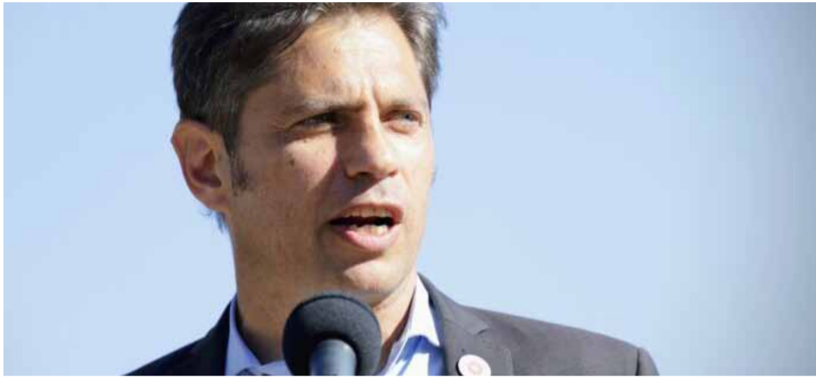
Dura crítica. El gobernador Kicillof volvió a castigar al presidente Milei

El gobernador bonaerense se refirió a la marcha universitaria