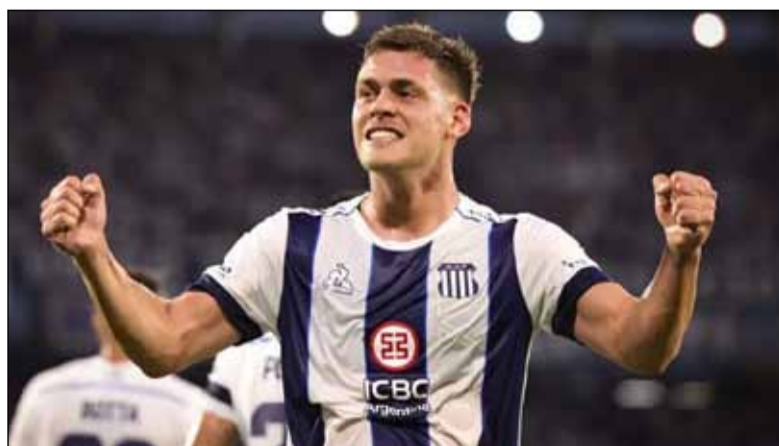
En Chile. Talleres visita a Cobresal