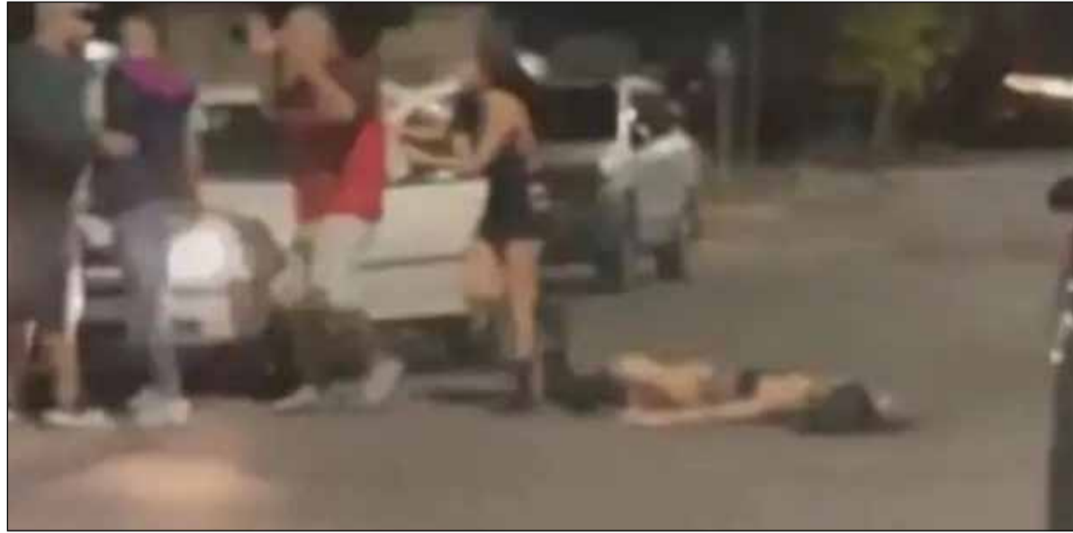
Golpeados. Imagen del video donde se observa la golpiza a una joven en Mendoza

La chica de 29 años estaba acompañada por sus hermanos y amigos