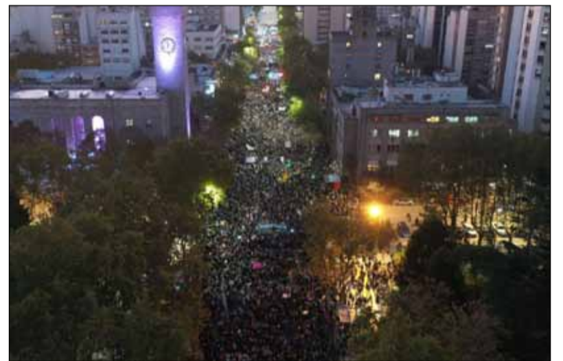
En Mar del Plata. Gran cantidad de universitarios y vecinos participaron de la convocatoria

Tandil: sede de la Universidad Nacional del Centro (UNICEN). La movilización comenzó a la mañana con una “Caravana vehicular por la