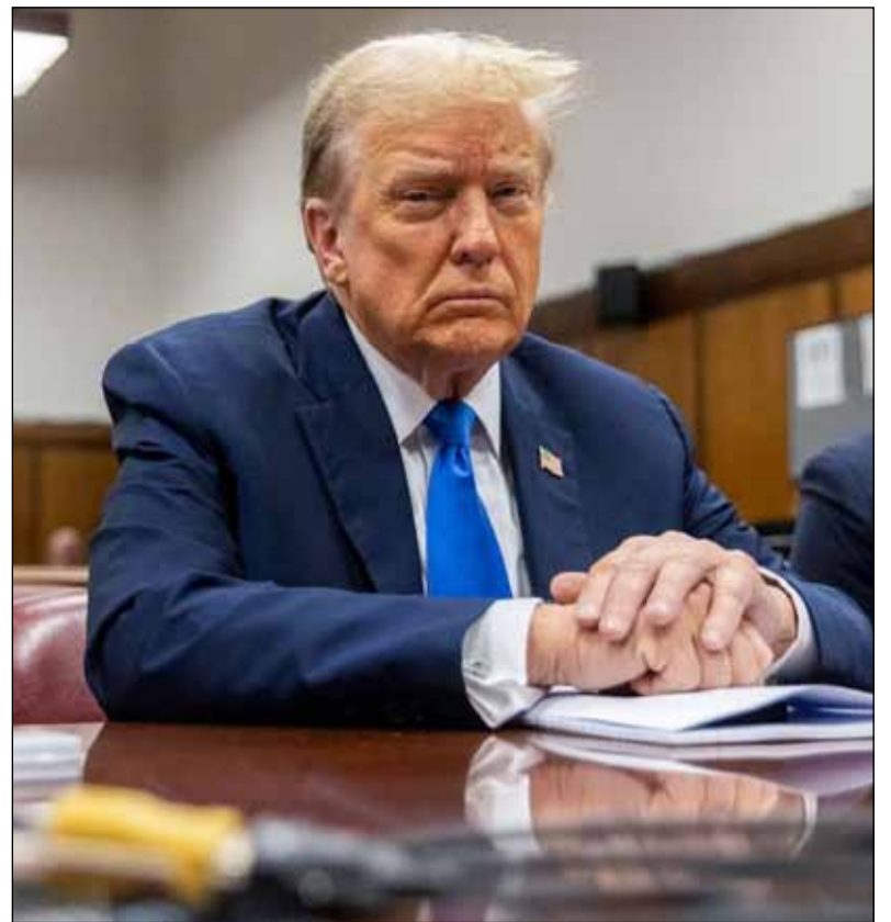
Histórico. El expresidente estadounidense, Donald Trump, en el banquillo de los acusados

“Me preguntaron qué podía hacer y qué podían hacer mis revistas