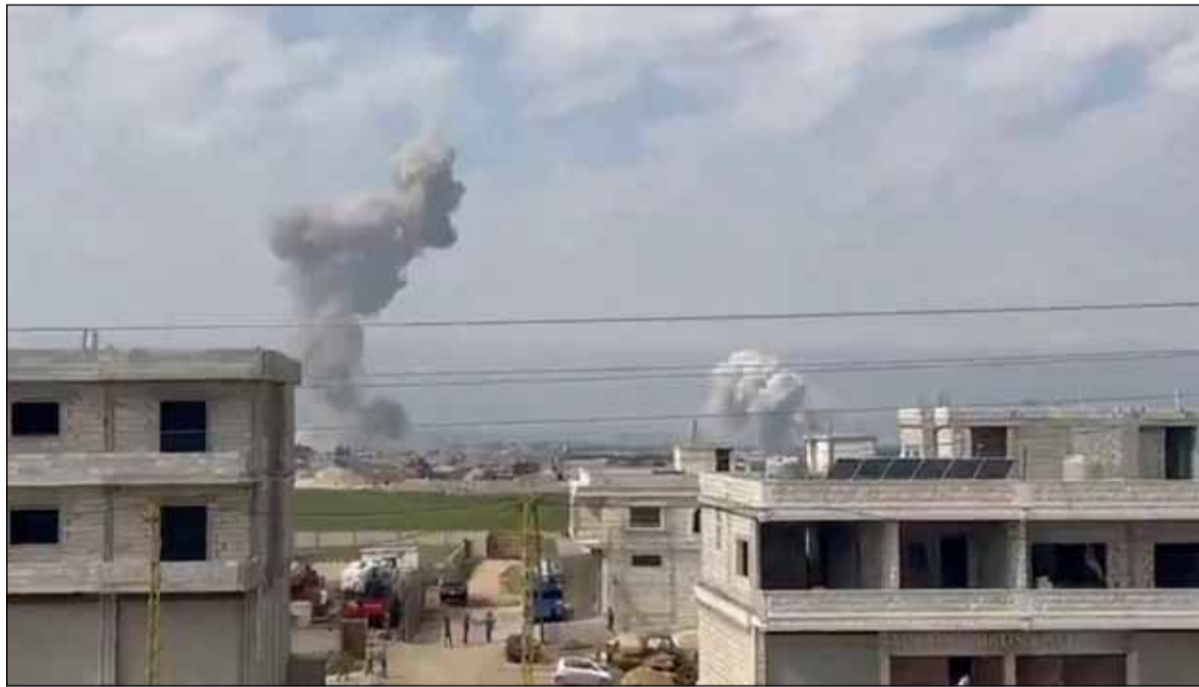
Ataques. Continúan los enfrentamientos en Israel

El grupo terrorista Hezbollah, respaldado por el régimen de Irán, dijo el martes que lanzó docenas de cohetes contra el norte de Israel en respuesta a la muerte de dos civiles en un ataque atribuido a Israel en el sur del Líbano.