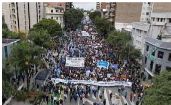
La marcha en Córdoba.