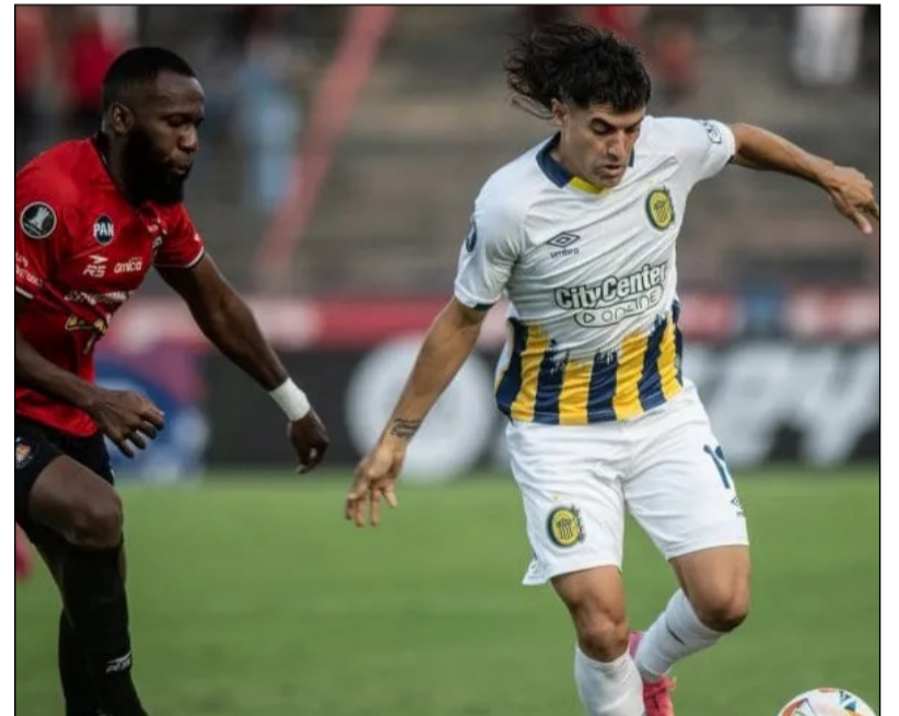
Empate. Central se trajo un punto de Venezuela