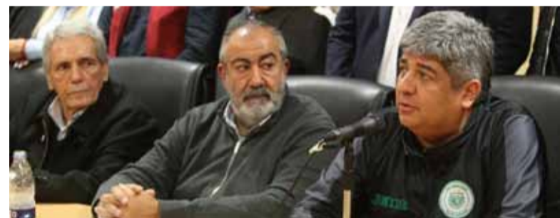
CGT. Dura crítica de los dirigentes

La Confederación General del Trabajo (CGT) criticó la cadena nacional realizada por el presidente Javier Milei y afirmó que el mandatario debería haber anunciado "deudas gemelas", al señalar que resultado fiscal logrado por el Gobierno es consecuencia por una "brutal recesión" y que en "un 70%" se debe al ajuste en las partidas destinadas a jubilaciones y pensiones, subsidios y obras públicas.