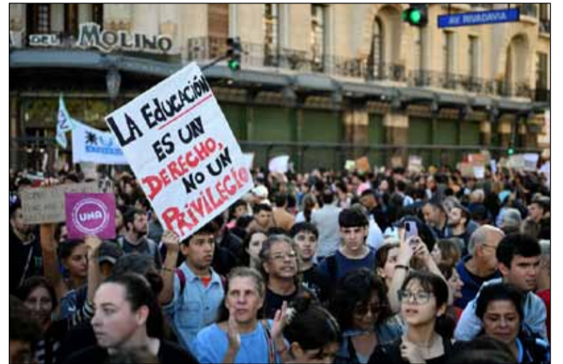
Multitudinaria. La marcha en favor de la educación pública, hasta Plaza de Mayo

“Todos los problemas que tenemos se resuelven con más