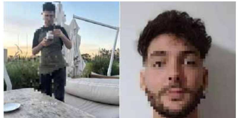
Denuncia. Contra un mozo de un local comercial

Además, el caso se expuso a través de las redes sociales y se viralizó la foto, a partir de la cual salieron a la luz testimonios que dan cuenta que el sujeto sería una persona “exhibicionista que ya habría cometido este tipo de conductas inapropiadas frente a menores de edad u otras personas”.