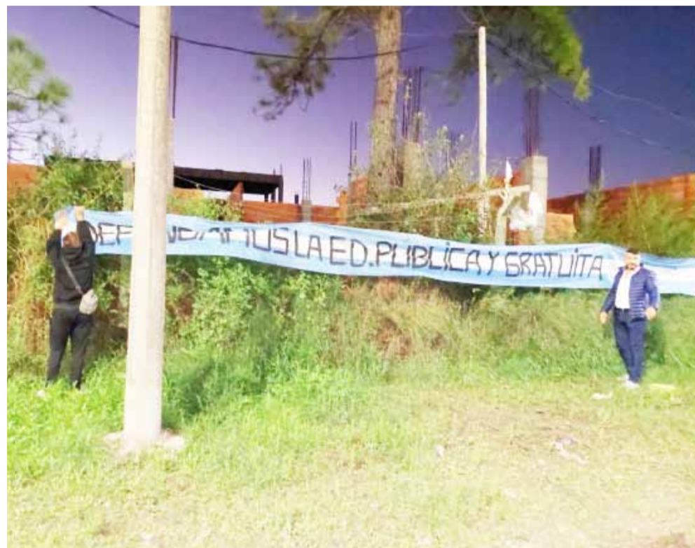
Al término del acto los presentes fueron hasta el lugar donde se comenzó la construcción del edificio propio para el ISFDyT, ahora paralizada, y allí se dejaron las banderas de reclamo.

versitario se encuentran detenidas, lo que afecta la calidad de las instalaciones y el adecuado funcionamiento de las instituciones.