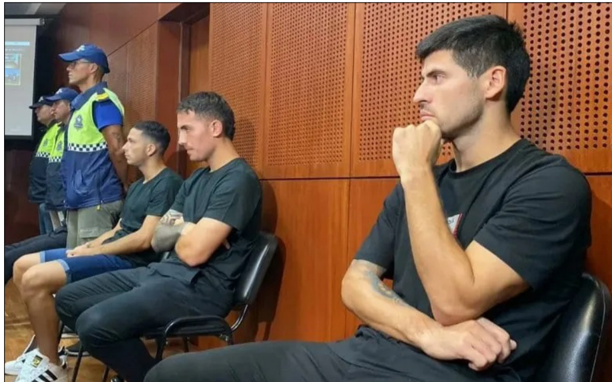
Acusados. Los tres ahora exjugadores de Vélez, siguen en Tucumán