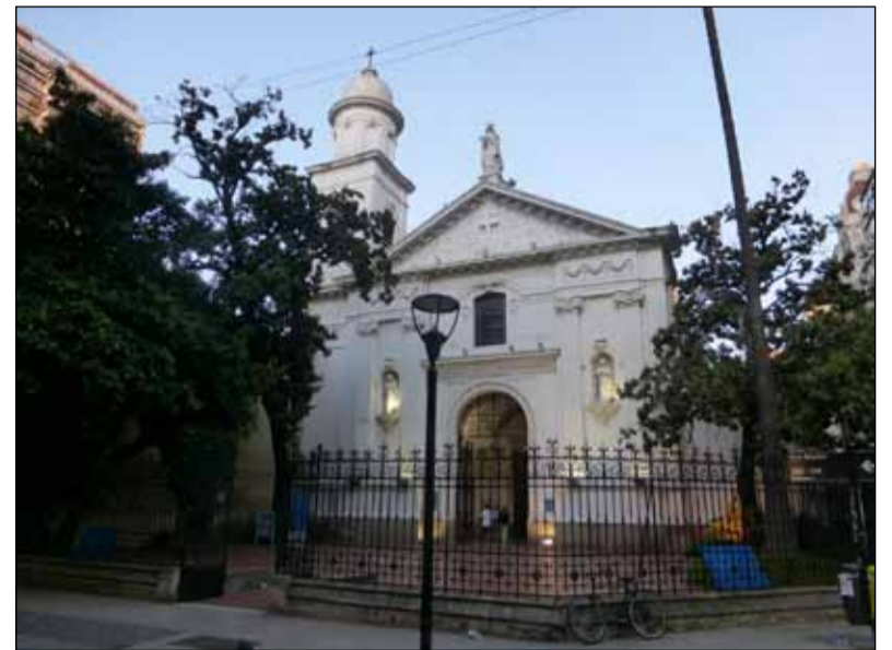
Emblemática. Iglesia de Buenos Aires

La iglesia Santa Catalina de Siena, uno de los puntos turísticos más icónicos de la ciudad de Buenos Aires, sufrió un incendio durante la madrugada de ayer que causó una intensa columna de humo negro y generó la preocupación de los vecinos. Se trató de un incidente menor, según indicaron desde el gobierno porteño, en el que no hubo que lamentar víctimas, aunque sí algunos daños materiales.