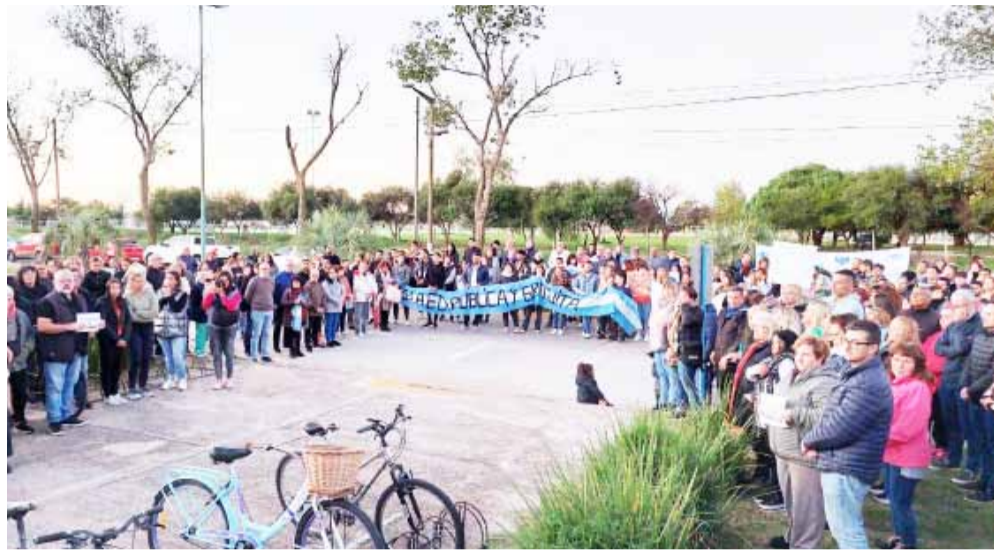
La marcha en Bolívar partió del Instituto 27 y se concentró delante del CRUB.

Por último, se recorrieron los pocos metros que separan la sede del Centro Regional Universitario de la obra del nuevo edificio del Instituto 27, paralizada por estos días, en cuyo frente se dejaron las banderas y carteles que llevaron.