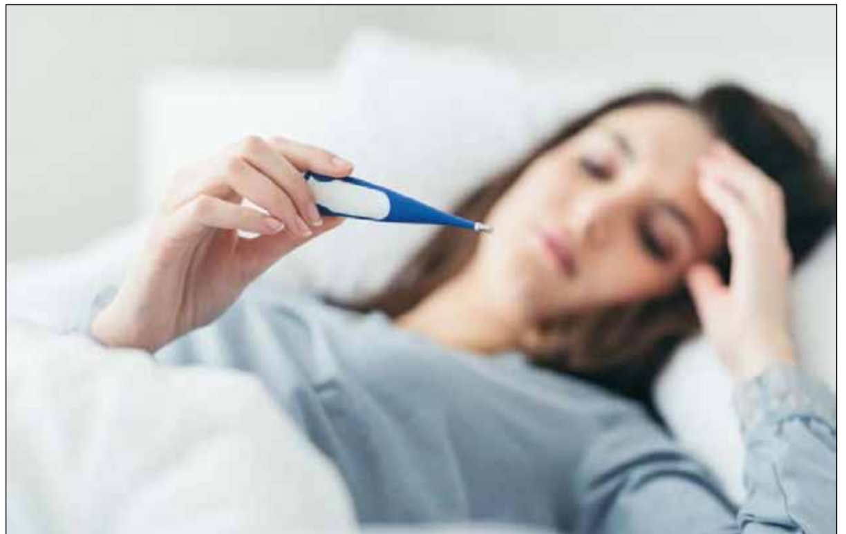
La enfermedad continúa en ascenso en la provincia y el resto del país

La fase febril puede durar hasta siete días y es la que manifiesta la enfermedad. Se caracteriza por fiebre alta y constante, de entre 38 y 40 grados, malestar general, dolor de cabeza y articular, molestias musculares e irritación de la piel con enrojecimiento. Se recomienda