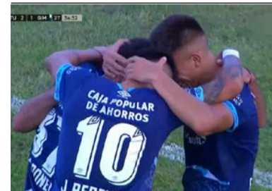
Atlético lo dio vuelta