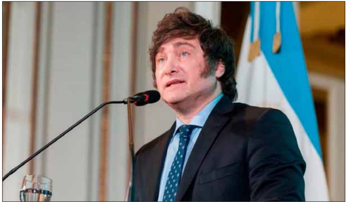
Javier Milei mantiene su imagen ante la sociedad

Una vez que todas las partes den el visto bueno, la iniciativa será girada para su tratamiento parlamentario, aunque en Balcarce 50