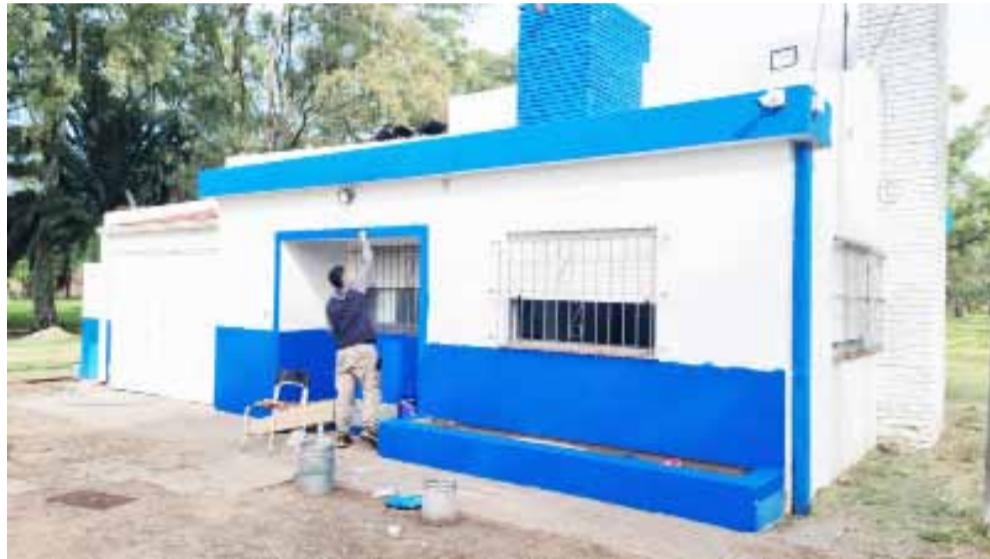
La Policía Científica ocupará la casa que históricamente ocupó el cuidador del parque.