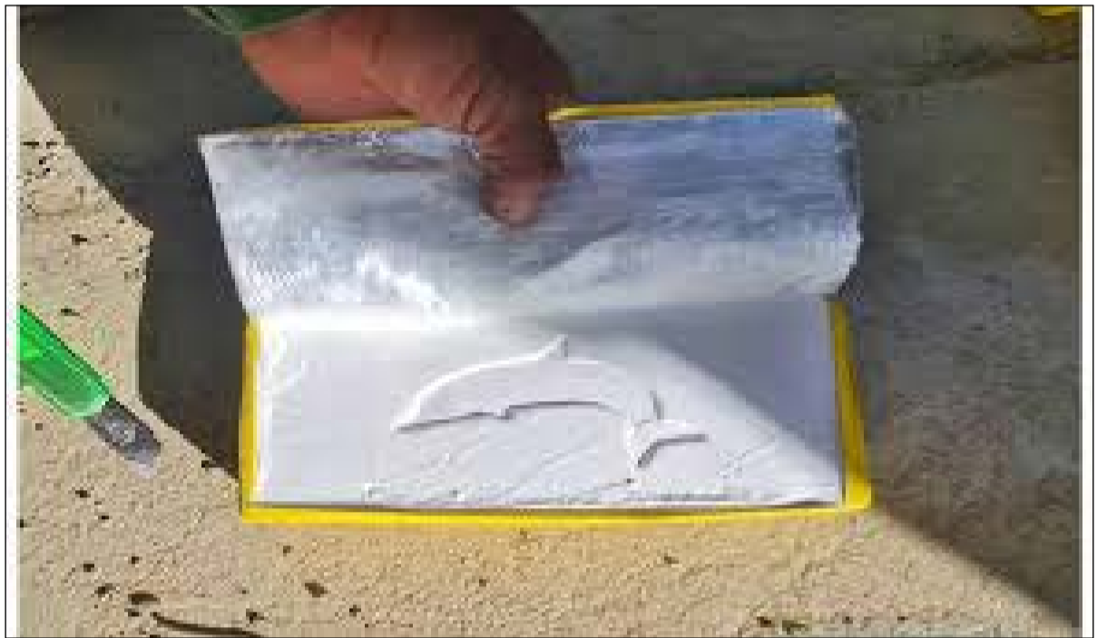
Secuestraron más de 16 kilogramos de cocaína que intentaban ingresarla al país

"Ese color en los paquetes suelen marcar el grado de pureza de la droga: son de alta calidad, arriba del 90% y de producción peruana, de mayor concentración y firmeza. Ese código lo comenzó a usar un clan