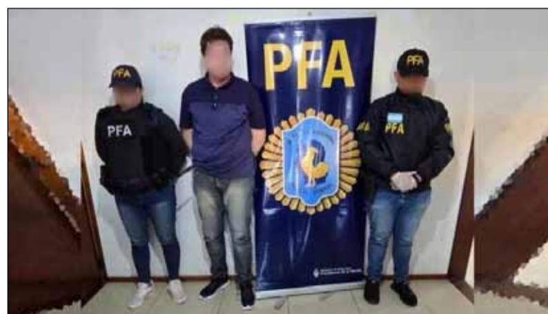
El hombre quedó a disposición de la justicia

asunto la Unidad de Investigaciones Antiterrorista de la Policía Federal Argentina que, a través de precisas y exhaustivas investigaciones, logra ubicar al responsable de las amenazas.