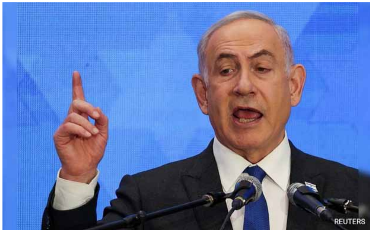
Benjamin Netanyahu habló tras seis meses de enfrentamiento en Franja de Gaza

“Ciudadanos de Israel, no hay guerra más justa que esta y estamos decididos a terminarla con una victoria total”, dijo Netanyahu, además de enumerar los tres objetivos que repite desde octubre: devolver a los secuestrados, eliminar a Hamas en toda la Franja de Gaza, “incluida