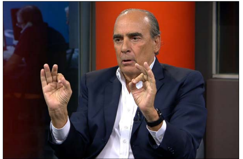
Guillermo Francos, ministro del Interior de la Nación

"Beneficia mucho la actividad económica y productiva en un montón de provincias que tienen gran cantidad de recursos y están esperando inversiones muy fuertes. Y hay inversores externos e inter-