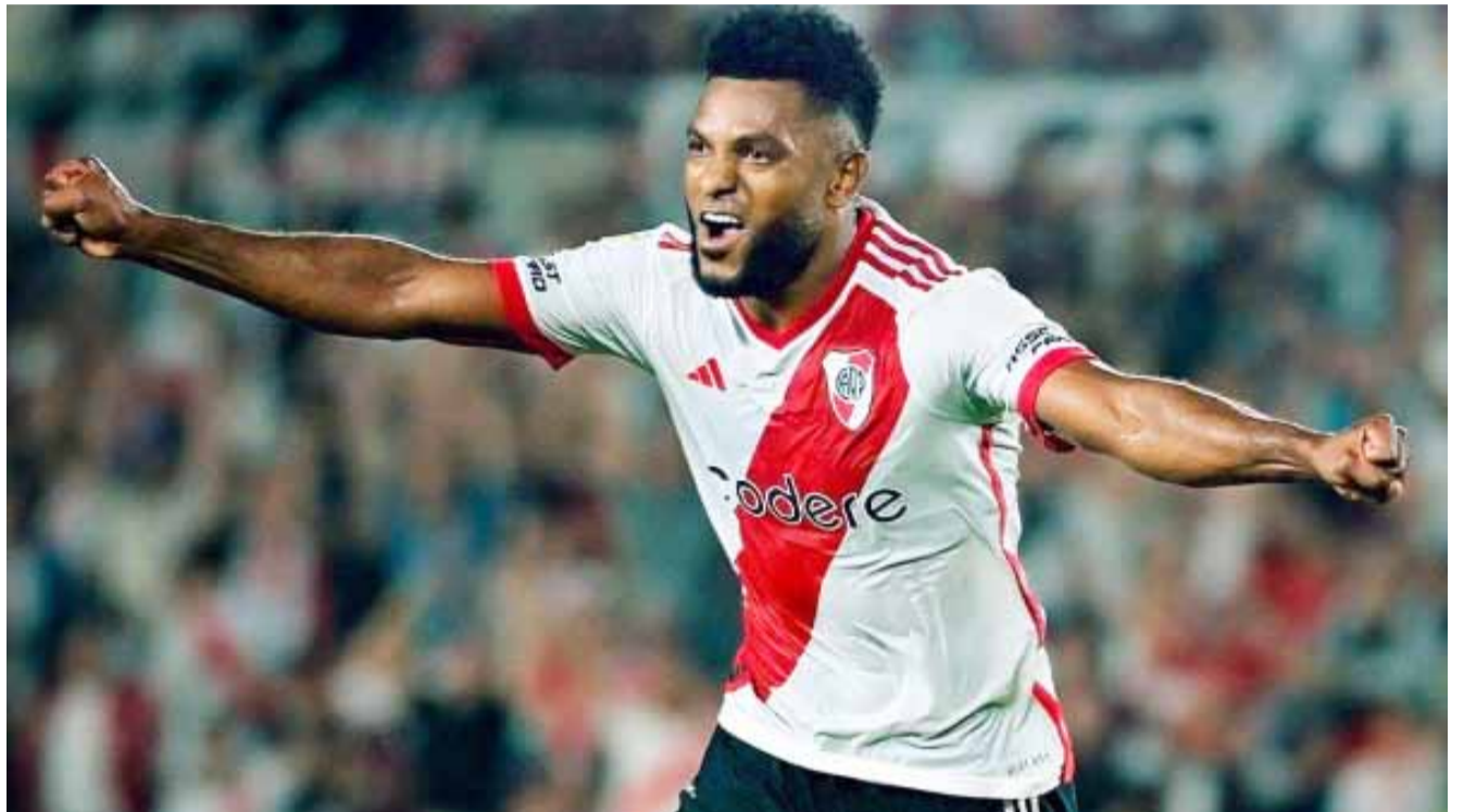
FÚTBOL - COPA DE LA LIGA