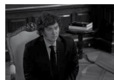
La entrevista se emitirá el próximo domingo.

Luego, López Obrador respondió criticando las primeras medidas de la gestión de Milei: “Llega el nuevo gobierno y dice que se acaban los subsidios, ya no va haber inversión pública, el que quiere estudiar tiene que pagar, el que se enferma tiene que pagar... ese es el modelo neoliberal. El Estado en Argentina asume las deudas de una élite de potentados. (...) Es quitarle a los de abajo para darle a los de arriba, eso