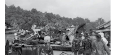
Hay cinco desaparecidos.