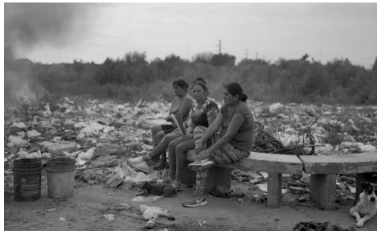
Nuevos datos. La pobreza y la indigencia aumentaron en la última mitad del año pasado.

La incidencia de la pobreza respecto al primer semestre de 2023 registró una suba tanto en los hogares como en las personas, de 2,2 y 1,6 puntos porcentuales, respectivamente. En el caso de la indigencia, mostró un aumento de 1,9 puntos porcentuales en hogares y de 2,6