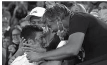
Uno de los dúos más exitosos.

sino también muchas risas, diversión, clasificaciones de final de año como número 1, logros que batieron récords y 12 Grand Slams más (y unas cuantas finales) a la cuenta desde entonces", agregó el actual número 1 del mundo.