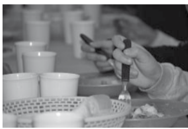
Complicación burocrática.

Un nuevo frente de conflicto entre el gobierno nacional y el de la provincia de Buenos Aires se abrió ayer luego de que el ministerio de Capital Humano anunciara la transferencia de la