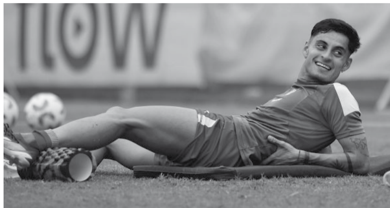
Alivio. La evolución del mediocampista chileno es favorable.

Esa fue la primera foto que se difundió del futbolista después de convulsionar en pleno partido entre Estudiantes y Boca por la