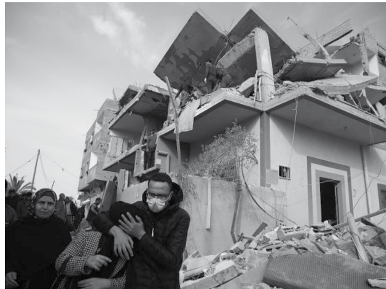
Temor. Más de un millón de personas sobreviven en el extremo sur de la zona del conflicto.

Al menos 32.000 palestinos murieron en la ofensiva israelí contra Gaza, gobernada por Hamás, según el Ministerio de Sanidad, y se cree que hay miles de muertos más que no fueron recuperados bajo los escombros. La