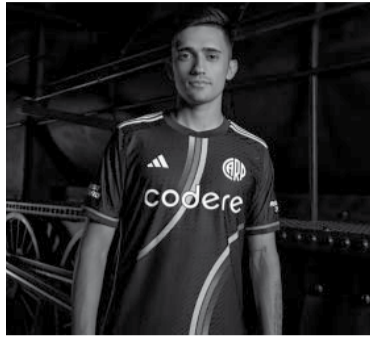
Inspirada en "La Máquina". - Internet -