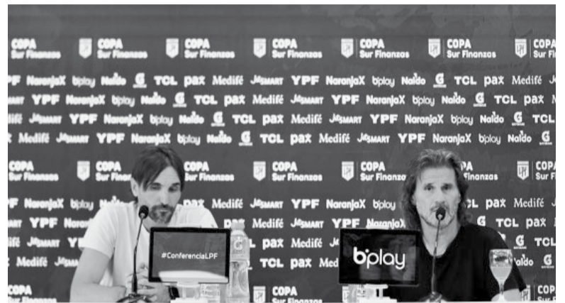
Prevía. Los técnicos palpitaron la "final" del sábado. - @LigaAFA -

Después de la exitosa gira de la Argentina en Estados Unidos, Lionel Scaloni bajó un claro mensaje a los jugadores. "Garantizar, a ninguno de los que ha venido acá, sólo al que no vino y ya saben (por Lionel Messi). El resto, pico y pala. Bueno, a 'Fideo' también lo vamos a meter, también tiene garantizado", dijo en referencia a los futbolistas confirmados para la Copa América. - DIB -