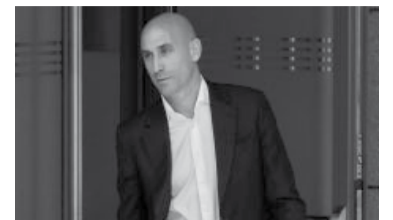
El expresidente de la Federación Española de Fútbol.