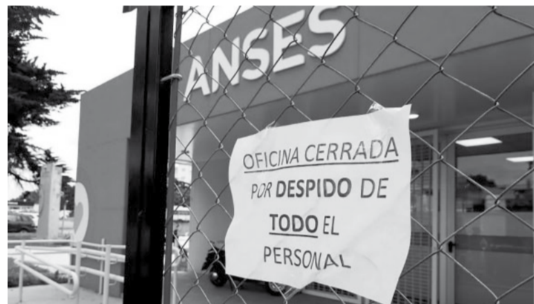
Aclaración. En su conferencia, Adorni aclaró el número final de contratos despedidos. - X -

“Hubo bastante confusión con respecto a los números, así que está bueno aclararlo”, comenzó a modo de introducción para hablar