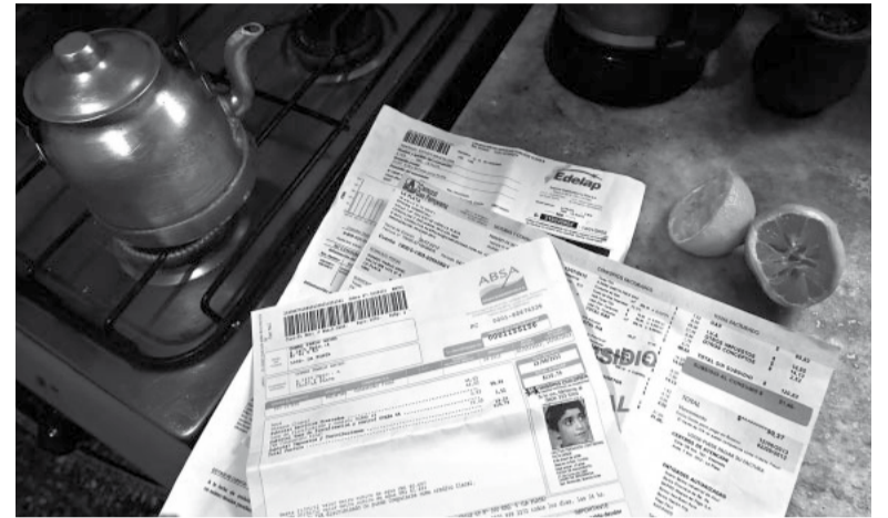
El "tarifazo" se firmará la próxima semana.

Es por la quita de subsidios a hogares, industrias y comercios. Rondará el 300%.