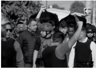
El mandatario, camuflado.