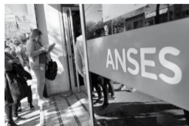
El pago comenzará el 10 de abril.

“La reciente modificación de la movilidad y sus consecuentes adelantos, generará un desdoblamiento del pago prestacional, a fin de no demorar el acceso de los beneficiarios a sus haberes”, señaló la Anses en un comunicado.