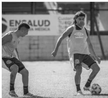
Última chance para el "Canalla". - CARC -