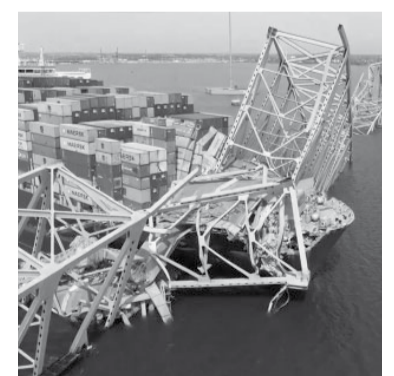
Los buzos trabajan en el lugar.

El barco, de 289 metros de eslora, había informado de una pérdida de propulsión poco antes del impacto y echó el ancla para ralentizar la marcha, lo que dio tiempo a las autoridades de transporte a detener el tráfico en el puente antes del choque. Esa medida probablemente evitó un mayor número de víctimas mor-