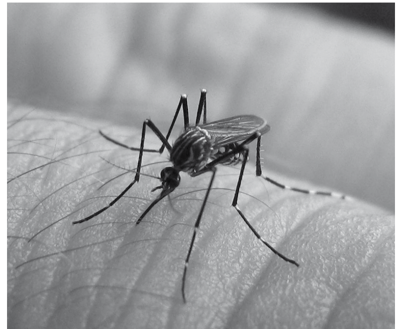
Dengue. El brote pasa por "su peor momento" y aún se aguarda el pico de casos.

En momentos en los que se contabilizan más de 150 mil casos a nivel nacional y unos 35.000 en la provincia de Buenos Aires es importante estar atentos a los síntomas: fiebre, malestar general, dolor corporal intenso, dolor de cabeza y retroocular (atrás de los ojos), náuseas, vómitos y en algunos casos sarpullido. La característica del dengue, además, es que no produce síntomas respiratorios, por lo que es fácil no confundirlo con otros cuadros