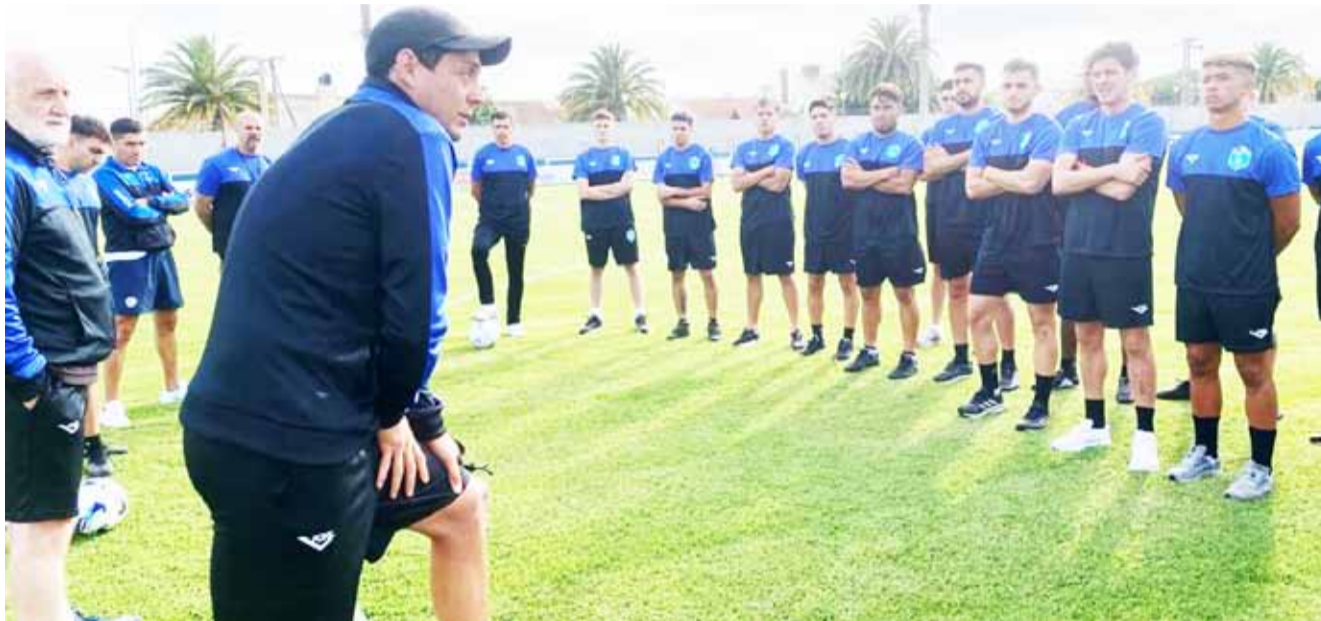
El Ciudad iniciará su tercera temporada en la competencia más federal del país.

A diferencia de la edición 2023, esta competencia será en su primera fase a dos ruedas (anteriormente fue a cuatro), lo que sin dudas hará menos monótona esta instancia. El rival que enfrentará en esta oportunidad será a Gutiérrez de Mendoza, uno de los recientemente ascendidos al igual que