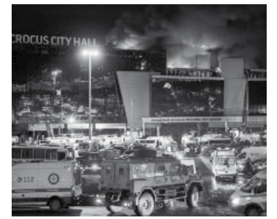
Terror en Moscú.

El alcalde de Moscú, Sergei Sobyenin, calificó el atentado de “gran tragedia” y dijo que hay muertos. “Hoy ha ocurrido una terrible tragedia en el Crocus City. Lo siento por los seres queridos de las víctimas”, dijo el funcionario, que añadió que se brindará toda la asistencia necesaria a los heridos