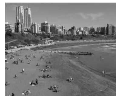
La ciudad de Mar del Plata.

"Nosotros, los trabajadores y las trabajadoras, venimos aguantando estas medidas peor que nadie. Más allá de haber tenido un acuerdo salarial importante, con la inflación de estos tres meses venimos