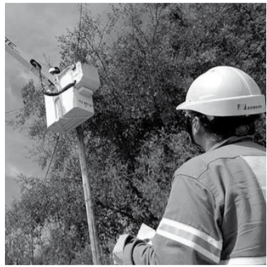
La luz, muy cara.