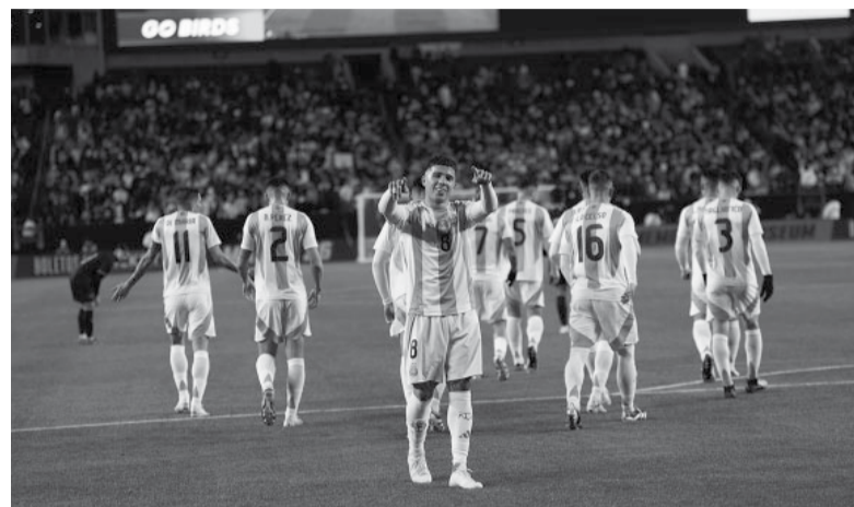
A la altura. Argentina abrió el año con una sonrisa.