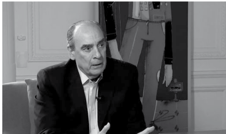
Lapidario. El ministro Francos dijo que el sistema está “re quebrado”.

Así, la fórmula de actualización sería sencilla. Se aplicaría, sin más, el último dato publicado del Índice de Precios al Consumidor que da a conocer cada mitad de mes del Indec. Por ejemplo, como el ente estadístico publica los datos de inflación de febrero a mitad de marzo, para el haber de abril debería aplicarse ese guarismo, que fue del 13,2 por ciento. Así, con cada mensualidad, se aplicaría la inflación del antepre-