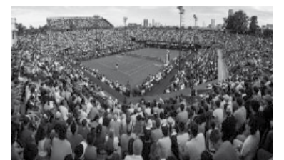
El Argentina Open, sin ascenso de categoría. - Argentina Open -

"Se confirma la decisión de ATP de sacar un ATP 250 a Argentina y a toda la región... de 4 torneos a solamente 3... sacarle torneos y posibilidades a todo Sudamérica no veo que sea una gran decisión. Una pena", escribió Diego Schwartzman en su cuenta oficial de X.