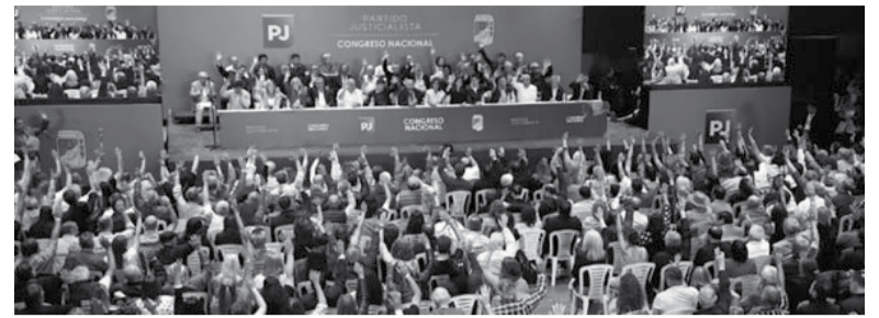
El Congreso del PJ reunido en el microestadio de Ferro. - x -

El partido realizó un Congreso nacional. Buscan sumar a sectores que se fueron.