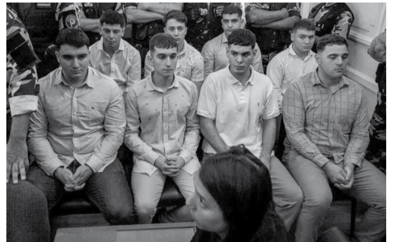
Juicio. Los 8 condenados por el asesinato del 18 de enero de 2020 en Villa Gesell.