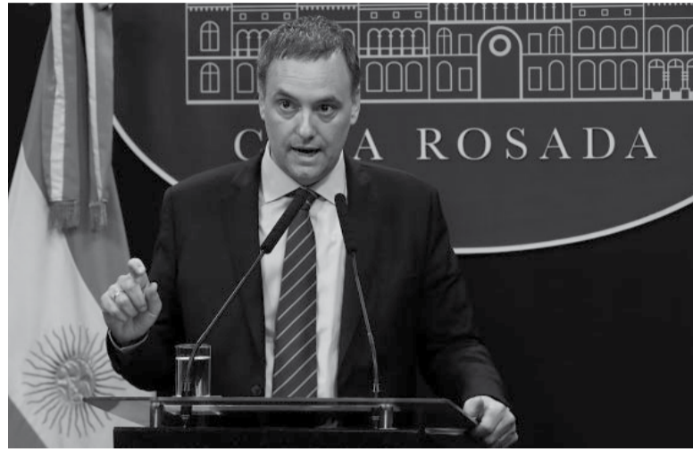
Están despedidos. El portavoz Adorni anuncia la medida. - Casa Rosada -