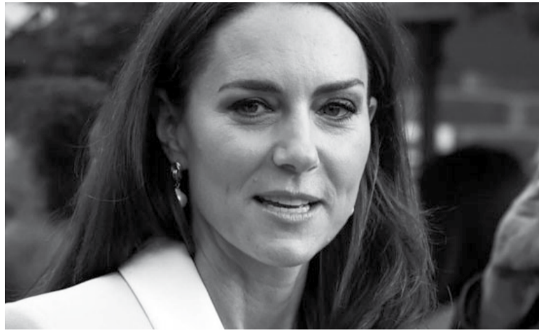
Heredera. La princesa de Gales, Kate Middleton.

“En enero me sometí a una cirugía abdominal importante en Londres y en ese momento se pensaba que mi condición no era cancerosa. La cirugía fue exitosa, sin embargo, pruebas realizadas después de la operación revelaron que había habido presencia de cáncer. Por lo tanto, mi equipo