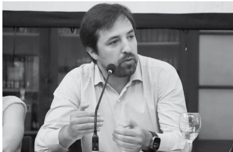
Dengue. El ministro de Salud bonaerense, Nicolás Kreplak explica el brote.

Además, explicó que "el 85% de los contagios se producen" en casas. Asimismo, dijo que las autoridades también deben "organizar el sistema de respuesta" a la