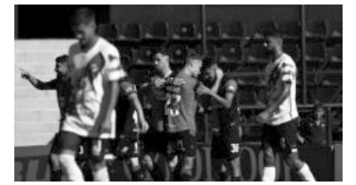
Festejo "leproso". - NOB -