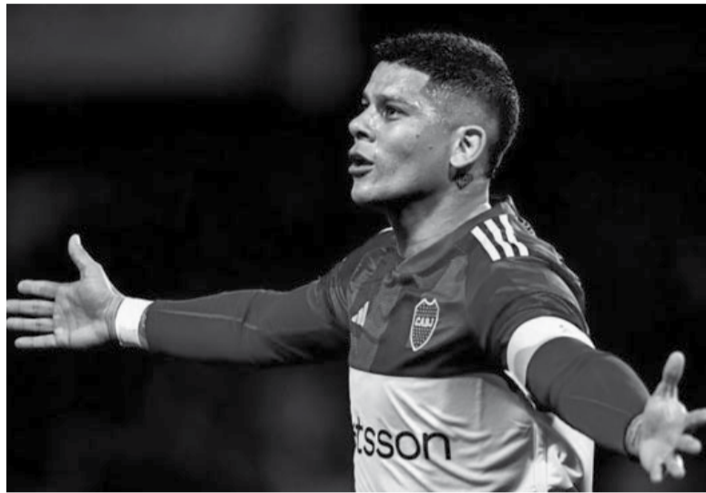
Recuperado. El capitán jugará por primera vez en el año.

Árbitro: Facundo Tello. Cancha: Madre de Ciudades. Hora: 20.30 (TyC Sports).