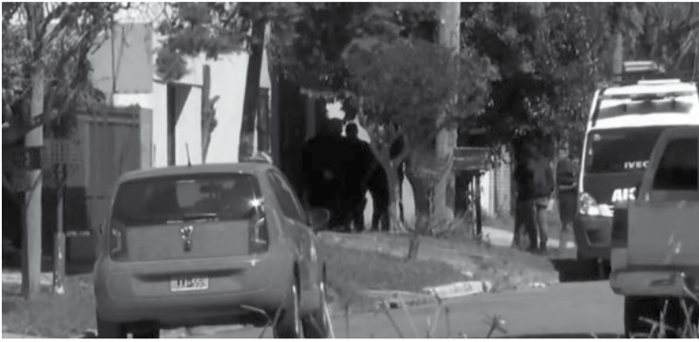
Asesinado a golpes en Luis Guillón. - Infobae -

Los delincuentes antes de irse admitieron que se habían confundido de casa.