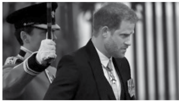
Reclamaba mayor custodia policial.