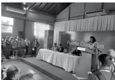
Última conferencia veraniega.

El gobernador Axel Kicillof recurrió ayer a una cita de Luis Miguel para apuntar a la política económica nacional como el