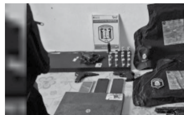
Parte de los elementos incautados.