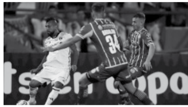
Debe remontar un 0-1. - Internet -