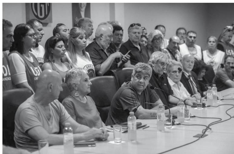
Reducción. Para los gremios, los salarios de los docentes hoy están por debajo de la línea de la pobreza.