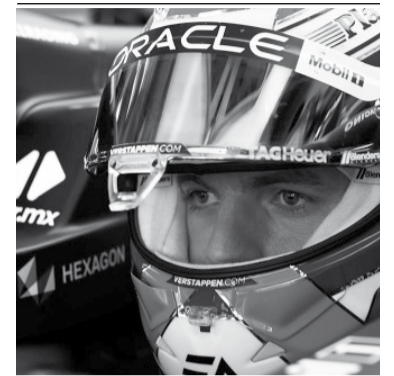
El show debe recomenzar. - Red Bull -