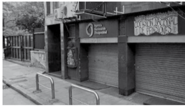
Eran contratados que trabajan en Pensiones. - DIB -