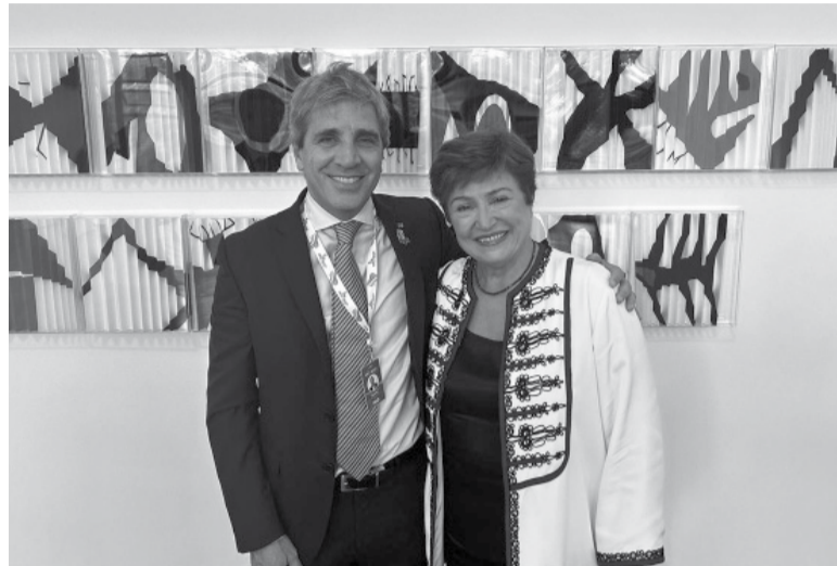
Presente. El ministro Caputo junto a Kristalina Georgieva. - @KGeorgieva -

En ese marco, propuso a sus pares del G20 "una tributación mínima global sobre la riqueza que podrá constituir un tercer pilar para la cooperación impositiva internacional", además de las iniciativas ya en marcha en la ONU y en organizaciones como la OCDE.