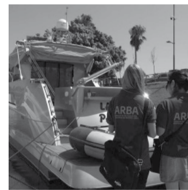
El pago único vencerá el 8 de marzo.

Asimismo, se informa que la Agencia de Recaudación notificará, a través del domicilio fiscal electrónico de cada una de las empresas alcanzadas por la medida,