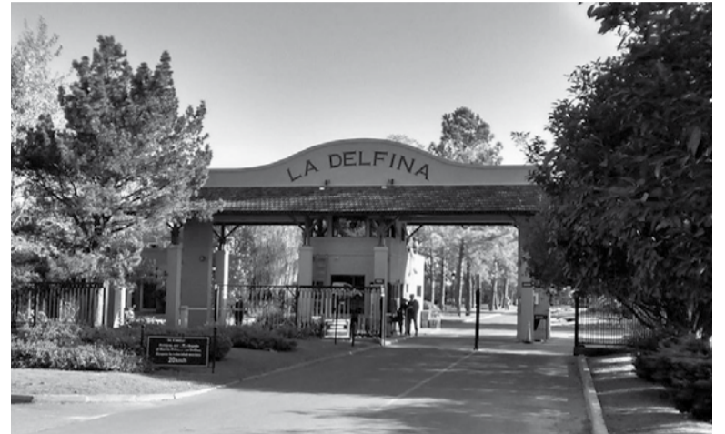
Mediático. El caso tomó relevancia por las similitudes con el de García Belsunce, ocurrido hace casi 22 años y aún sin certezas. - Internet -

También hay golpes en la cara, más precisamente en una ceja, la frente y hasta un corte en un pómulo, un fuerte golpe en la nariz y un corte interior producto de otro golpe en la boca, con una lesión