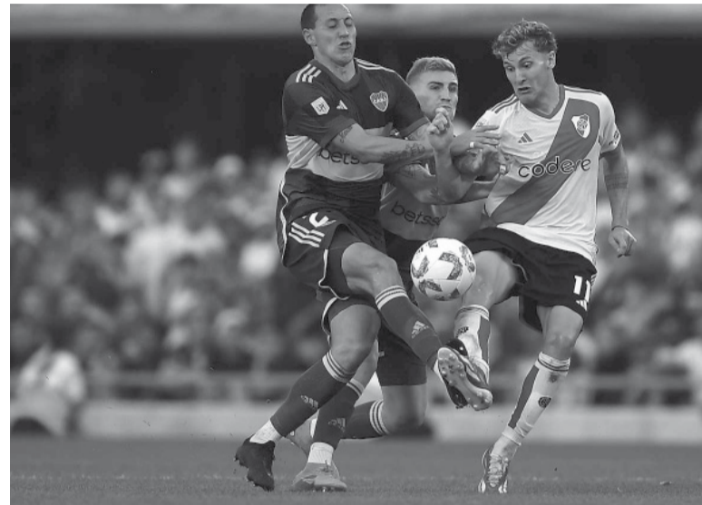
Importante. El defensor tuvo un buen nivel en todos los partidos.