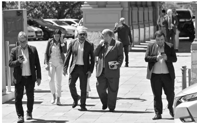
Encuentro oficialista. Las palabras del Presidente fueron dichas en una reunión con Diputados de LLA en Casa Rosada.

El cónclave se realizó ayer por la mañana y participaron 37 diputados nacionales de LLA, entre ellos el titular del bloque, Oscar Zago; el presidente de la cámara Martín Menem y las legisladoras Jimena Villaverde, Lilia Lemoine, Juliana Santillán, además de Alberto