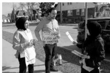
Pasó un round de las primarias demócratas.

Los resultados preliminares los acercan un poco más a una segunda edición de su duelo en las urnas de 2020, pero también revelan algunas de sus mayores vulnerabilidades