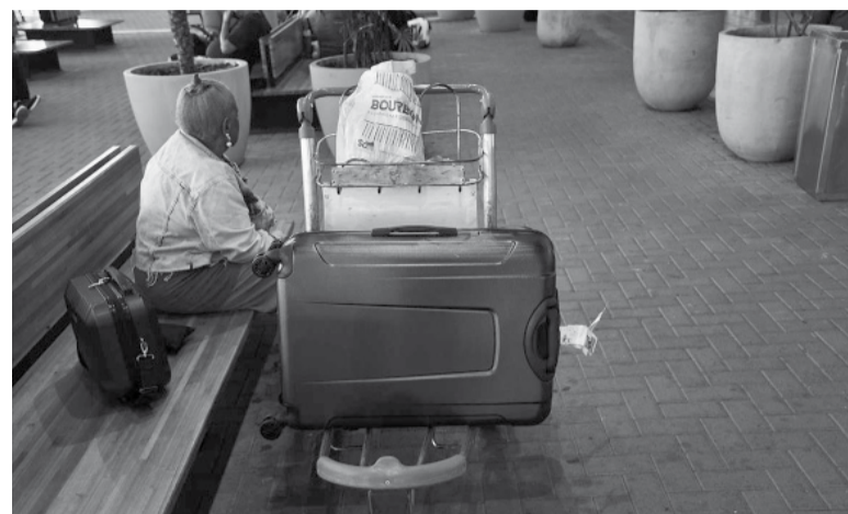
Más de 35 mil pasajeros resultaron afectados.

La medida de fuerza fue ratificada luego de que los sindicatos que prestan servicios de rampa no llegaron a un acuerdo salarial.