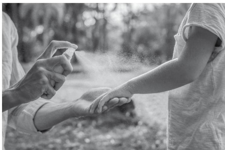
Alerta. Para la funcionaria de la cartera sanitaria bonaerense, se trata de un registro histórico de casos.

Sobre los mosquitos presentes en los distritos bonaerenses y el Área Metropolitana de Buenos Aires (AMBA), la funcionaria aclaró que los que aparecieron "como en