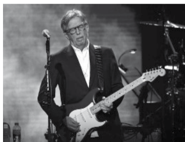
Cuarta visita al país del británico.

Hace varios días que se venía especulando con la posibilidad de que el músico -que este 2024 cumple 60 años de carrera- luego de que anunciara fechas en México y en Brasil y que la productora Move Concerts publicara un video donde se veía una guitarra Fender Stratocaster blanca y negra en un