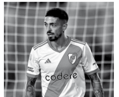
El 10 "millonario".