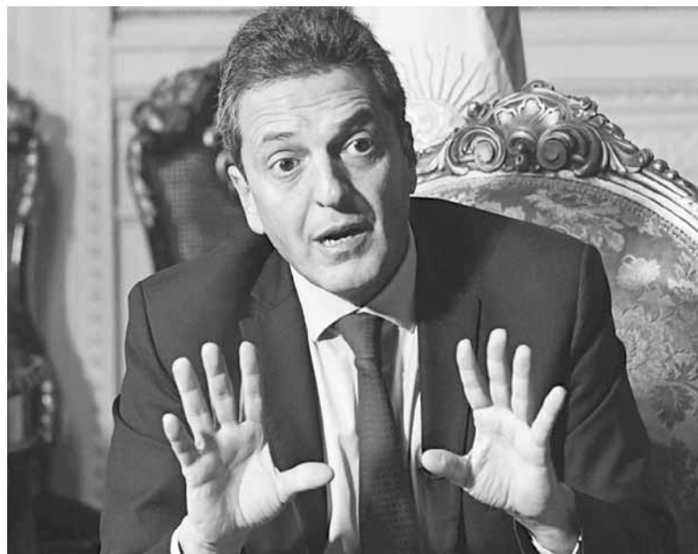
Momento decisivo. Massa definirá su postura frente a las elecciones.

Luego de los dichos de la dirigente massista, el ministro de Seguridad de la Nación, Aníbal Fernández, volvió a cuestionar la idea de ir con un postulante único