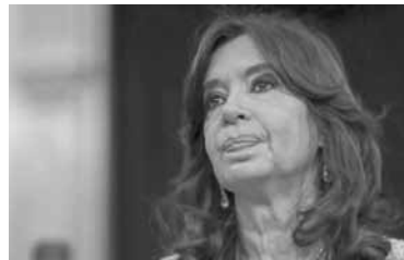
Cristina Fernández.