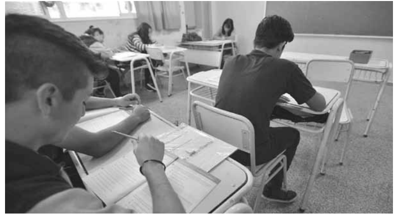
Decreto. Una medida que evitará la pérdida de horas de clase.

“Hasta el momento, los directivos de los establecimientos podían hacer coberturas con el propio personal de la institución por licencias hasta 4 días, pero esto se dificultaba cuando el período era superior, por los tiempos que lleva el procedimiento de selección y cobertura a través de los actos públicos”, explicó el ministro de Educación bonaerense, Alberto Sileoni. Y agregó: “Este decreto permite el reemplazo inme-