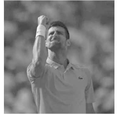
"Nole" va por su 23° Grand Slam. - RG -