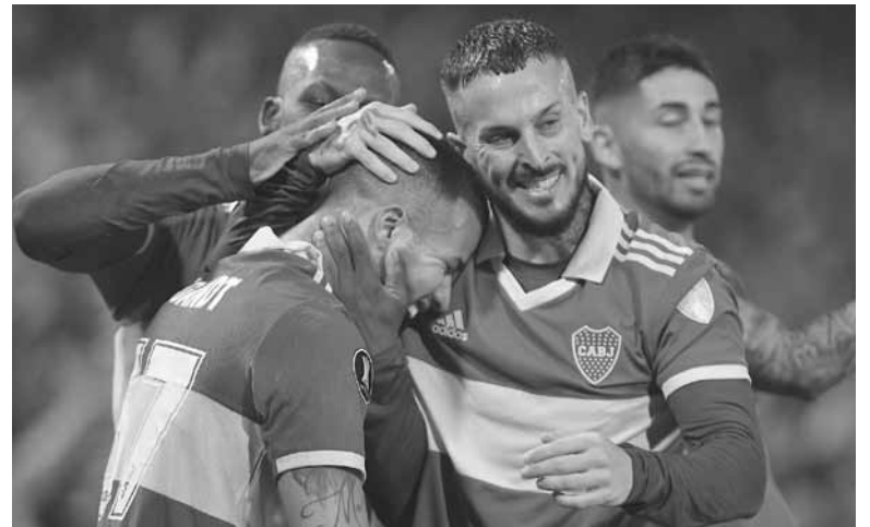
Buen semblante. Desde la llegada del DT, el "Xeneize" logró reciclar su clima interno positivamente.

Árbitro: Hernán Mastrángelo. Cancha: Mario Alberto Kempes. Hora: 21.30 (TNT Sports).