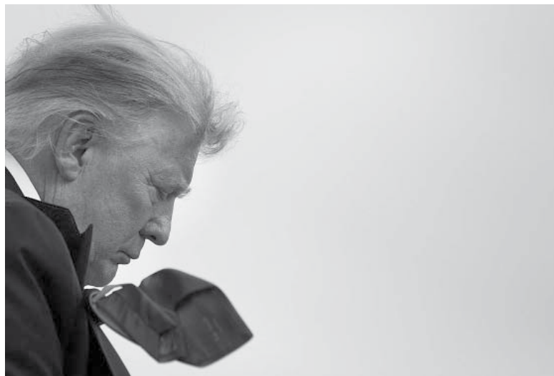
Complicado. Trump enfrenta graves cuestionamientos en la Justicia. - Telam -

enfrenta ahora a 31 cargos de retención deliberada de información de defensa nacional; a un cargo de conspiración por obstruir la justicia; otro por posesión de registros, otro por ocultar los documentos, así como tres cargos más por ocultar un documento durante una investigación federal, por intrigas y por declaraciones falsas.