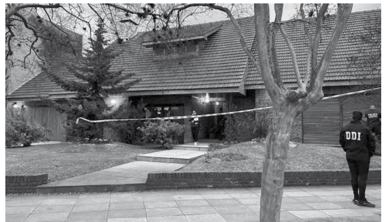
Padua. El lugar de los hechos, la casa donde sucedió el homicidio.

De acuerdo con lo detallado por voceros vinculados a la pesquisa, el episodio se produjo pasadas las 4 de esta madrugada, cuando dos delincuentes bajaron de un Volkswagen Gol Power gris y, tras forzar la persiana americana de madera de un ventanal sin rejas que da a la calle, entraron al domicilio de la pareja, situado en Italia 1077, de San Antonio de Padua, mientras que al menos dos cómplices quedaron de apoyo a bordo