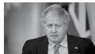
Boris Johnson. - Archivo -

Derivación del "party-gate", el escándalo por participar de una fiesta en la pandemia.