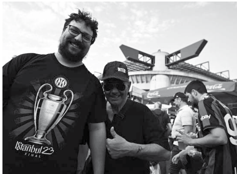
Expectativa. El partido, que marcará la culminación de la temporada europea, se disputará en Estambul.

Pero Inter no irá como "convidado de piedra" a la capital turca