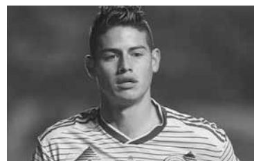
En Colombia aseguran que jugará en Boca.

El enganche colombiano James Rodríguez, de larga carrera internacional, sería refuerzo de Boca en breve, de cara a la segunda fase de la Copa Libertadores de América, según la prensa de