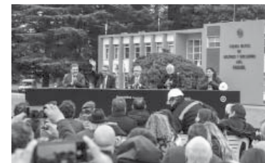
El acto en Fanazul.

Estuvo el Presidente Fernández. La había cerrado el gobierno anterior.