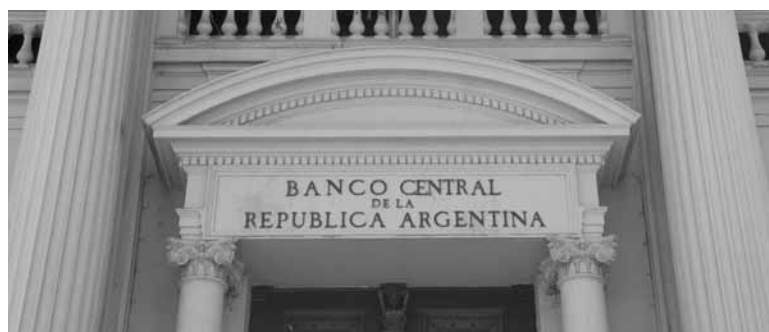
El Banco Central.

■ Al difundir el resultado del relevamiento de expectativas de mercado, el Banco Central relativizó ayer el pronóstico de inflación del 9% realizado por las consultoras, y dijo esperar que el costo de vida se ubique por debajo del 8,4% de abril. En el relevamiento actual, realizado entre 29 y 31 de mayo, analistas estimaron una inflación mensual de 9% para mayo. Pero el BCRA aclaró que luego de que se brindaran los pronósticos al BCRA, “se conoció nueva información que sugiere que la inflación mensual se moderó con respecto al 8,4% observado en abril. Tanto los diversos indicadores de alta frecuencia de precios mayoristas