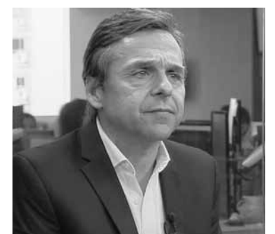
El ministro de Transporte, Diego Giuliano.

En tanto, de cara a las elecciones, dijo que Sergio Massa "tomará la decisión de cuál va a ser su participación". Sin embargo, indicó que "el objetivo fundamental es