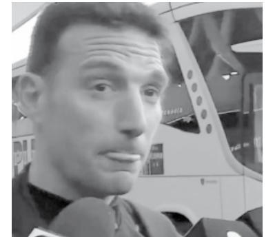
El “Gringo” llegó al país.