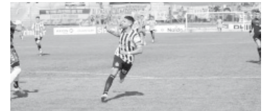
Bustos la picó de nuevo.