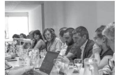
Una reunión de paritaria.

En tanto, fuentes de ATE bonaerense le señalaron a DIB que por estas obras estaban presentando un escrito que iba en la misma línea.