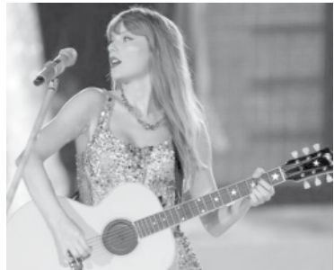
Taylor Swift.