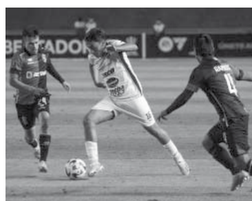
Paliza en Perú. - CAP -

■ Patronato, de Paraná no se encontró, perdió 5 a 0 ante Melgar, en Perú, por la quinta fecha del Grupo H de la Copa Libertadores, y quedó afuera de la competi-