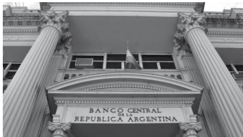
Tiene que ceder. El Central debe ahora darle los dólares a Córdoba.

A tres días del vencimiento de deuda de la provincia por USD 143 millones, el magistrado hizo lu-