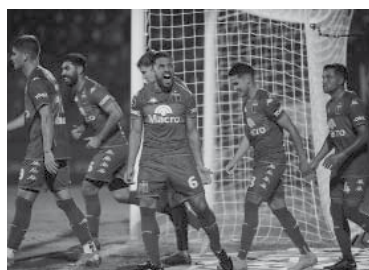
Buen triunfo en Victoria. - Télam -

Tigre se impuso por 2 a 1 ante Puerto Cabello y alcanzó la línea del Sao Paulo de Brasil en un encuentro jugado anoche en el estadio Monumental de Victoria y válido por la quinta jornada de la Zona D de la Copa Sudamericana. La victoria dejó a Tigre con 10 unidades, al igual que Sao Paulo (el jueves recibe a Deportes Tolima), mientras que Puerto Cabello se mantiene con sin puntos y en el último lugar. - Télam -