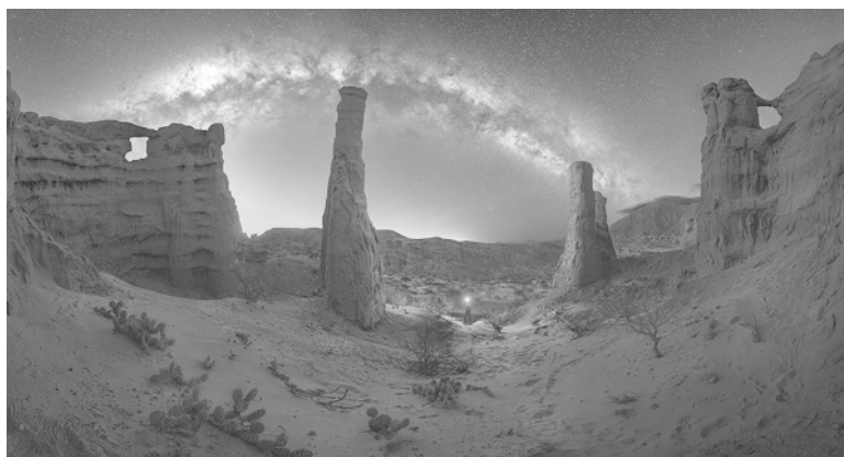
Elegida. La fotografía "Fábrica de estrellas de Cafayate", de Gonzalo Santile. - Télam -

"A diferencia de lo que ocurre con los cielos del desierto chileno de Atacama por ejemplo, de Argentina no hemos visto muchos trabajos en astrofotografía sobre la Vía Láctea -señala Zafra-, aunque creo que reconocimientos como los que ha recibido Gonzalo hacen que eso