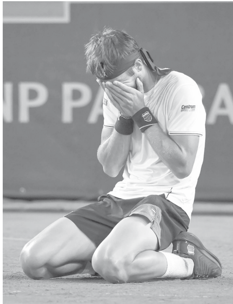
Parada brava. El duelo ante el crédito teutón será, sin dudas, el desafío más difícil para el platense. - ATP -

En cuanto a los resultados de la jornada, el serbio Novak Djokovic