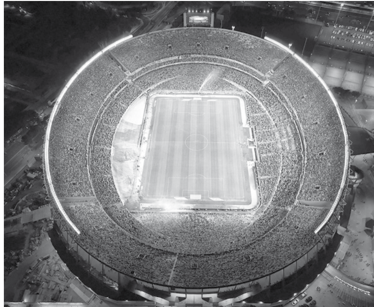
Completo. Tras la trágica muerte de un hincha el sábado, el estadio fue habilitado en forma íntegra.