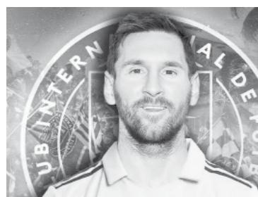
Inter Miami, la opción más cercana anoche. - Twitter -

Messi es la de Inter Miami, de la MLS de Estados Unidos.