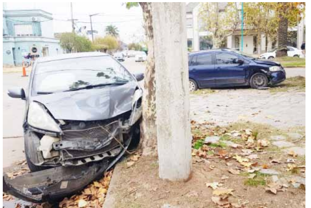
Las imágenes atestiguan la violencia del impacto entre ambos vehículos.

donde derivaron luego de golpearse. De acuerdo a lo que pudo averiguar este medio, un