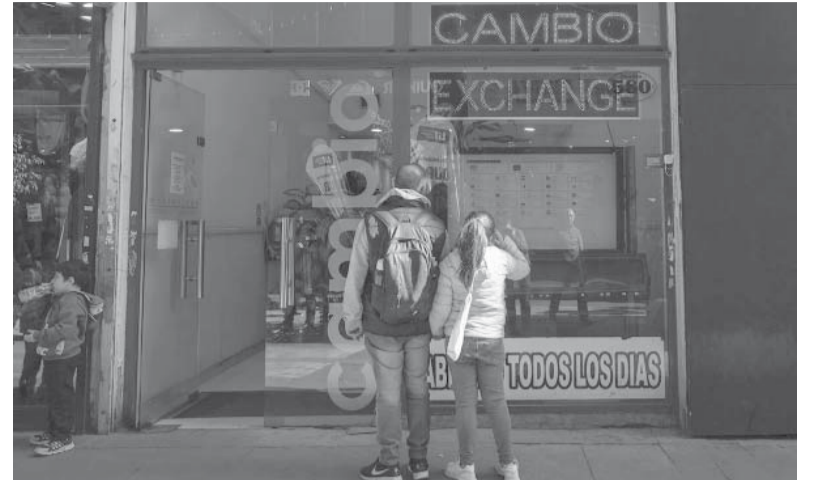
Estable. Los dólares estuvieron ayer "tranquilos". - Archivo -

La Secretaría de Comercio confirmó la continuidad hasta el 31 de julio de la canasta de 2.101 productos que conforman el programa Precios Justos, con una pauta mensual de 3,8%, y que se encuentra disponible en las 2.500 bocas de expendio acordadas. - Télam -