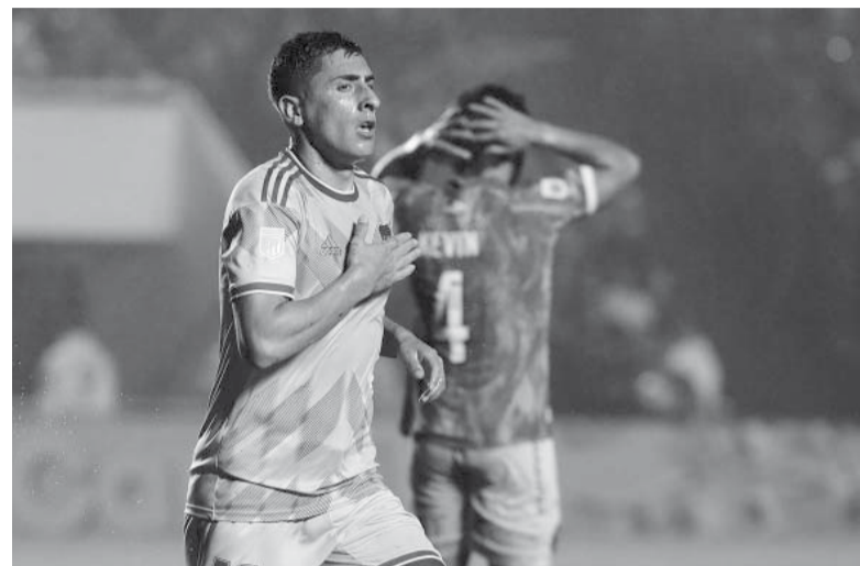
Decisivo. El uruguayo entró para ganar el partido.

tendencia para traducir el dominio en el marcador. La mala para el local fue la lesión de Ávalos, quien se retiró a los 27 minutos.