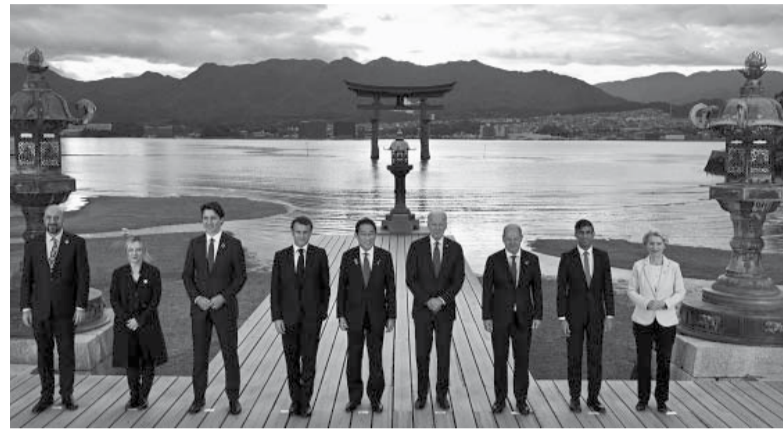
Firmeza. Los mandatarios en el G 7.

El papa Francisco afina un plan de paz para la guerra entre Rusia y Ucrania por el que podría encargar una misión a negociadores vaticanos, que por el momento no están definidos por la Santa Sede. Si bien en un principio medios italia-