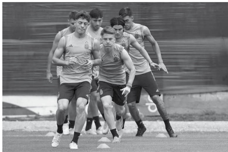
Apertura. Hoy será la jornada inaugural del certamen juvenil.

De movida, el "Jefecito" no pudo contar con Alejandro Garnacho (Manchester United), Facundo Buonanotte (Brighton And Hove) y Nicolás Paz (Real Madrid), quienes no fueron autorizados por sus clubes, amparados por la decisión de la FIFA que a partir de esta edición le quitó el carácter de "obligatorio" a la cesión de jugadores.