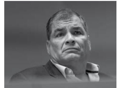
Rafael Correa.