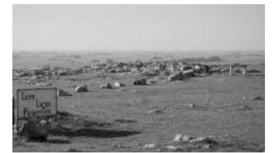
Cerro Largo. - DIB -