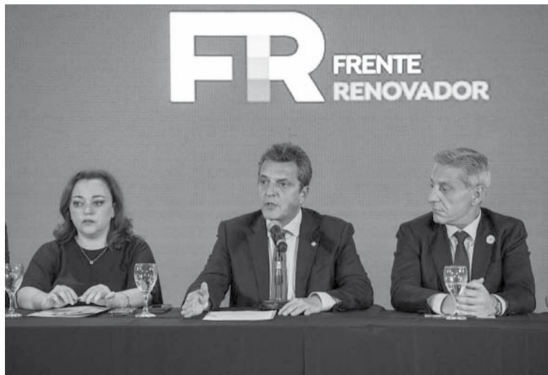
Cumbre. Massa encabezó una mesa del Frente Renovador.

Massa se mide con el embajador en Brasil, Daniel Scioli, que también trabaja para llegar al sillón de Rivadavia con ayuda de los alfiles de Alberto Fernández; y con el ministro del Interior, Eduardo "Wado" de Pedro, que ya camina como candidato y a por los dichos de Cristina sintió un espaldarazo.