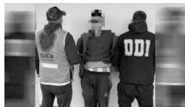
Cae un hombre de 36 años.