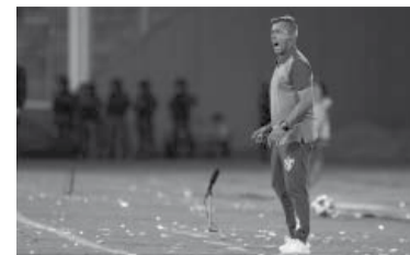
El entrenador se descompensó en la charla técnica. - Vélez -