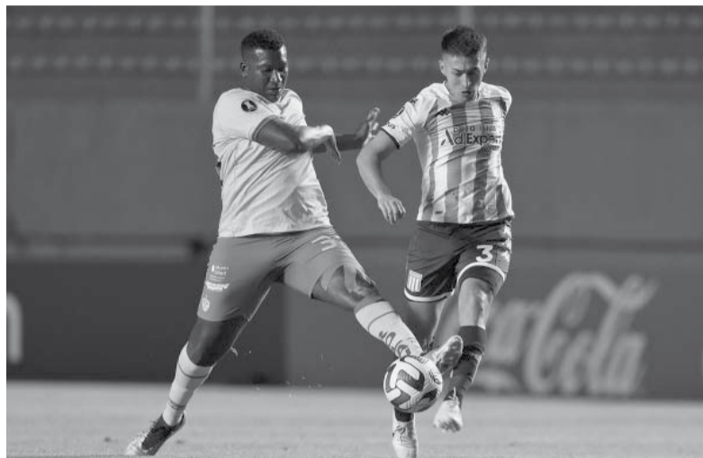
Sufrido. Como la historia "académica" manda, el merecido triunfo estuvo en discusión sobre el final.

Árbitro: Gery Vargas (Bolivia). Cancha: Cooprogreso Gonzalo Pozo Ripalda (Quito).