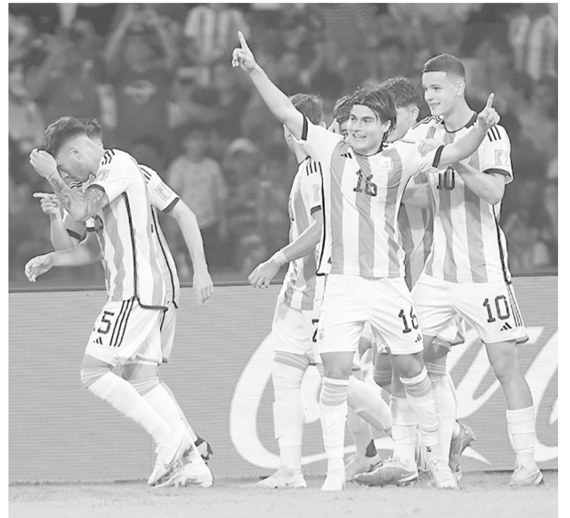
Completo. El equipo mejoró y la sigue en San Juan.

El entrenador renovó por completo la franja izquierda con Luka Romero y Román Vega, al mismo tiempo que modificó su pieza de ataque: adentro Ignacio Maestro Puch, afuera Véliz.