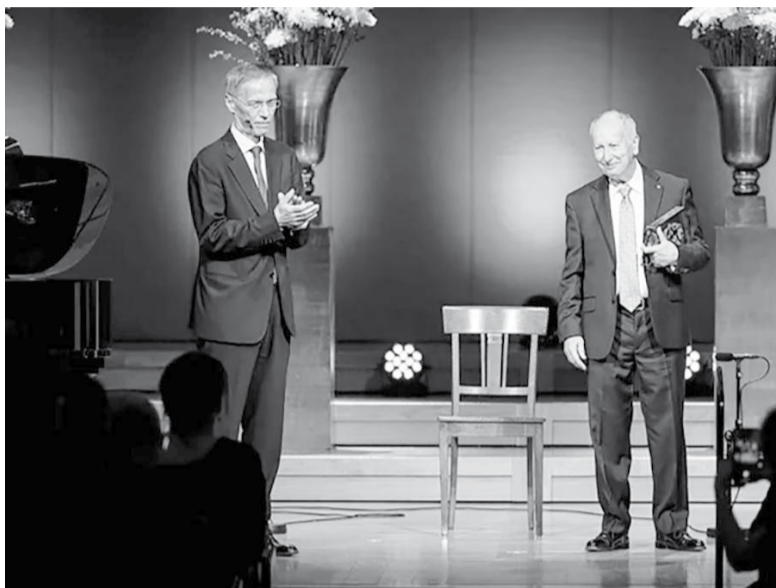
Reconocimiento. El matemático argentino Luis Caffarelli. - Premio Abel -

"La educación pública fue excepcional y clave para mi formación", aseguró desde Oslo Caffarelli, nacido en Buenos Aires en 1948 y actual docente de la Universidad de Texas (Estados Unidos), minutos después de haber recibido el Premio en la Facultad de Derecho de la Universidad de Oslo durante una ceremonia en la que también estuvo el ministro de Ciencia, Tecnología e Innovación, Daniel Filmus. "Mi llegada a Estados Unidos se dio también gracias a un programa de intercambio, luego de haber tenido una fuerte educación en Matemáticas en la Universidad de Buenos Aires (UBA)", planteó luego el tam-