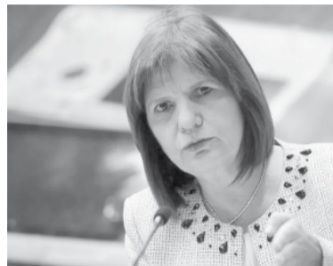
Patricia Bullrich.