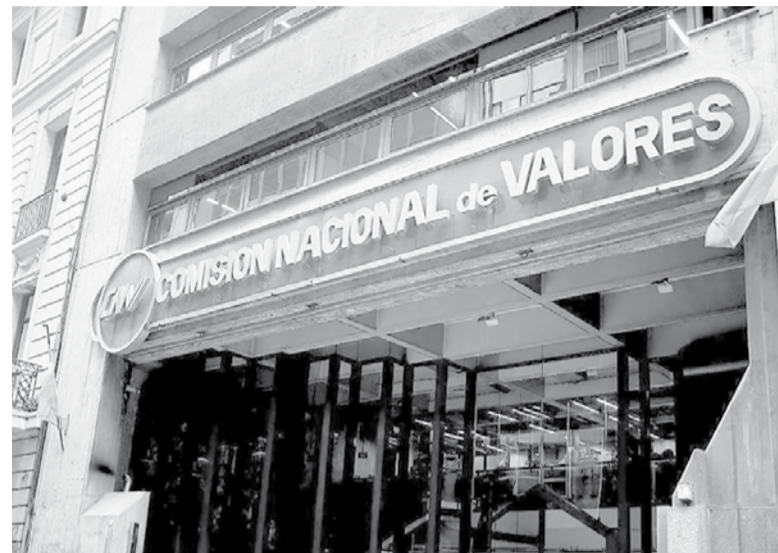
Decisión. La Comisión Nacional de Valores comunicó las medidas. - Archivo -

La divisa paralela se mantuvo cerca de su máximo nominal, a $487 para la compra y $492