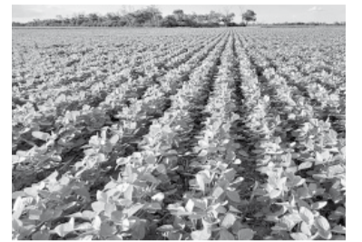
La soja no aporta lo suficiente.

El aporte fue de US$ 3.200 millones a falta de cuatro ruedas para el fin del programa.