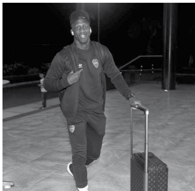
Listos. El plantel llegó en la madrugada de ayer a la ciudad colombiana de Pereira.

Árbitro: Carlos Andrés Betancur (Colombia). Cancha: Ramón Tahuichi Aguilera Costas (Bolivia). Hora: 23 (DirecTV).