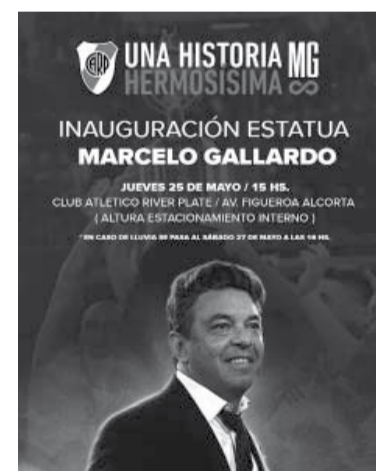
La lluvia, "enemiga" del homenaje.