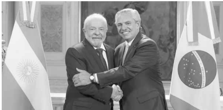
Reencuentro. Los presidentes Lula y Fernández se reúnen hoy en Brasil.

El presidente Fernández es esperado en Brasilia para reunirse con Lula hoy y el equipo económico de ambos países para discutir cómo