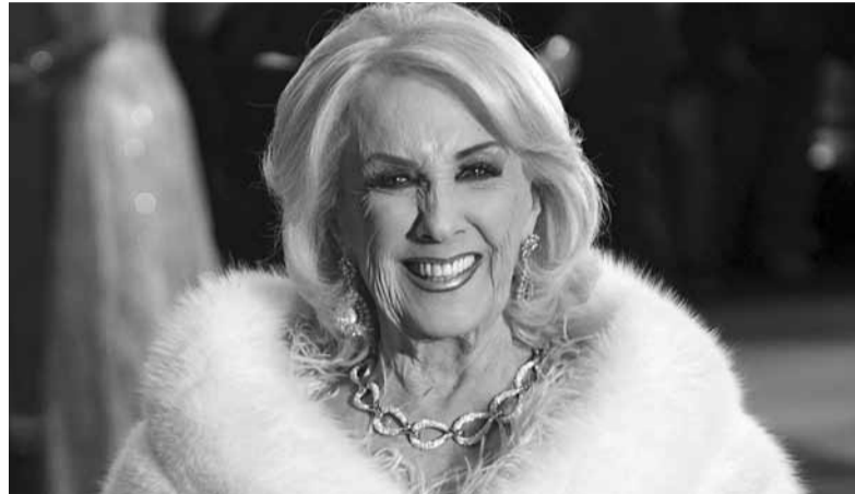
Dispositivo. La conductora Mirtha Legrand será hoy intervenida.

Y continuó: "El marcapasos se puede programar para responder de diferentes maneras a la actividad eléctrica del corazón, dependiendo de las necesidades del paciente. Por ejemplo, puede estar configurado para emitir un