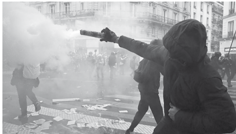
Desafiantes. La Policía francesa se enfrentó a manifestantes en varias ocasiones a lo largo de la jornada en París, Nantes y Lyon.

Cientos de miles de personas tomaron ayer las calles en Francia para exigir la derogación de la reforma jubilatoria y conmemorar el Día Internacional de los Trabajadores, y más de 200 manifestantes fueron detenidos y casi 50 policías heridos en incidentes en París y otras ciudades. La CGT dijo que 2,3 millones de personas participaron de más de 300 marchas, incluyendo 550.000 manifestantes en París, pero el Gobierno rebajó la cifra a 728.000 en todo el país y unos 120.000 en la capital. Los manifestantes portaban carteles con leyendas contra Macron y su decisión de elevar por decreto la edad jubilatoria de 62 a 64 años,