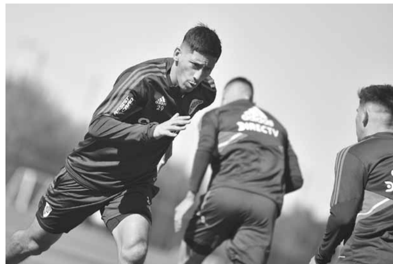
Con todo. Hubo entrenamiento antes del viaje a Brasil. - River -

Árbitro: Braulio Machado (Brasil) Cancha: Tomás Adolfo Ducó. Hora: 19.00 (ESPN y Star+).