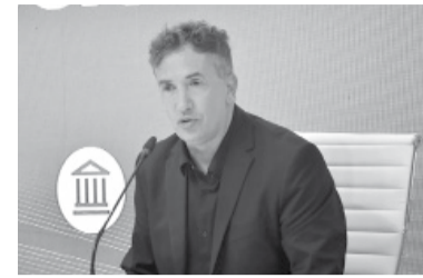
Beligoy, el encargado del referato argentino.