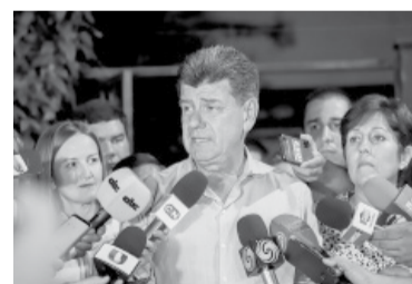
Santiago Peña.

Aun cuando pasaron muy pocas horas del pronunciamiento inequívoco del pueblo paraguayo, surgen con claridad algunas conclusiones: la primera, que los grandes ganadores de la jornada fueron la Asociación Nacional Republicana (ANR, el nombre oficial del coloradismo), Peña; su padrino político, el cuestionado y polémico expresidente Horacio Cartes, y Payo Cubas, y la segunda, que los grandes perdedores fueron el candidato presidencial por la Concertación, Efraín Ale-