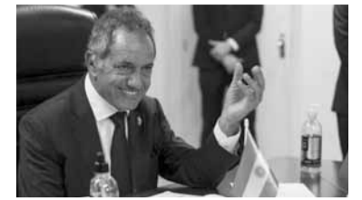
Daniel Scioli.