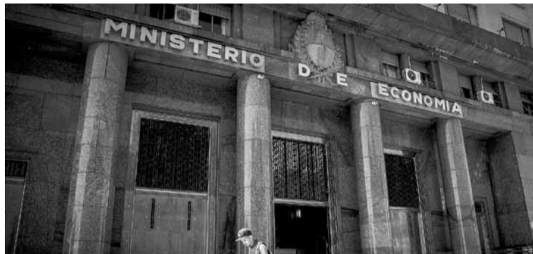
A la caza. El Ministerio de Economía intenta no perder dólares.

La primera consta en requerirles a los Agentes de Bolsa (Agentes de Liquidación y Compensación