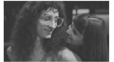
Los actores en el papel de Fito y Fabi.