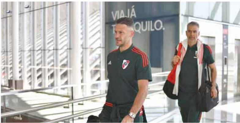
- River -