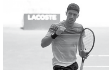
El cordobés superó a Tiafoe y se instaló en octavos.

El tenista nacido en Bell Ville, Córdoba, quien venía eliminar a Francisco Cerúndolo (30), superó con autoridad al norteamericano, quien había vencido en la fase anterior del torneo al platense