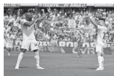
Martínez-Lukaku, la fórmula del ataque "nerazzurri". - Inter -

El líder Napoli dio ayer un nuevo paso hacia su inminente corona-