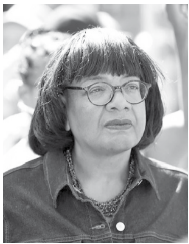
Diane Abbot.

PERÚ.- El expresidente Alejandro Toledo fue presentado ayer ante un juzgado de la Corte Superior Nacional para que la justicia confirme su identidad y él conozca los cargos de corrupción por los cuales fue extraditado y está siendo procesado. Tras la breve audiencia, la jueza dispuso que "el detenido queda a disposición del INPE (Instituto Nacional Penitenciario)" para su ubicación en un establecimiento carcelario, el cual se presumía que sería el penal de Barbadillo, donde también están reclusos los expresidentes Alberto Fujimori y Pedro Castillo, informó la agencia EFE. - DIB -