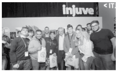
La visita del Presidente.