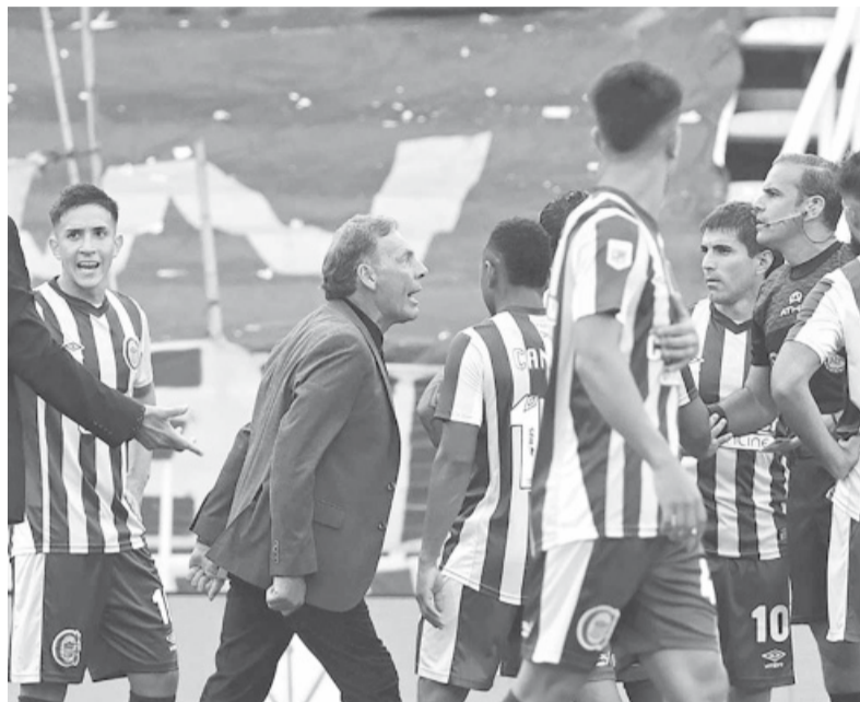
Enojo. Central terminó con bronca por el tiempo adicionado.