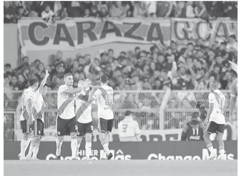
Aplanadora. El equipo de Demichelis no tuvo piedad en el clásico.

que lo vio nacer y con el que ganó la Copa Sudamericana 2017.