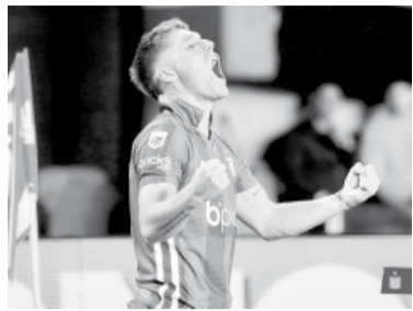
Estudiantes estrenó una camiseta en honor a Bيلardo. - Estudiantes -