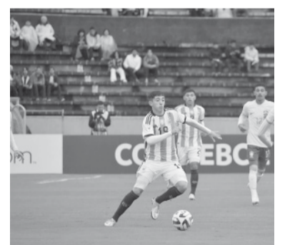
El seleccionado albiceleste cerró su actuación en el torneo.

Por su parte Paraguay, penúltimo con cuatro puntos, le ganó a Chile, último sin unidades en los cinco partidos, por 1 a 0 con gol de César Miño.