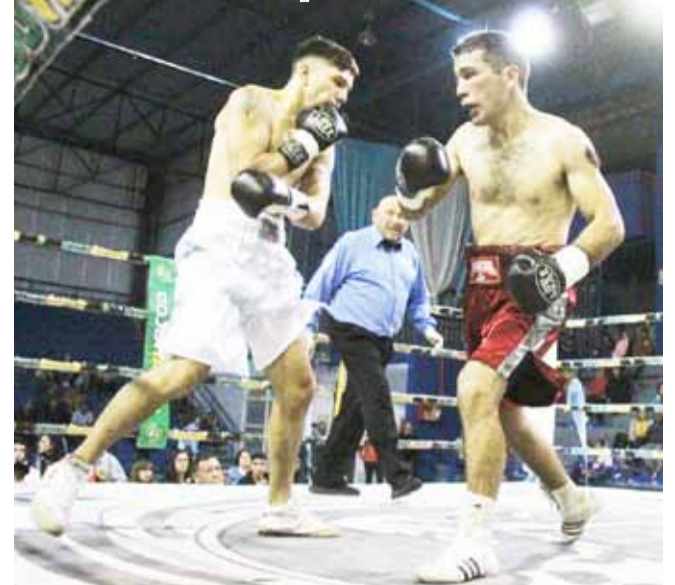
En la corta. El "Chori" logró réditos en su boxeo cuando pudo acortar distancias.

marcar la diferencia en el tercer round. En medio de un ensordecedor aliento, el local se quedó con ese