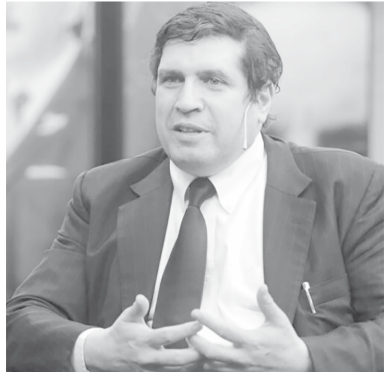
Acusación. El director ejecutivo por Argentina ante el FMI, Sergio Chodos.

En esa línea, Chodos explicitó: "El pedido fue de evitar o postergar desembolsos y negociar con ellos cuando asuman. Me parece que esto excede un marco normal de