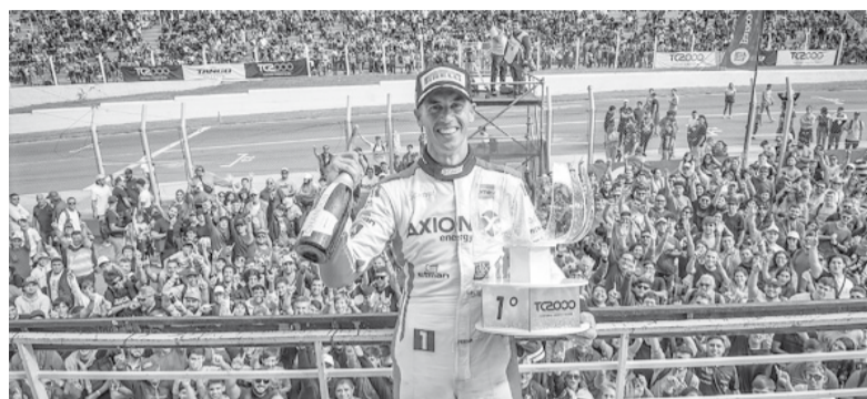
Arrasador. En solo tres fechas, el tandilense sacó 35 puntos de ventaja. - TC2000 -

tandilense llegó a los 117 puntos y estiró a 35 su distancia con Montenegro, escolta en la clasificación general del campeonato.