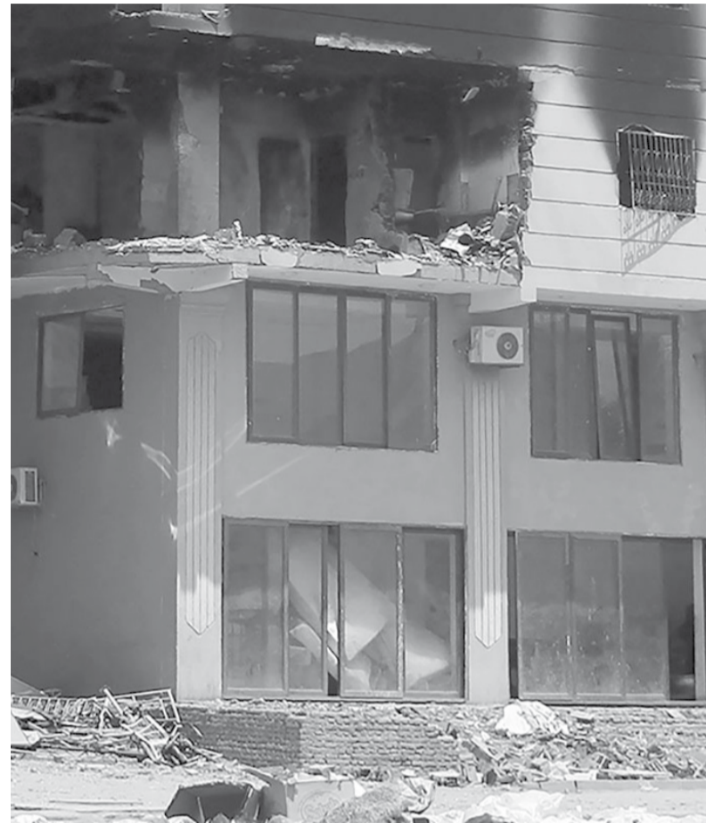
Destrucción. La huella de los combates en la capital Jartum.

El presidente de Estados Unidos, Joe Biden, anunció que fuerzas de élite estadounidenses evacuaron al personal diplomático de su país de Jartum con helicópteros y que Washington suspendió temporalmente las operaciones de su embajada en Sudán. El primer ministro de Reino Unido, Rishi