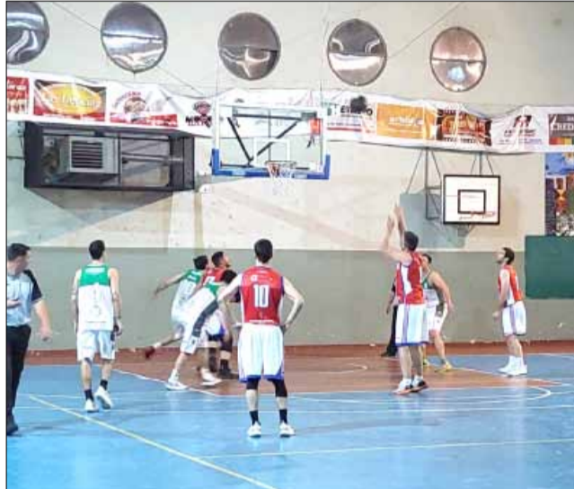
Escena del partido del viernes.