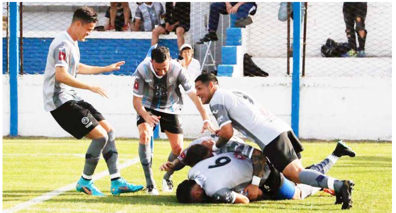
32ª FECHA DEL FEDERAL A / CIUDAD DE BOLIVAR 2 - FERRO DE PICO 0