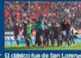
El clásico fue de San Lorenzo

El Gobierno espera luz verde para sumar divisas del FMI y el BID