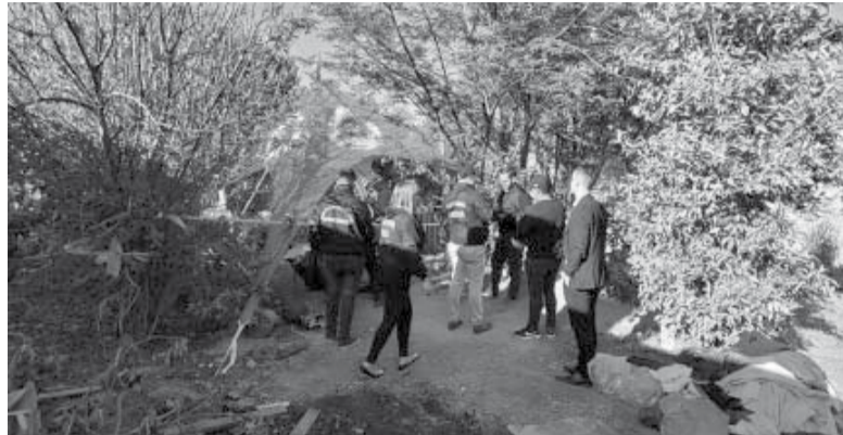
Lugar de los hechos. La policía cordobesa en la excavación del pozo de agua donde se hallaron los cuerpos.

El primer hallazgo se produjo antes de las 11 de ayer en el pozo de un viejo aljibe de la vivienda, donde aún trabajaban más de 70 personas, entre ellas bomberos de la policía cordobesa, personal del