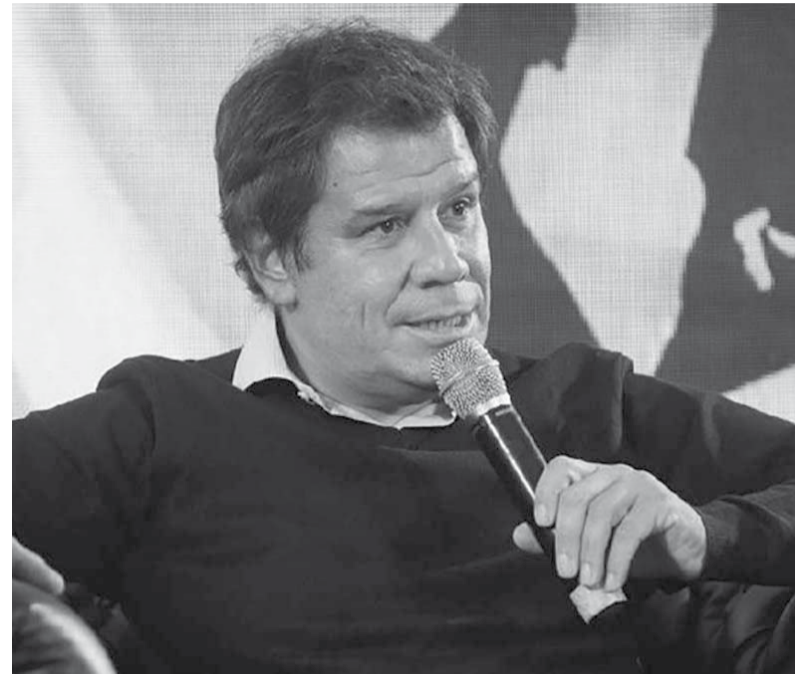
Diferencias. Los dichos de Manes tensionaron la alianza.