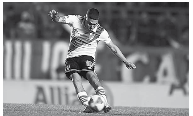
Comodín. De lo que pueda generar Quintero dependerán las chances de River de doblar al decaído "Pincha".

Árbitro: Andrés Merlos. Cancha: Ricardo Bochini - Libertadores de América. Hora: 21.30 [TNT Sports].