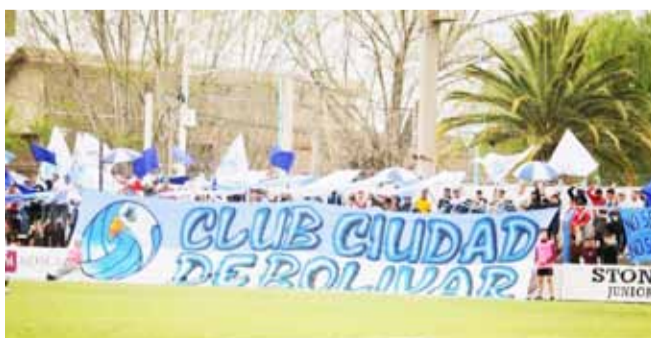
El rival de Bolívar en la copa se conocerá en el mes de enero.

En caso de igualdad en puntos, se define por los partidos jugados entre sí.