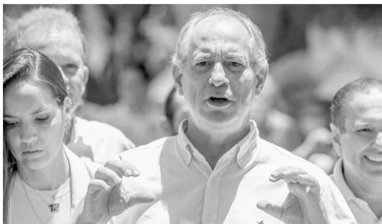
"Última salida". Gomes acató la decisión partidaria.