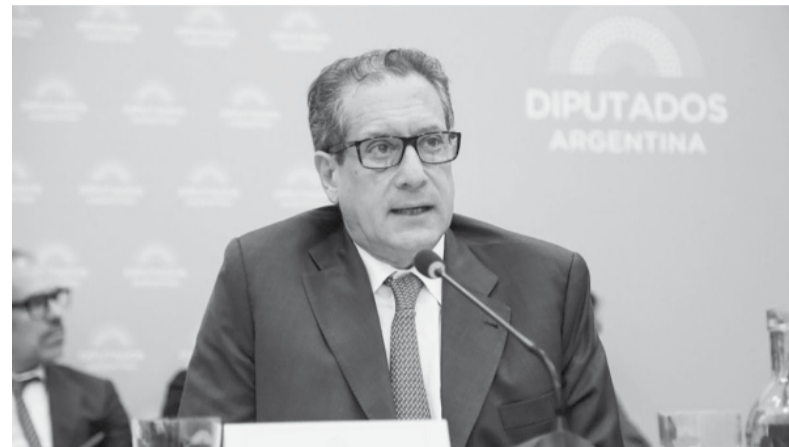
Pautas. Pesce defendió el proyecto oficial en comisión. - HCD -

El Fondo Monetario Internacional (FMI) le comunicó ayer al ministro de Economía, Sergio Massa, que el organismo aprobará el cumplimiento de las metas de reservas del tercer trimestre. Respecto del segundo trimestre ya se conoce que la revisión será aprobada a pesar de no cumplir con la meta de acumulación de