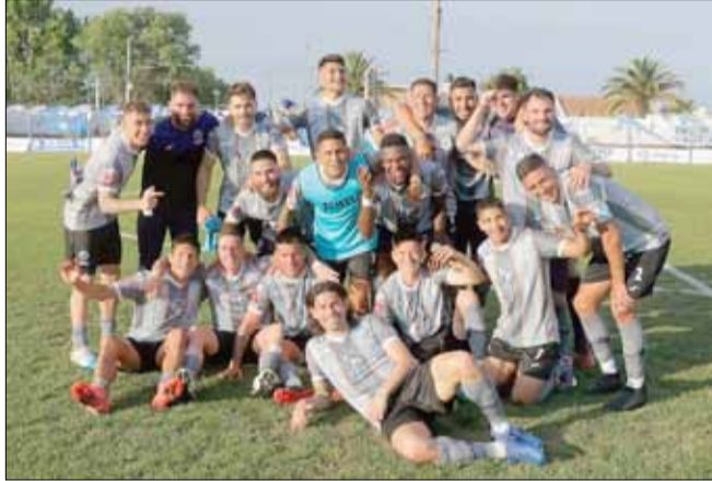
El Celeste celebrando su valioso triunfo del sábado ante Ferro.