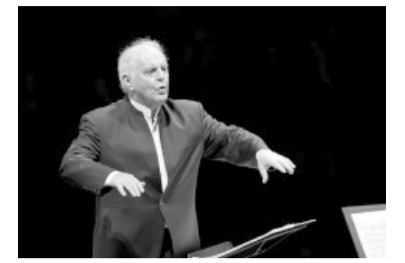
Daniel Barenboim.