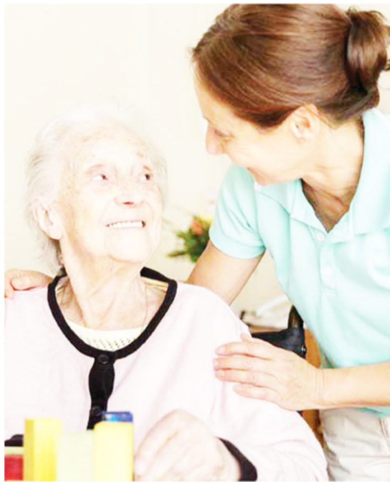
Alzheimer. Entre el 60% y el 80% de los casos tienen una base genética, aseguran los expertos.

"Hasta ahora tenemos datos de unas 1.300 personas, que nos alcanza para validar (o no) descu-