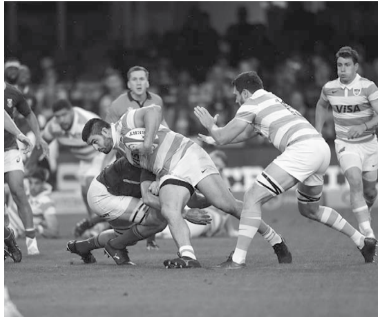
Superado. El equipo albiceleste no pudo torcer la lógica. - Los Pumas -

En esta etapa el equipo albiceleste sufrió las amonestaciones de Marcos Kremer y Juan Martín González, por lo que disputó 20 minutos con un jugador menos. Además, se lesionó el octavo Pa-