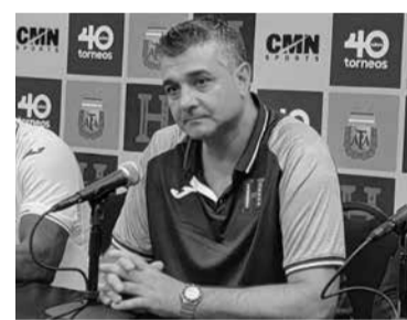
La curiosa comparación del entrenador argentino. - Internet -

por último el diario Diez señaló: "Argentina, con doblete incluido de Lionel Messi, derrotó con suma facilidad a una pobre Honduras. Leo Messi frotó la lámpara y se lució con un golazo en el duelo contra la selección hondureña, su otro tanto fue de penal. Lautaro Martínez marcó el primero del cotejo".