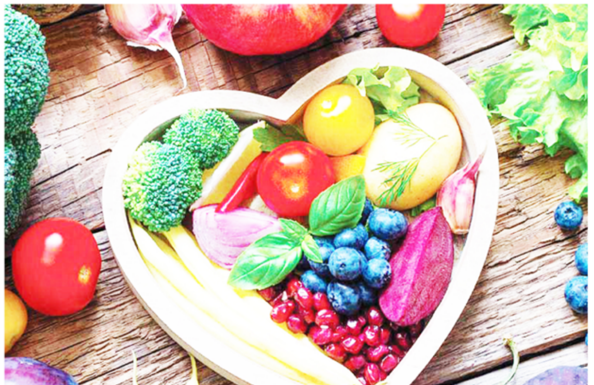
Frutas y verduras. Aportan nutrientes esenciales, vitaminas, minerales y fibra.

2 Aumentar el consumo de fibra. Incorporar como mínimo 30 gramos de fibra al día reduce significativamente los niveles de colesterol LDL ("malo") y controla los de glucosa en sangre, por lo que disminuye el riesgo cardiovas-