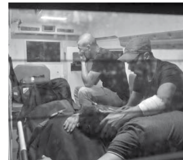
Su barco naufragó frente a la isla.