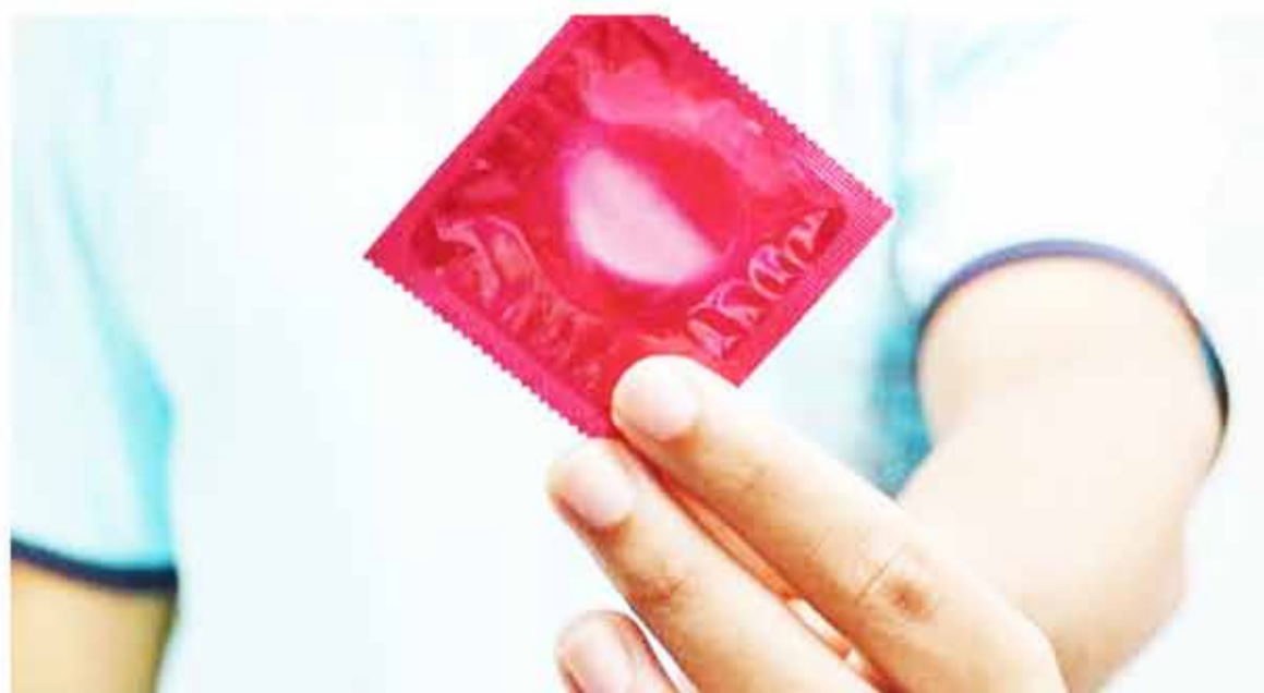
Salud sexual. Solo 2 de cada 10 jóvenes usa siempre el preservativo en todas sus relaciones.

En el 2020 sólo el 3% de los adolescentes lo usó siempre, y 10% en jóvenes. En el 2021, se observó el uso en el 5% de los adolescentes y el 13% en jóvenes. "Esta variación