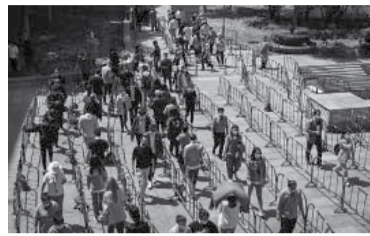
El organismo tomará la decisión en octubre. - Télam -