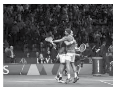
Djokovic y Berrettini festejan el triunfo en dobles. - Laver Cup -

Pero el desnivel de la jornada llegó cuando ingresó a cancha Novak Djokovic, la carta más fuerte del equipo de Europa. "Nole" apabulló al estadounidense Frances Tiafoe por 6-1 y 6-3 y adelantó 4-3