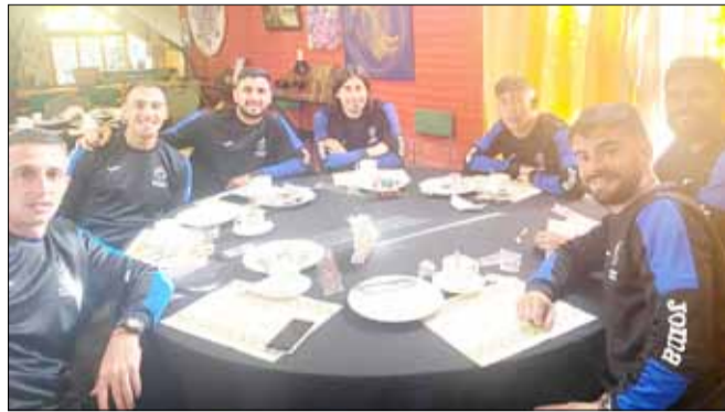
El plantel ayer, en el hotel puntano de SMATA, a la espera de un partido con tres puntos de oro en juego.