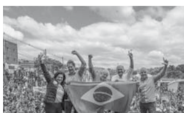
El acto de despedida del candidato del PTS.

En Campinas, corazón del interior de San Pablo, Bolsonaro junto con su candidato a gobernador, Tarsício Freitas, su exministro de Infraestructura, participó de una caravana en motocicleta como