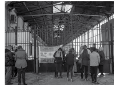
La nave estuvo varias horas varada.