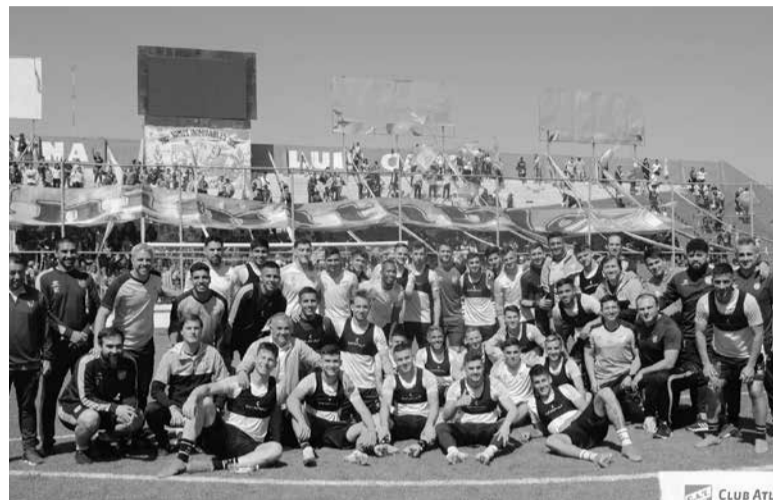
Banderazo. Los hinchas tucumanos presenciaron la práctica del equipo de Pusineri. - ATOFICIAL -

Árbitro: Diego Abal. Cancha: Juan Carmelo Zerillo. Hora: 15.30 [TNT Sports].