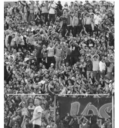
22 mil hinchas estarán en San Nicolás.