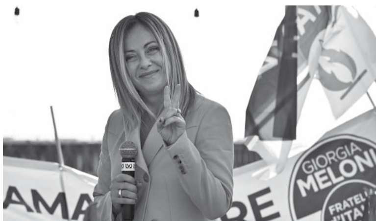
Candidata. De lo que pase esta tarde podría resultar el posicionamiento de Giorgia Miloni como futura primera ministra.

De frente a un complejo mecanismo de formación de Gobierno,