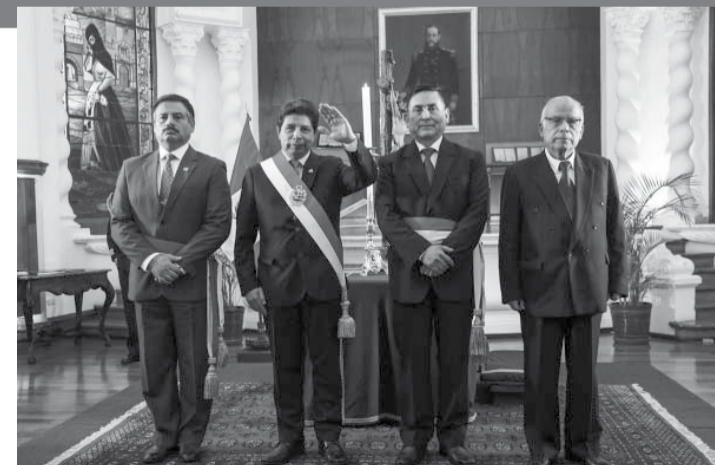
El presidente de Perú, Pedro Castillo, tomó juramento en las últimas horas a Daniel Barragán como nuevo ministro de Defensa en reemplazo de Richard Tineo, que pasará a ocupar el Ministerio de Transportes y Comunicaciones, en un nuevo cambio de gabinete forzado por las tensiones con el Congreso. Con estos dos cambios, el presidente Castillo suma ya un total de 72 juras de ministros en poco más de un año que lleva de mandato. Solamente por la cartera de Defensa ya pasaron cuatro titulares y otros cinco en la de Transportes y Comunicaciones. - Télam -