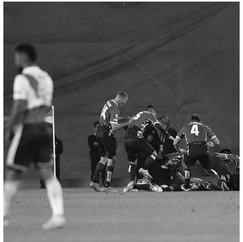
Puñal. Ya en el descuento, la "T" marcó el 1-0.

Así, y aunque River tuvo la más clara (a los 15, un centro de Solari que Borja cabeceó solo y tapó He-