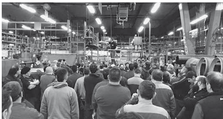
Tensión. Los sindicatos reclaman aumento salarial.

Por último, subrayó que seguirá “trabajando con el compromiso de superar esta situación que, actual-