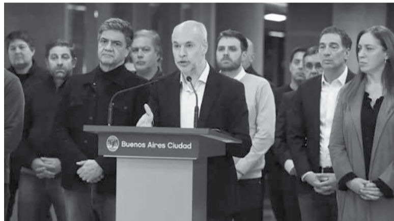
Conferencia. Larreta destacó el accionar policial.

Asimismo, destacó el accionar de la Policía de la Ciudad y expresó que “el martes a la noche, mientras