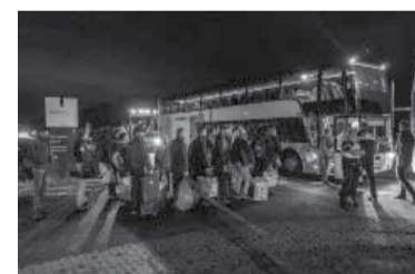
La criatura fallecida tenía apenas tres meses de edad.

El centro de Ter Apel, el más grande de los Países Bajos, tiene camas para hasta 2000 personas,