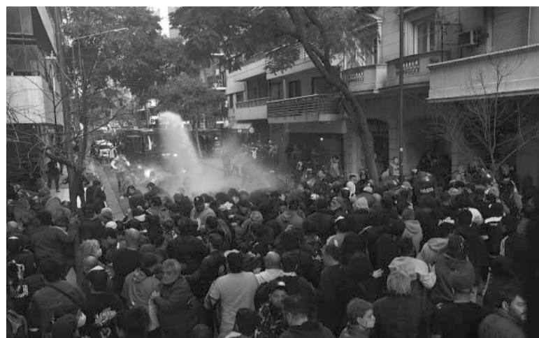
Forcejeos. Camiones hidrantes dispersan a los manifestantes.

"No hay dudas. Acá sigue mandando Mauricio Macri", declaró el mandatario en un breve contacto con la prensa cuando arribó a Juncal y Uruguay. Previamente, Kicillof había declarado que Rodríguez Larreta busca "sitiar a la vicepresidenta". - DIB -