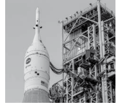
Más de 100 mil personas asistirán al lanzamiento. - NASA -