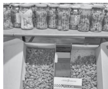
El material incautado por la policía. - Télam -

manera inmediata los efectivos de la comisaría 4ta. de Berisso, montaron un operativo cerrojo y lograron detener al conductor a unas pocas cuadras del lugar. - Télam -