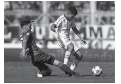
Los de Insúa hilvanaban dos triunfos.