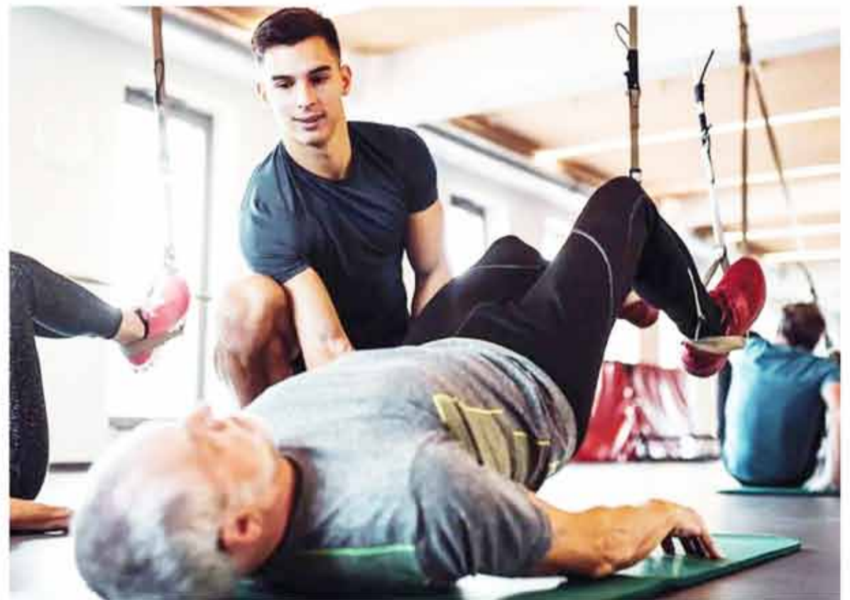
Actividad física. Lejos de lo que se cree, el deporte es fundamental para las personas trasplantadas.

"Hacer deporte es muy importante para mí porque no solo influye