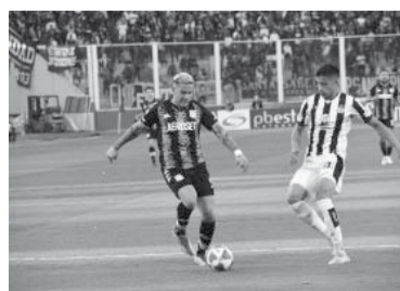
El equipo de Gago está a 7 del líder, con un partido más. - Racing -

El Mario Alberto Kempes fue escenario del encuentro, al que "La