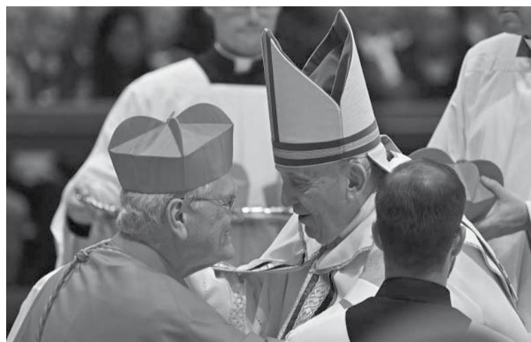
Extensión. El Colegio Cardenalicio se compone ahora de 206 miembros sumando a los nuevos "purpurados".

Si bien el Papa debía crear 20 cardenales, el ghanés Richard Kuui Baawobr, obispo de Wa, sufrió un problema cardíaco al llegar