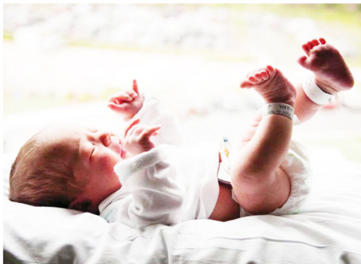
Recién nacido. Crece la práctica de guardar células madre del cordón umbilical.

Es una alternativa que toma relevancia, sobre todo, en las familias en cuyos casos no se tiene acceso al material genético de ambos progenitores.