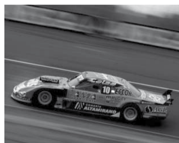
El "Pinchito" busca asegurar su lugar en la Copa de Oro.

Carlos Sainz, de la escudería Ferrari, se llevó ayer la clasificación del Gran Premio de Bélgica, en el Circuito de Spa-Francorchamps, decimocuarta carrera de la tem-