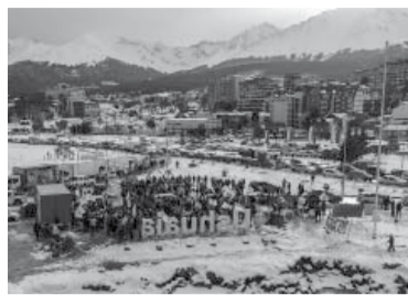
Militantes K autoconvocados en Ushuaia.