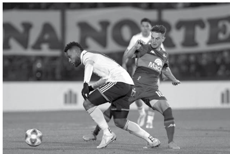
Desabrido. El equipo de Gallardo pagó por conformarse con la mínima ventaja.

Además del gol de Solari y de la presencia de Enzo Pérez, lo mejor del "Millonario" durante la etapa inicial pasó por los pies de