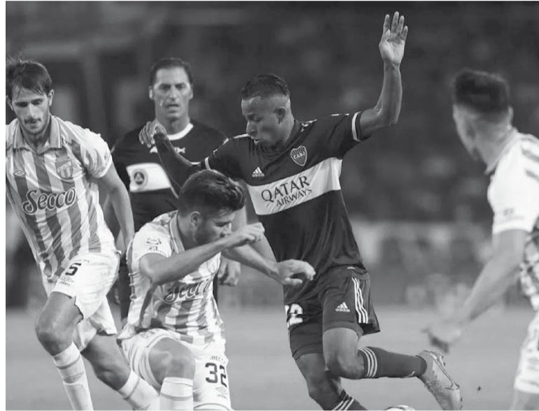
Decisivo. Vencer al puntero podría ser fundamental para el DT, cuestionado en la semana por no ver en vivo al rival.

Árbitro: Fernando Espinoza. Cancha: Alberto J. Armando. Hora: 18 (ESPN Premium).