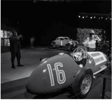
Uno de los vehículos del quintuple campeón.