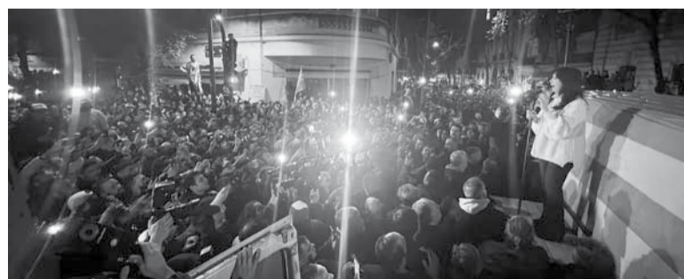
La vicepresidenta habla en Uruguay y Juncal.

"Los violentos no somos nosotros. Durante la pandemia colgaron bolsas mortuorias. Hay gente que quiere e exterminar al peronismo y no tolera que la gente se exprese. La violencia de hoy (por ayer) fue provocada por el odio al amor peronista", remarcó Cristina Fernández desde un improvisado escenario montado en la esquina de Juncal y Uruguay, donde la exmandataria habló luego de una jornada cargada de tensión y tras el retiro del lugar de los efectivos policiales que habían reprimido a los manifestantes en horas de la tarde.