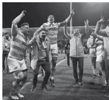
Un festejo eterno de parte de los jugadores argentinos.

DailyMail destacó que Michael Cheika, entrenador de la Argentina, había aclarado que quería cambiar la historia y lo logró plasmar en el campo de juego. En Francia, L'Equipe señaló esta victoria como: "Una hazaña al alcance de Los Pumas, considerando un juego pobre de los All Blacks y la solidez mental de los argentinos". - Télam -