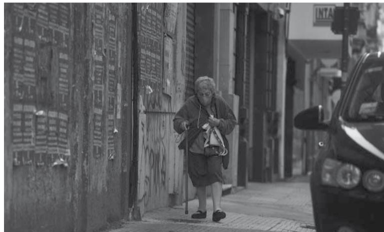
Desafío. Las trabas urbanísticas preocupan a los gerontólogos.