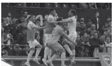
Gran triunfo de los mendocinos.

Godoy Cruz venció 2-1 ayer a Newell's, en un partido por la 16ta. fecha del Torneo de la Liga Profesional, jugado en el estadio Marcelo Bielsa de Rosario y quedó a cuatro