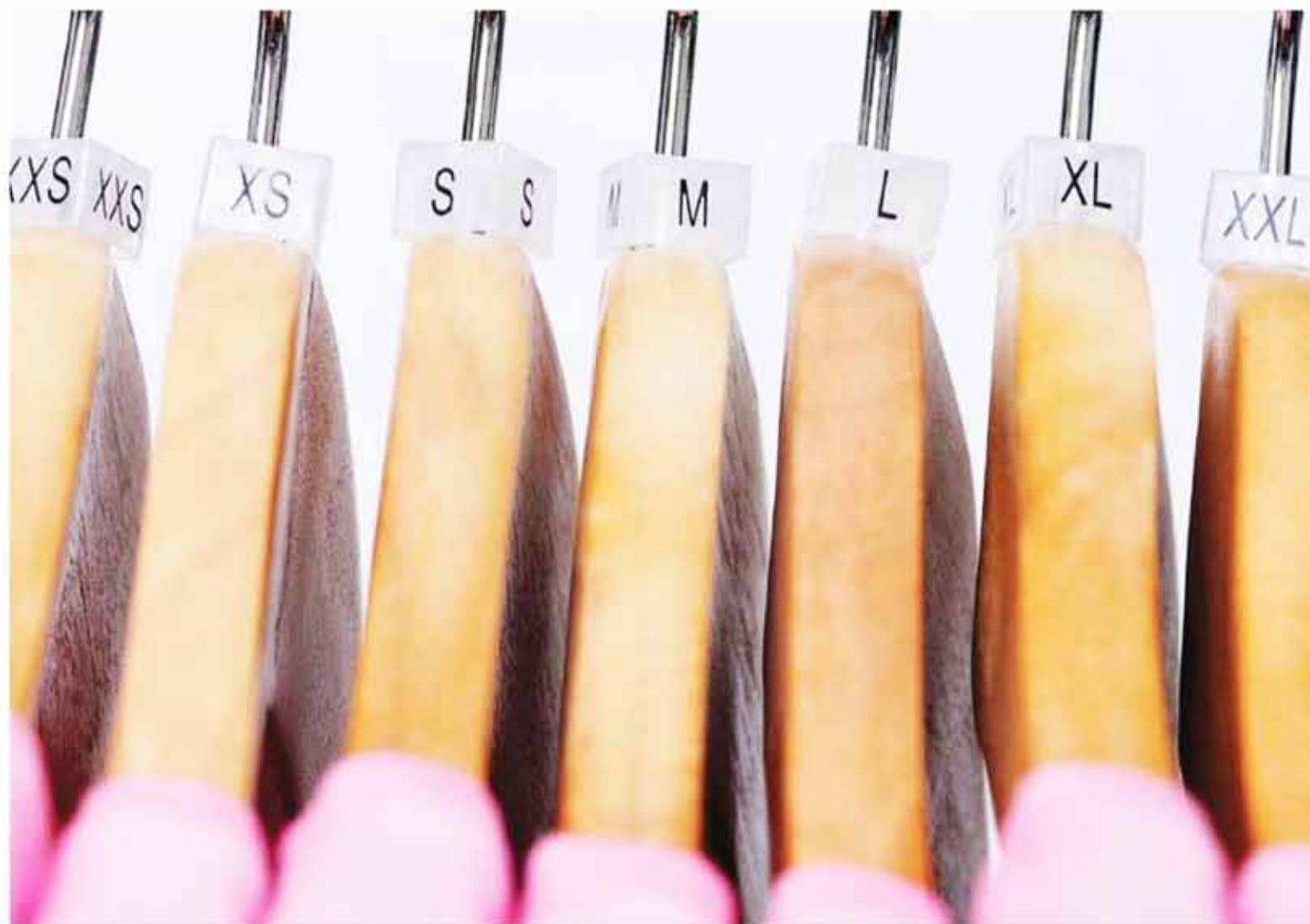
Talles reales. Un estudio realizado en todo el país determinó cuáles son las verdaderas medidas de los argentinos.