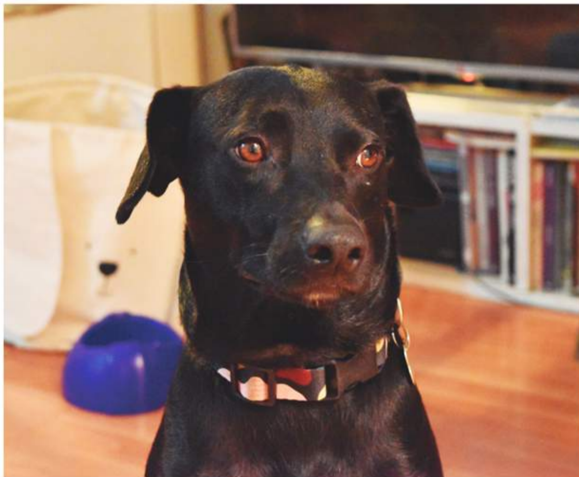
Mascotas. La OMS lanzó una advertencia tras detectarse el primer caso de viruela símica en un perro.

Pidió a las personas contagiadas con la viruela del mono que no expongan a los animales al virus, tras un primer caso de transmisión de humano a perro.