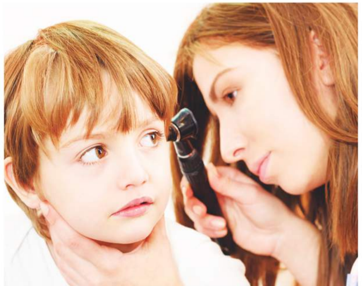
Otitis. Durante el invierno, las enfermedades relacionadas con el sistema auditivo se vuelven protagonistas.

Esta patología afecta particularmente a los más pequeños, siendo una de los principales motivos de visita al médico durante esta estación y la principal causa de prescripción de antibióticos. Según la Sociedad Argentina de Pediatría (SAP), el 51% de los casos a nivel global ocurre en niños menores de 5 años (más de 700 millones al año). Además, antes de los 3 años, el 70% de los niños presentan al menos un episodio de