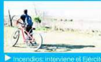
Incendios: interviene el Ejército

Los clubes de barrio y comedores mantendrán el subsidio en las tarifas