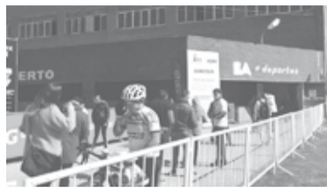
Humo en el aire por los incendios en el Delta del Paraná.