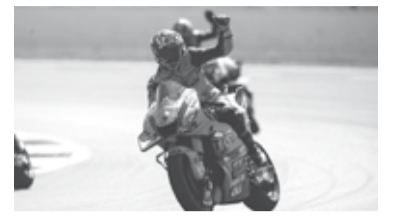
La "Bestia" lideró el predominio de Ducati.