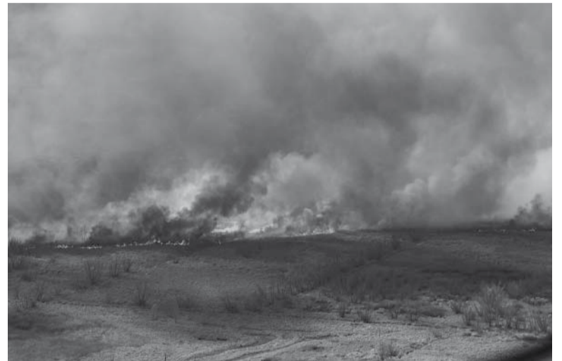
Alarma. Se necesitan más de 300 años para recuperar humedales.

"Continuamente se están quemando los mismos sitios en los humedales y los animales y la vegetación no están ajustados ecológicamente para soportar el fuego", explicó Paola Peltzer, doctora en Ciencias Naturales y