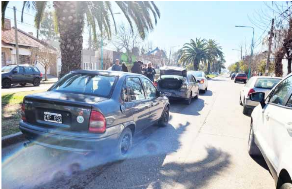
La ambulancia del SAME llegó a cargo del Dr. Rive-

El siniestro vial se dio con los tres vehículos marchando en la misma dirección, por la Almirante Brown hacia la Sociedad Rural.