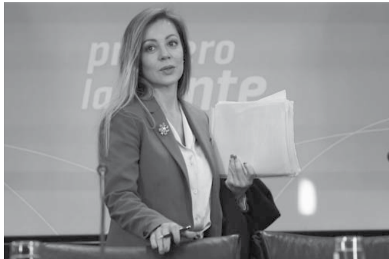
“Más justa”. Royón defendió la segmentación.

Ayer a la mañana, la secretaria de Energía de la Nación, Flavia Royón, sostuvo que el nuevo esquema tarifario de los servicios públicos decidido por el Ministerio de Economía responde a “una política de direccionar subsidios al que realmente lo necesita”, y aseguró que “es un mecanismo que debía hacerse” para contar