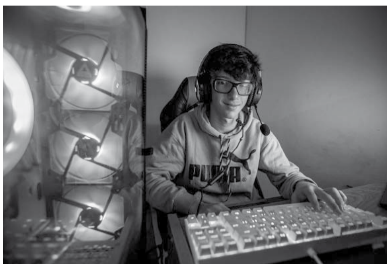
Más pantallas. Los menores articulan posibilidades. - Télam -

La especialista comentó que hay prejuicios en el sentido de lo positivo y negativo de las nuevas prácticas de juego, y cierta prevalencia de los adultos al juego analógico pero lo que se ve es que