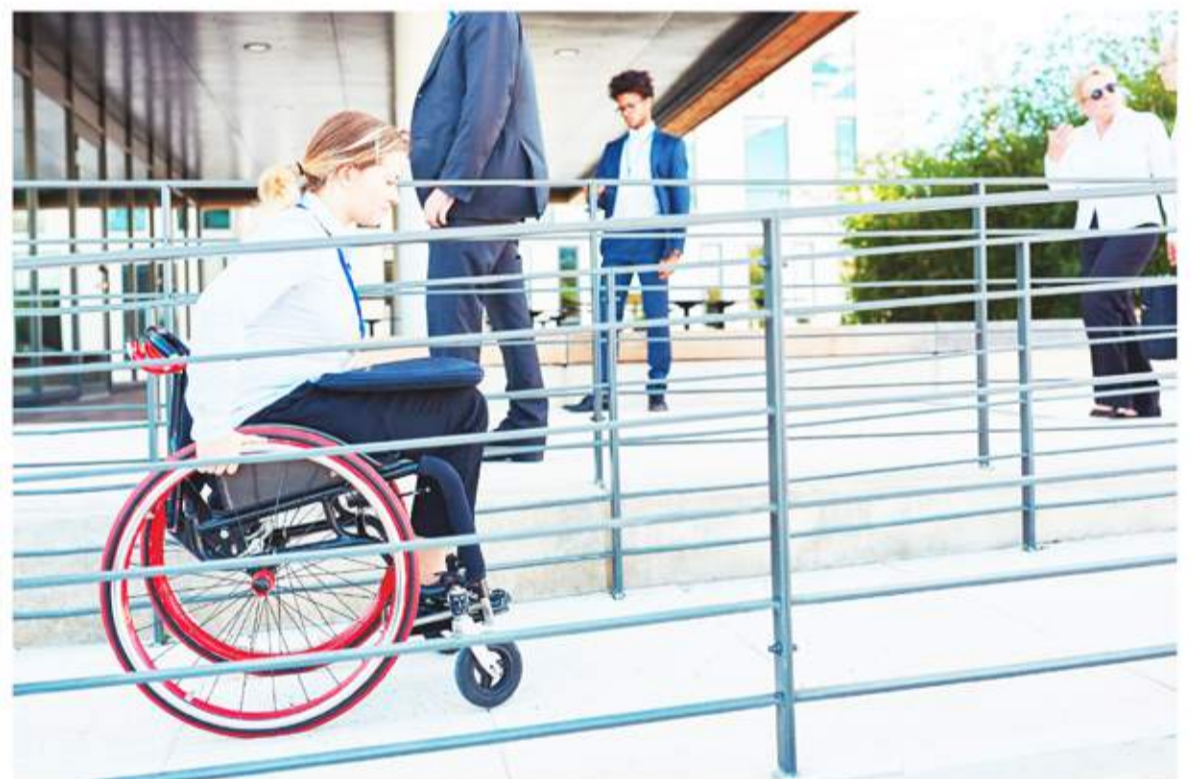
Discapacidad. El nuevo proyecto de ley entiende a la persona como sujeto de derecho y actor social.

Algunos de los puntos que abordará el proyecto de la nueva ley de discapacidad, tiene que ver