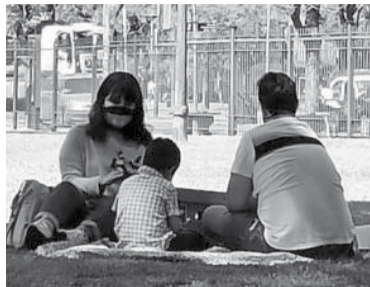
Más de 2.000 niños esperan ser adoptados en Argentina.