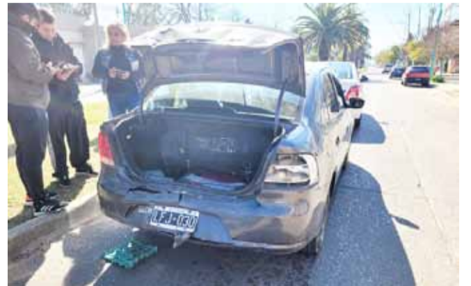
ro. En tanto, Policía local, Civil trabajaron en el lugar Seguridad Vial y Defensa del siniestro.