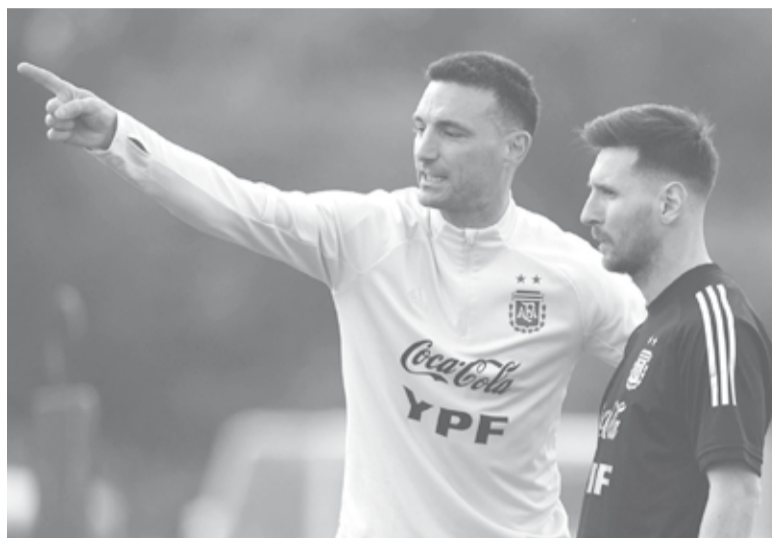
Tranquilidad. Scaloni tiene el panorama claro de cara a la gran cita.

Lautaro Martínez y Joaquín Correa marcaron goles en la victoria de Inter de local ante Spezia por 3 a 0 en un partido correspondiente a la segunda fecha de la Serie A de Italia, que le permitió a los