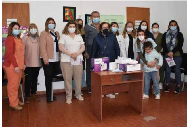
en la promoción de los espacios de atención a embarazadas y de apoyo a la lactancia materna.

Se trata de 2 sacaleches eléctricos que serán utilizados por aquellas mamás que así lo requieran, además se hizo hincapié