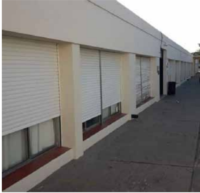
maternal, jardín, primario, media, terciario y universitario.

Cabe mencionar que la inversión del Fondo Educativo se utiliza en infraestructura como en programas educativos donde concurren más de 5.000 alumnos en los más de 50 niveles educativos y programas municipales entre