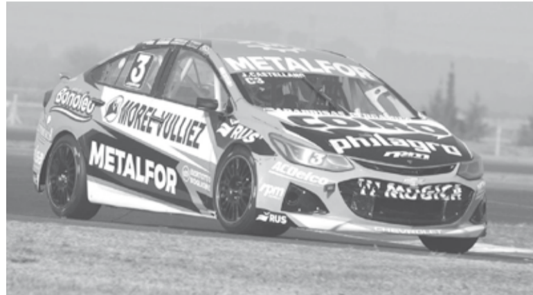
Por todo. El nacido en Lobería irá en busca del triunfo que necesita.