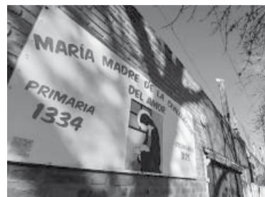
La escuela donde asistía Sofía Fernández.