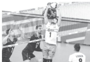
Con equipo alternativo, fue derrotado ante Irán.

Durante aquella noche, un grupo de barras velezanos agredió a los simpatizantes de la "T" que se hallaban "camuflados" en la Platea Sur Alta, cuando los organismos de seguridad no autorizaron la presencia de público visitante.