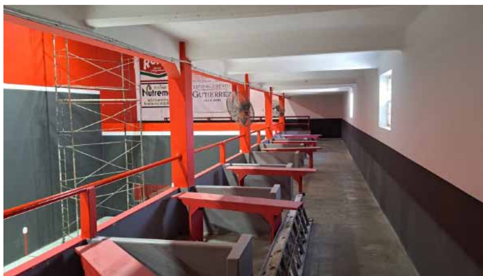
LOS PALCOS. Todas las instalaciones fueron remozadas.

Lo decíamos entonces, en aquella nota del mes de junio, y lo enfatizamos ahora: las instituciones de nuestro pueblo son nada más y nada menos que lo que sus dirigentes hacen por ellas. Y aunque el destinatario de estos párrafos que vienen se-