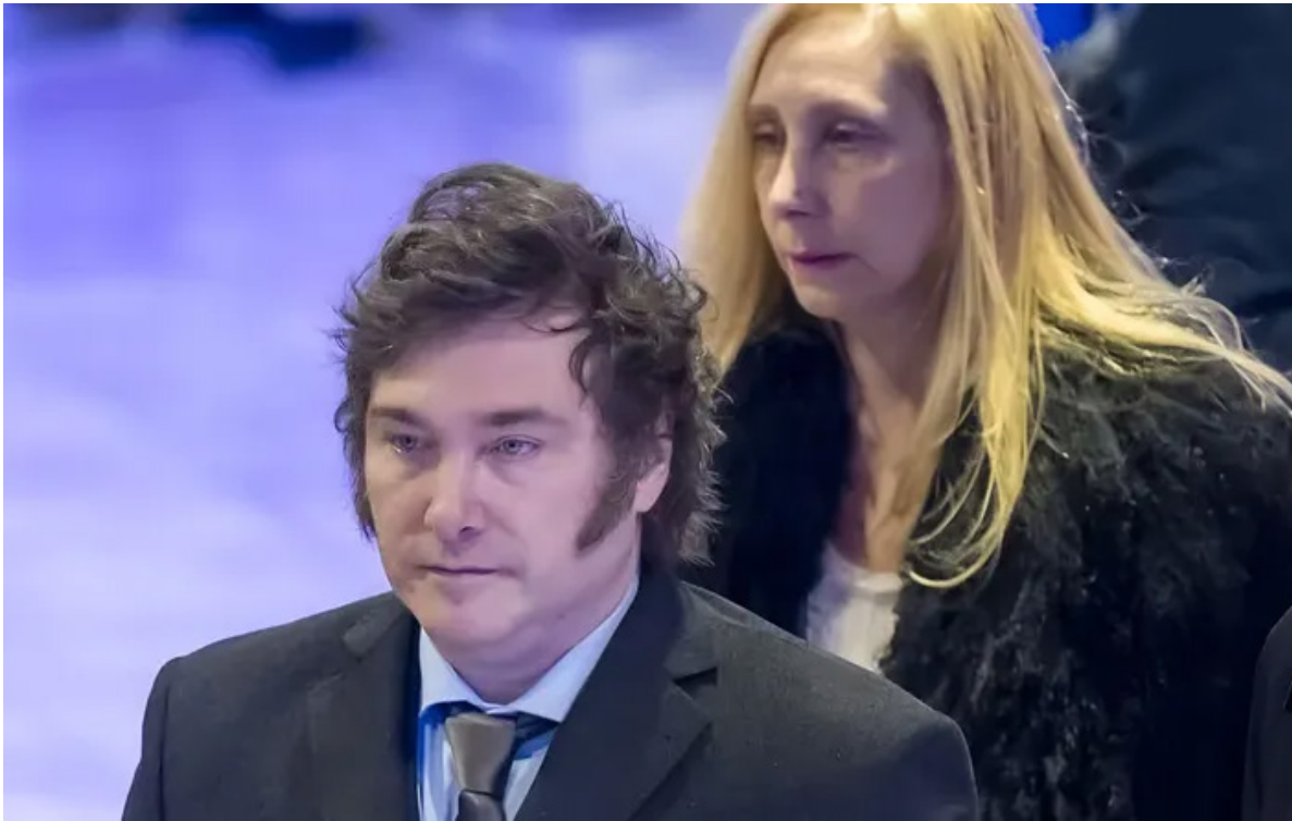
Javier Milei y su hermana Karina optaron por el silencio público