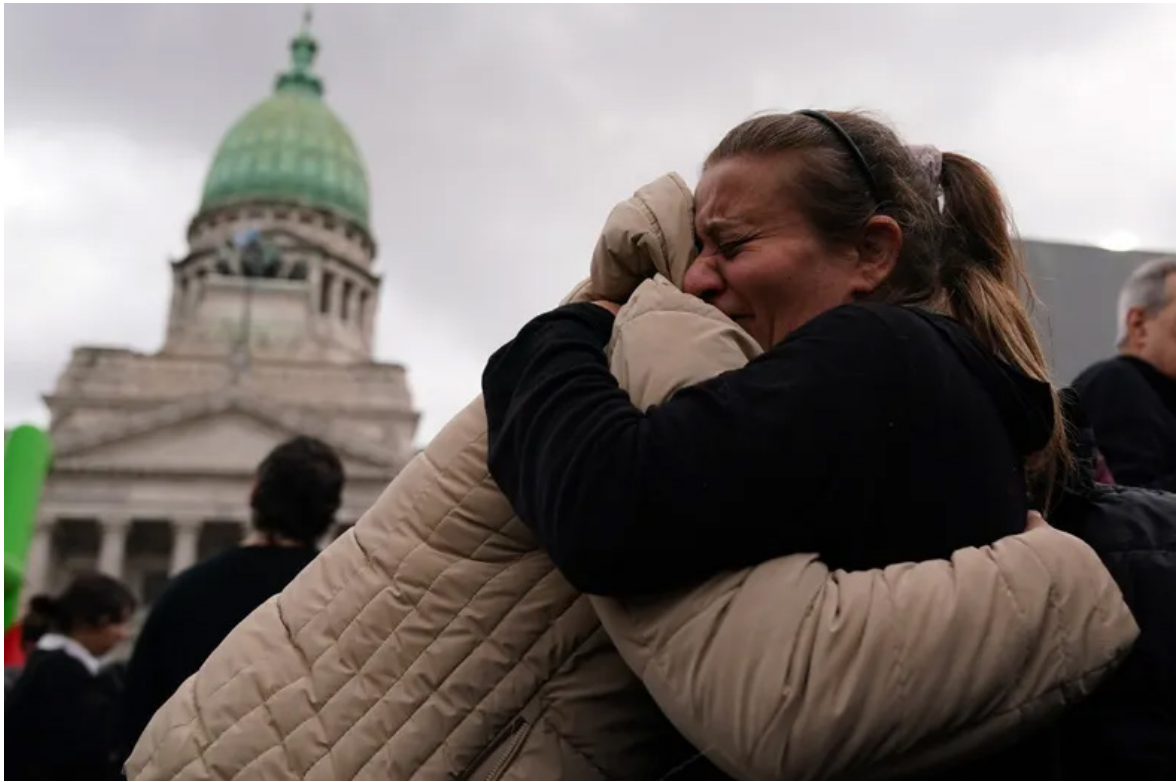
El rechazo al veto de Milei a la Ley de Discapacidad en Diputados fue celebrado en la Plaza del Congreso

Después de 22 años, el Congreso volverá a rechazar un veto presidencial. El Senado podría dejar firme la emergencia en discapacidad, con impacto fiscal de hasta 0,45% del PBI.