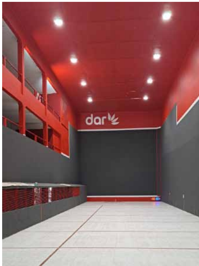
ANTES Y AHORA. Una millonaria inversión demandaron las labores realizadas.

su desenvolvimiento dentro de la cancha.