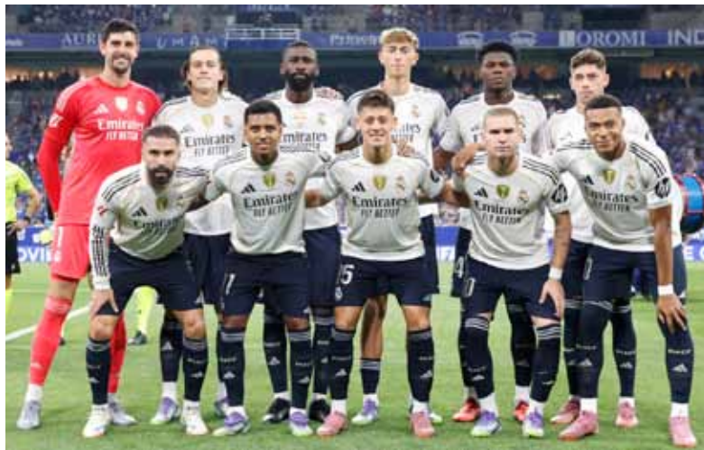
Titular. El argentino en el 11 inicial del Real Madrid

lugar de Brahim Díaz, tal como ocurrió en el partido anterior ante Osasuna, que el Real Madrid ganó