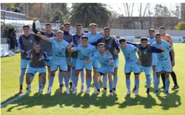
FEDERAL A - 6ª FECHA DE LA ETAPA CAMPEONATO