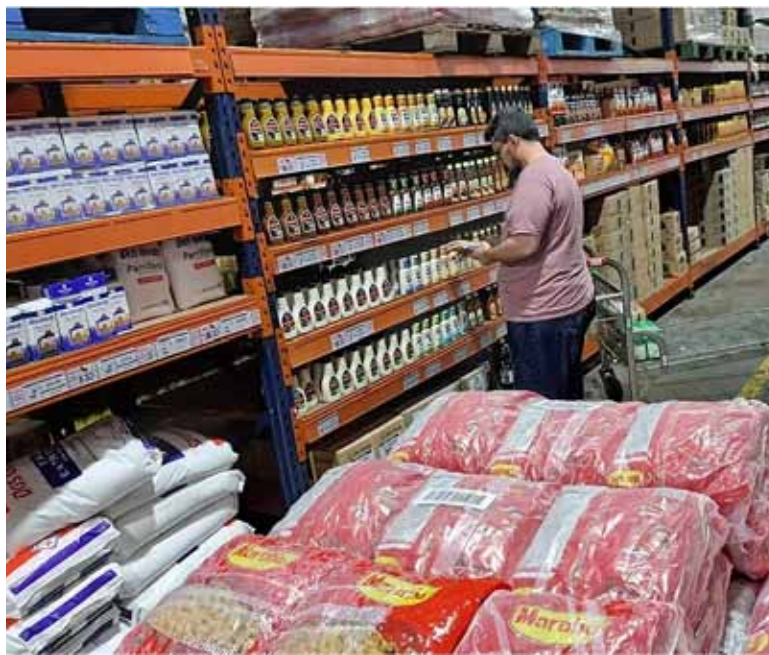
Para arriba. En mayo subieron 1,7% los productos nacionales y 1,3% los importados.

que, pese a esta aceleración mensual, hay que destacar que, en seis meses, la inflación mayorista alcanza una variación del 9,1%, mientras que la inflación minorista acumuló un 15,1% en el mismo período. “Esto puede