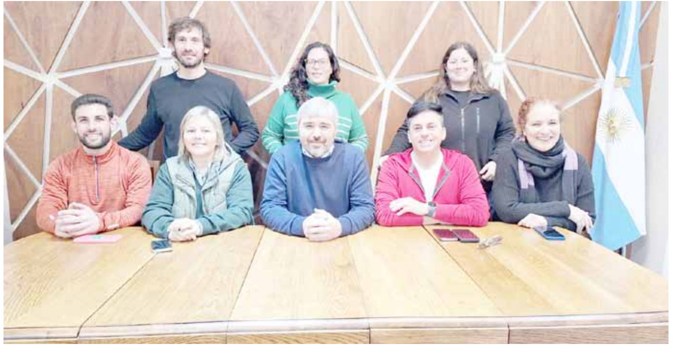
Todos los funcionarios que participaron ayer de la conferencia de prensa de presentación.

Además, junto a la Dirección de Ambiente y Desa-