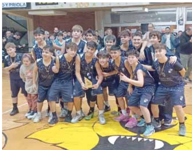
El combinado de la ABO hizo pesar la localía y se quedó con el primer puesto del Zonal.