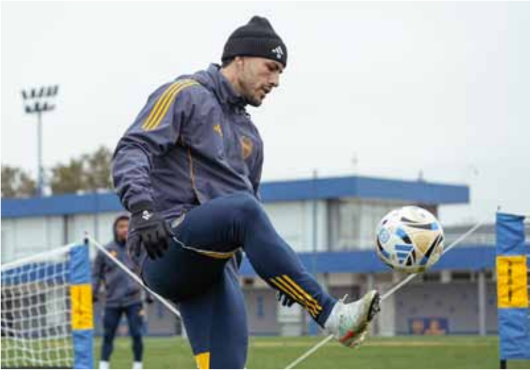
Al banco. En principio Paredes sería suplente y jugaría algunos minutos.

El equipo de Miguel Angel Russo recibe a Unión en la Bombonera y el volante de la Selección jugaría algunos minutos.