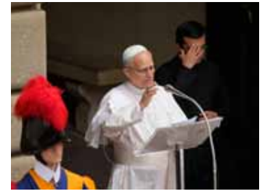
León XIV expresó su "profunda tristeza" por lo ocurrido.

El papa León XIV reiteró su llamamiento a un "inmediato alto el fuego" en Gaza y al "diálogo" entre las partes, tras expresar su "profunda tristeza" por el ataque perpetrado por Israel contra la parroquia de la Sagrada Familia de Gaza, la única iglesia católica de la Franja, con 4 muertos y 7 heridos.