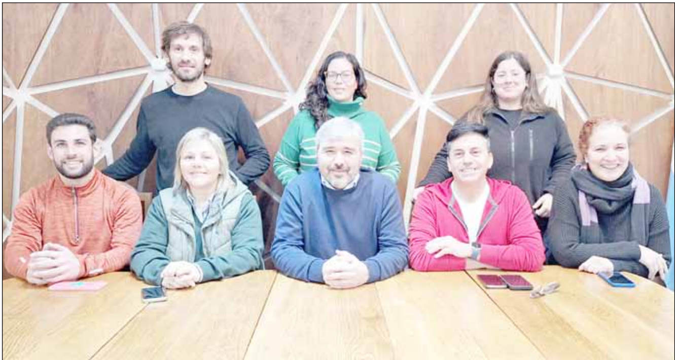
El secretario de Gobierno Marcos Beorlegui acompañado por referentes de distintas áreas municipales anunció la amplia grilla de actividades, que tendrán lugar desde el 19 de julio hasta el 2 de agosto.