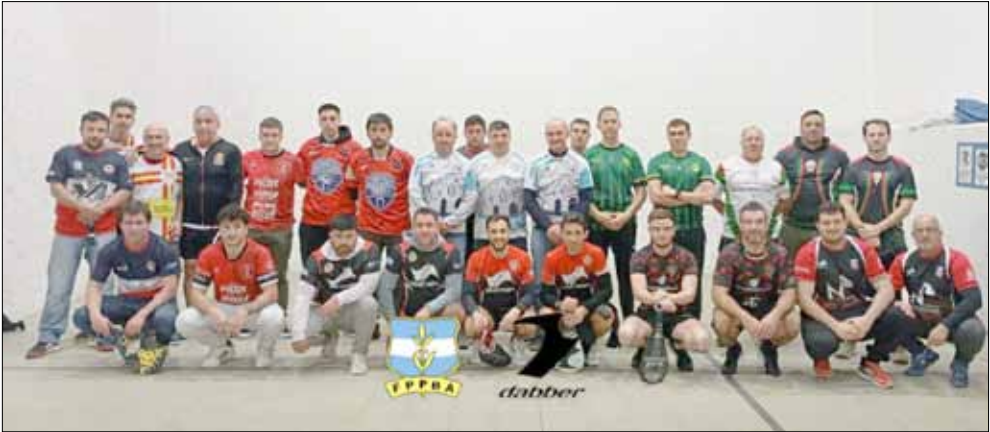
Gupo de participantes que reunió la Final del Torneo Apertura provincial de 6ª en Olavarría.