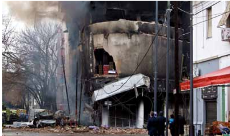
Desastre. Continúa la investigación por el incendio del edificio en La Plata.

En las primeras horas de ayer el fiscal recorrió la zona del desastre.