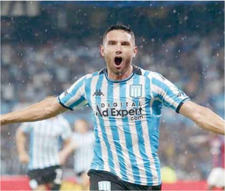
Blindado. Ante el interés de distintos clubes, la Academia decidió protegerlo.

Para siempre “Maravilla para siempre”, pu-