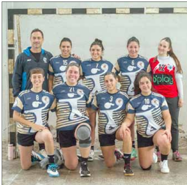
El equipo femenino obtuvo el subcampeonato en el Torneo Apertura.

Este domingo pasado concluyó la primera competencia del año correspondiente a la Liga APEBAL (Asociación Pehuajense de Balonmano), para equipos de Mayores de la zona. Entre los participantes, tanto en la rama femenina como en la masculina, estuvo el "MuniCEF", conjuntos representantes de nuestra ciudad.