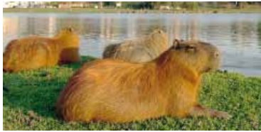
Carpinchos en Nordelta.

Carpinchos: el Gobierno les aplicará anticonceptivos