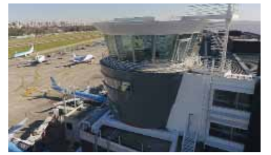
El Aeroparque Jorge Newbery.

Por conciliación obligatoria, el paro de pilotos queda en suspenso