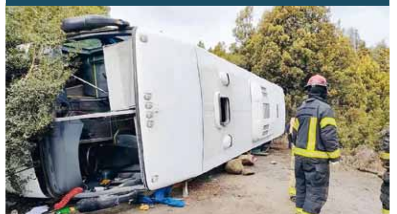
Un micro de turismo con 44 pasajeros a bordo volcó este martes al mediodía en la ruta provincial 65, a unos 15 kilómetros de la localidad neuquina de Villa Trafal. Al menos 15 personas fueron trasladadas a distintos centros médicos de la región y cinco de ellas sufrieron heridas de gravedad.