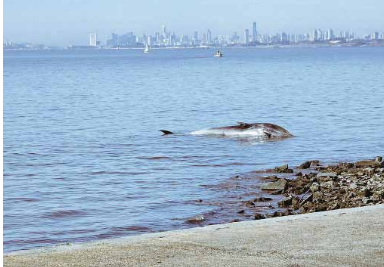
Extraño. En menos de una semana apareció otra ballena muerta en el Río de La Plata. - NA -

Este tipo de ejemplar había sido visto en mayo del año pasado, después de casi un siglo de ausencia en las costas nacionales, en la costa patagónica argentina. El descubrimiento estuvo a cargo de un equipo de científicos de la Universidad Nacional de la Pata-