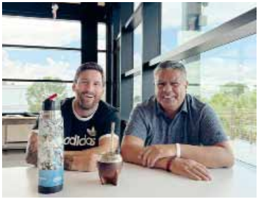
Sonrientes. Así se los vio al presidente de la AFA y al 10.