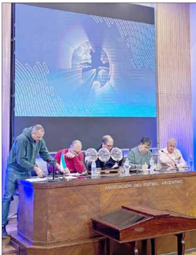
Aspecto del sorteo realizado en AFA.

Quinta fecha: visitante de Sportivo Atenas, de Río Cuarto.