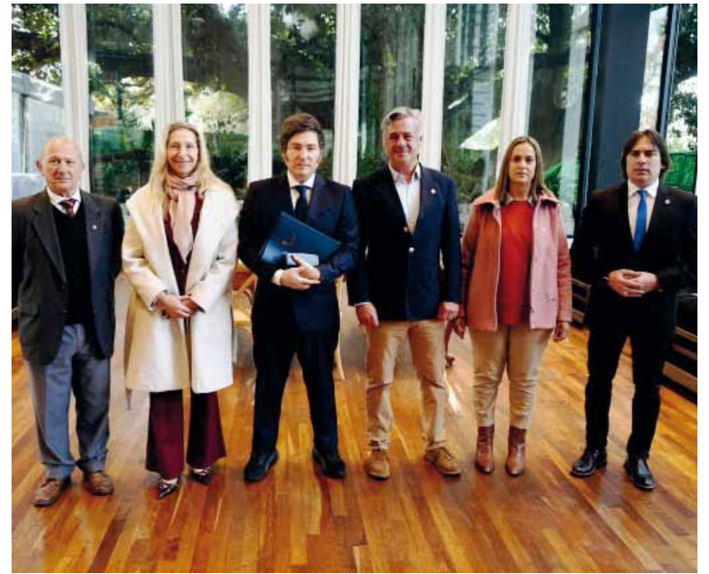
Encuentro. Los Milei junto a la SRA, Coninagro, Federación Agraria y CRA.

Además de los tributos a la exportación, la agenda incluyó el análisis de la falta de rentabilidad