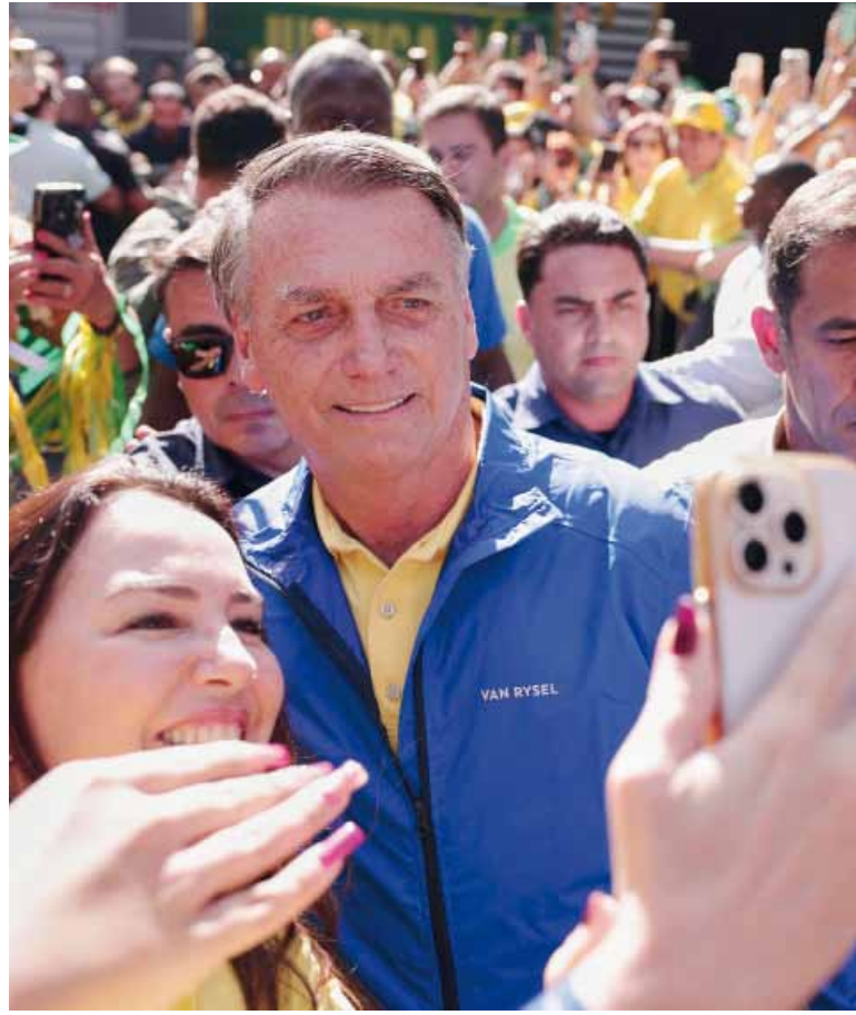
Alucinaciones. El senador brasileño Flávio Bolsonaro, hijo del expresidente Jair Bolsonaro, acusó al fiscal general de sufrir "confusión mental".

El juicio contra Bolsonaro se ha visto recientemente sacudido por el presidente de Estados Unidos, Donald Trump, quien anunció un arancel del 50 % a las importaciones brasileñas por considerar que su aliado es víctima de una "caza de brujas".