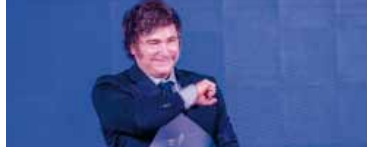
Milei contra el niño de 12 años.

Milei deberá explicar su publicación sobre Ian Moche