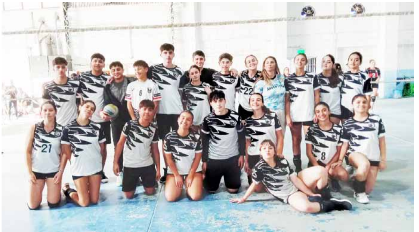
agradece a las jugadoras, técnico, por continuar con disciplina deportiva y seguir de las y los jóvenes deportistas. los jugadores y cuerpo el crecimiento de esta disciplina deportiva y seguir impulsando el desarrollo de las y los jóvenes deportistas.

compromiso libraron un intenso partido contra el local, Supernova Voleibol Club Asociación Civil, donde perdieron el primer set 24-26, ganaron el segundo 25-23 y cayeron en el tie break 14-16. Por lo que el desempeño del equipo femenino mostró el gran potencial que posee, especialmente considerando que para varias jugadoras era su primera experiencia en torneos. La próxima fecha de competencia de la Liga Supernova será el domingo 11 de mayo, jornada en la cual los equipos deroenses continuarán su andar en este certamen de carácter anual. Desde la Dirección de Deportes de la Municipalidad de Daireaux se felicita y