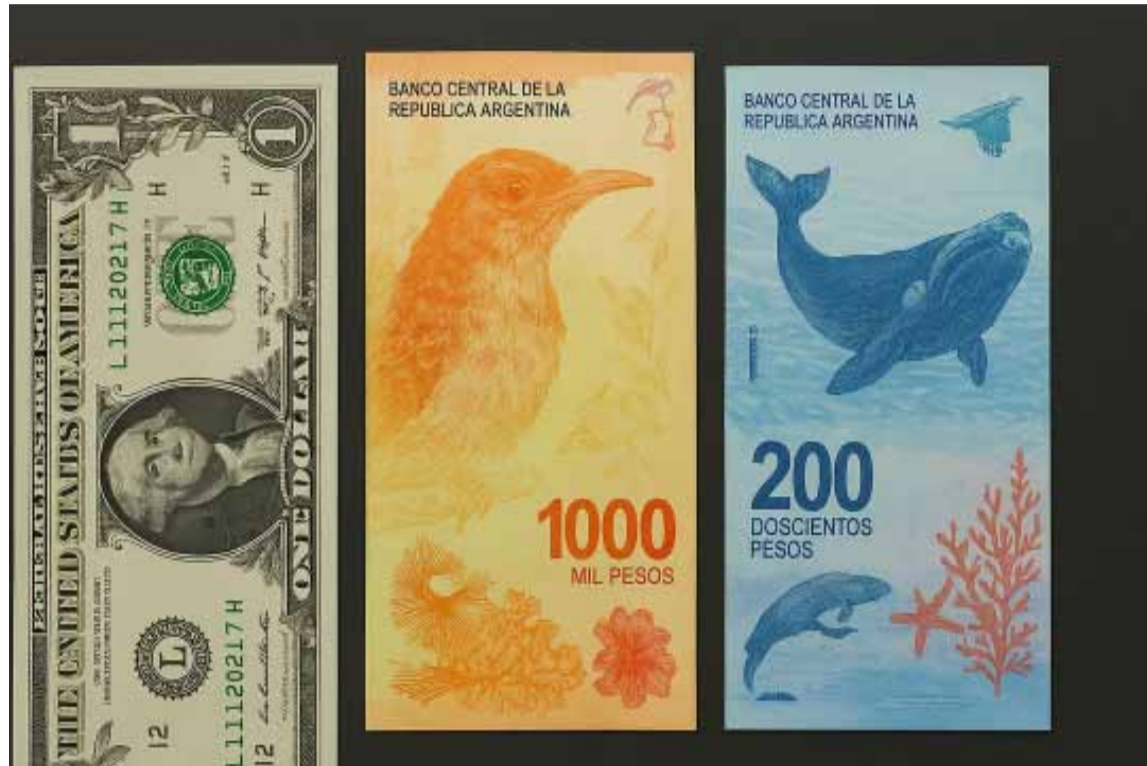
La cotización del dólar oficial cerró en $1180 para la compra y $1230 para la venta

El oficial cerró en $1180 para la compra y $1230 para la venta