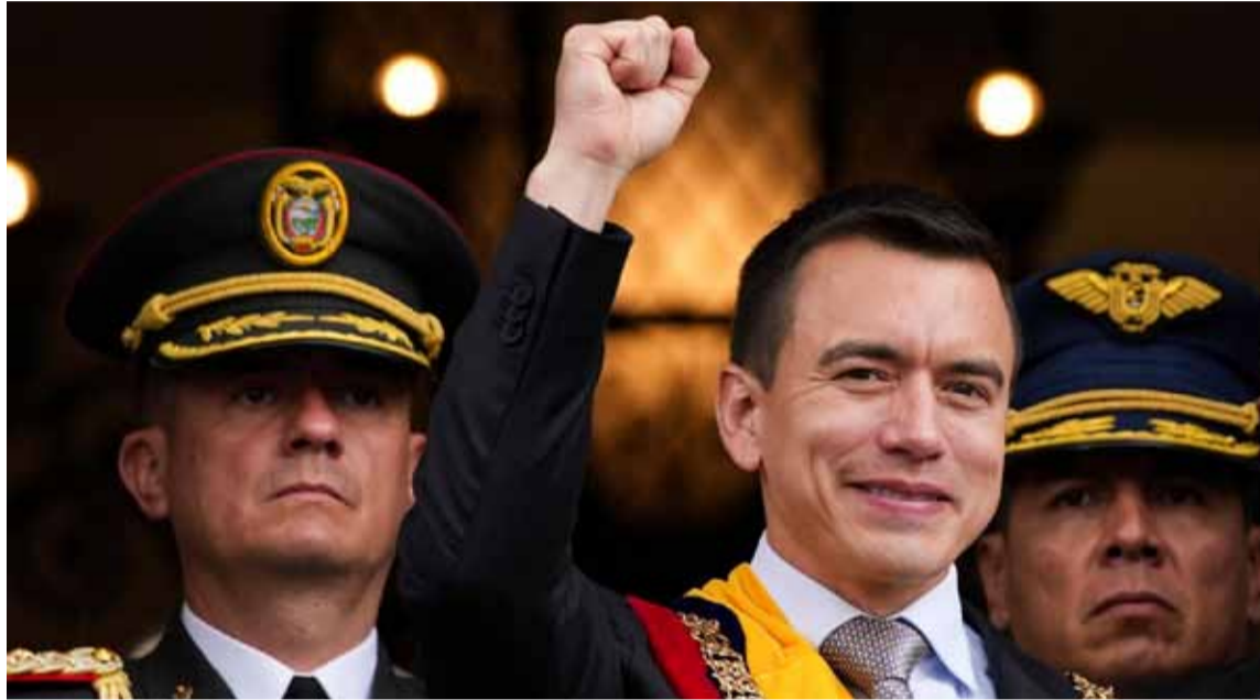
Noboa fue reelegido como presidente de Ecuador, pero la oposición denuncia fraude

El Consejo Electoral aseguró que con 92,63 % escrutado la "tendencia es irreversible" y Noboa ocupará la presidencia hasta 2029