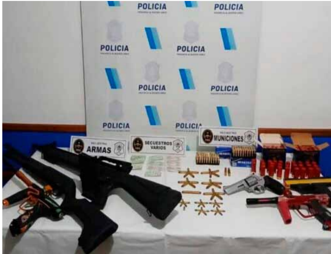
Las armas y balas encontradas en la casa del acusado

Encontraron un arsenal en su casa, durante el allanamiento