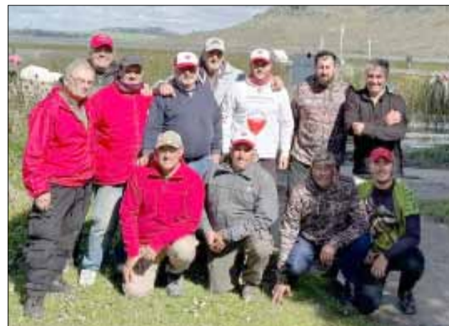
Bolivarenses que concursaron en La Brava.

ganar en mi bote, donde competí con un pescador de Lobería y otro de Tres Arroyos. Yo saqué nueve pejerreyes, otro 7 y el otro 6, o sea que les gané por dos o tres pescados, pero al ir a los cómputos generales, me fue mal porque el ganador de la fecha sacó 25, es decir que cerró bolsa. En esto, el factor suerte es clave; por más que seas el mejor pescador del mundo, si anclaste en un lugar donde no hay pescados no los vas a sacar... Ahora puede pasar que yo esté en el mismo bote del que sacó 25 y tampoco alcance esa cantidad, pero normalmente si lo igualás en línea, en profundidad y demás, es raro que no obtengas el mismo resultado que tu rival. Como dije, el sábado fuimos muchos los que anduvimos bien en nuestros respectivos botes, pero en la clasificación general se vio que hubo otros sectores donde se