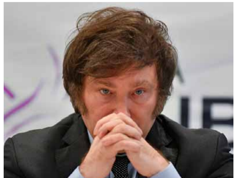
El presidente Milei