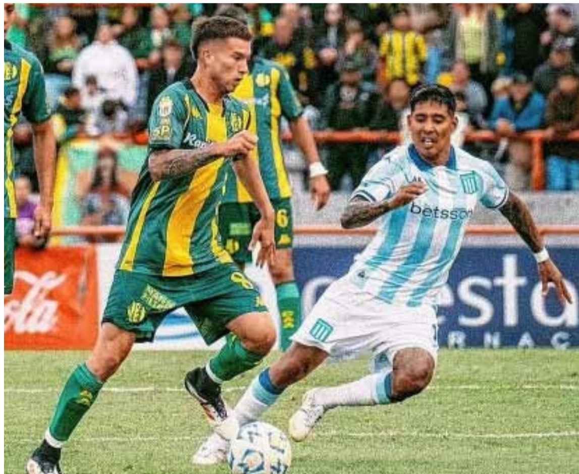
Racing se hizo fuerte en Mar del Plata