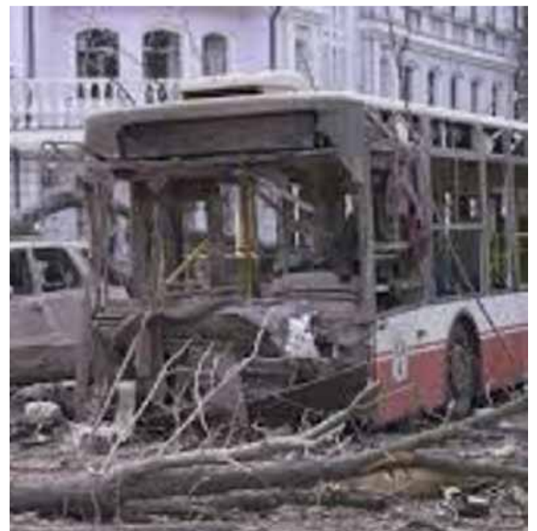
Aspecto de un sector de Sumy tras el ataque