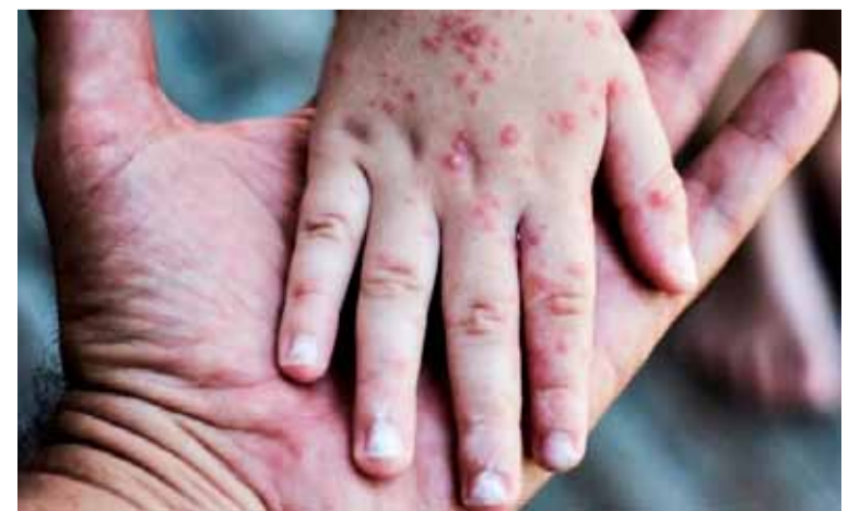
Se conoció un nuevo caso

La campaña focalizada con vacuna Doble viral está indicada para la población de 6 a 11 meses (dosis cero) y de 13 meses a 4 años (dosis adicional) en el AMBA, cuyo objetivo es interrumpir cadenas de transmisión, evitar que el virus se propague en la comunidad, además de proteger a la población de más riesgo.