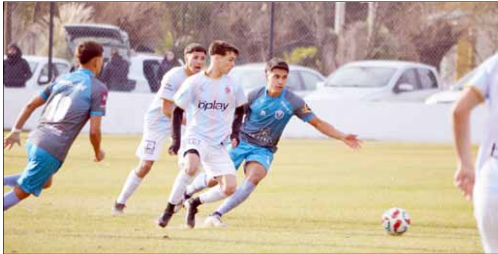
El 30 de junio del año pasado se disputó la segunda final del Interligas y se consagró campeón Ciudad ante Balonpié (foto). Este año, como ocurrió en 2025 con Boca de Azul, el campeón no defendería el título.