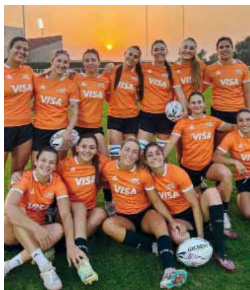
Unidas. La Selección busca crecer en Dubái.

Aun así, la salida de Xabi Alonso puso de manifiesto tensiones internas dentro del plantel. Tras el anuncio oficial, la mayoría de los jugadores reaccionó con mensajes de agradecimiento y fotos en redes sociales, pero siete futbolistas permanecieron en silencio. Entre ellos se encuentra Mastantuono, lo que generó cierta atención mediática en España y abrió debates sobre las implicancias de la transición en el cuerpo técnico para los jóvenes talentos.