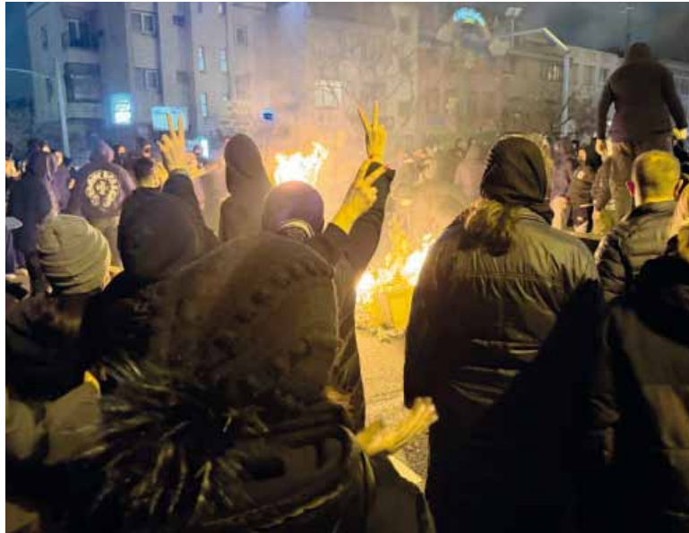
Víctimas. Los activistas señalaron que hay más de 2.000 muertos tras la represión.

Los contactos se mantuvieron después de que Trump amenazara con atacar a la nación islámica en respuesta a la represión activada por las autoridades contra las manifestaciones multitudinarias en esa nación, que están dejando un elevado número de muertos y detenidos.