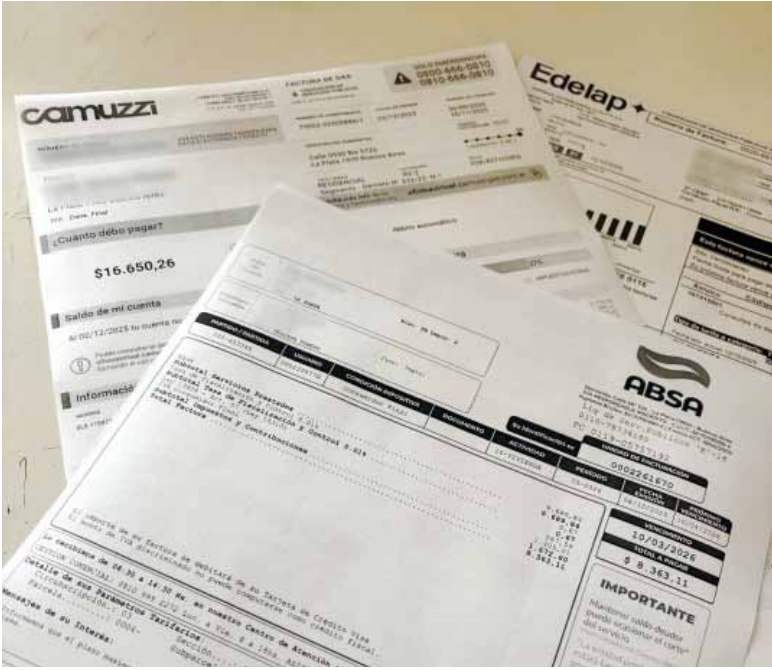
Para arriba. “Vivienda, agua, electricidad, gas y otros combustibles”, subió 3,4%.

“2025: LA INFLACIÓN MÁS BAJA DE LOS ÚLTIMOS 8 AÑOS”, celebró en la red social X el ministro de Economía, Luis Caputo. “El año 2025 concluye con la inflación más baja de los últimos 8 años, tanto en su medición a nivel general, como núcleo. Un logro extraordinario teniendo en cuenta que se obtuvo en un contexto de reacomodamiento