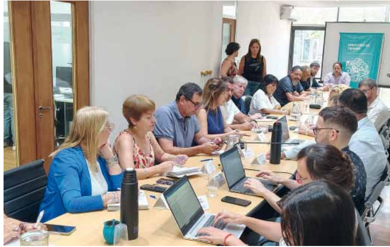
En la mesa. Gobierno y los gremios discuten la recomposición salarial.

Ahora, los gremios pretendían un retroactivo para empardar la inflación de noviembre y diciembre 2025 -2,5% y 2,8%, respectivamente- pero el Gobierno por ahora no ofertó nada. Tampoco están de acuerdo con el 1,5% para el primer mes de 2026, un porcentaje que parece debajo de la inflación probable si se tiene en cuenta el