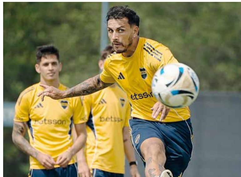
Puesta a punto. Primer ensayo formal para los de Úbeda.

El "Xeneize" completó la pretemporada en el predio que el club posee en Ezeiza y, aunque todavía no oficializó incorporaciones, se espera la llegada del colombiano Marino Hinestroza. La gran figura del equipo sigue siendo Leandro Paredes, mediocampista de la Selección argentina y eje del juego, por quien pasan las principales expectativas futbolísticas. Boca apunta a esta serie