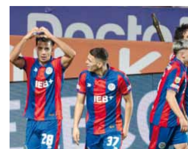
Prueba. Duelo exigente en Montevideo.