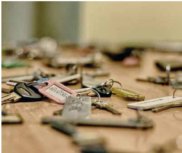
Mercado. Cada vez se destina una mayor parte del salario para cumplir con el alquiler.

Obviamente, al analizar estos datos que toma información del INDEC, ARBA, ARCA o el Banco Central y de inmobiliarias radica-