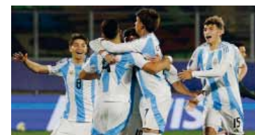
Todos juntos. Los pibes de Placente van por otra alegría.

El encuentro será a las 16:30 en el Estadio Nacional Julio Martínez Prádanos, de la ciudad de Santiago de Chile.