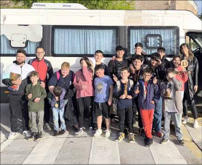
La escuela local, siempre presente en el Prix.