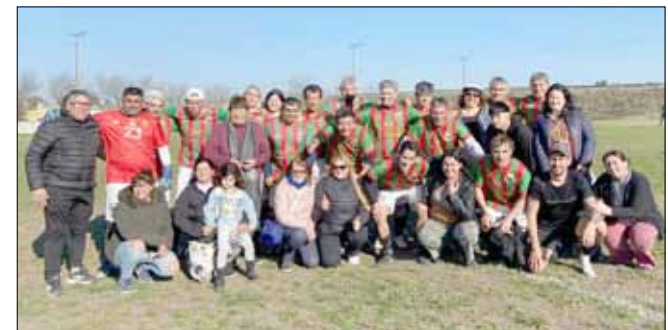
Panadería La Criolla.