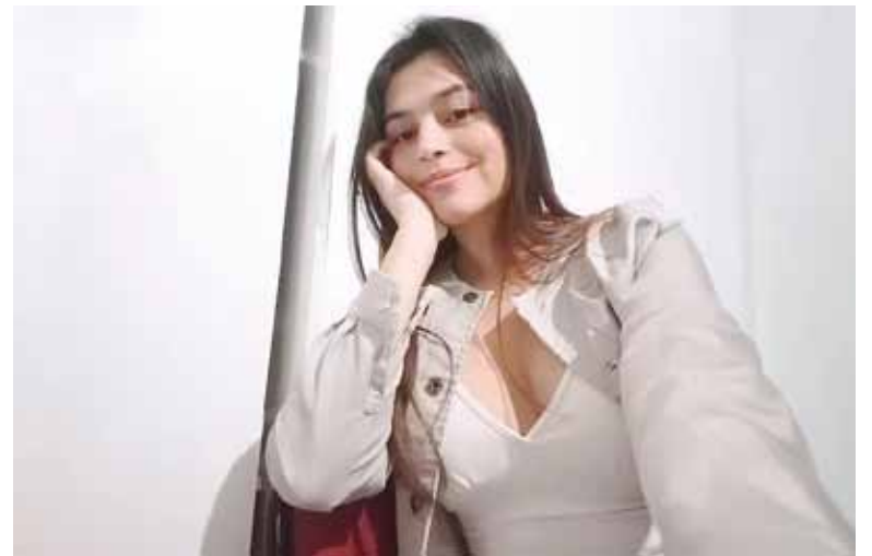
Investigación. La autopsia determinó que fue asesinada de un disparo.

El fiscal Saliski confirmó que se analizan los dispositivos elec-