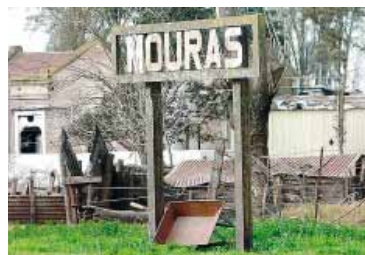
Desafectación. Del uso ferroviario y de la concesión de un inmueble ubicado en la localidad de Salazar.

Hasta el momento, el Gobierno no brindó precisiones sobre el destino que tendrán los terrenos en