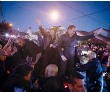
Campaña. La caravana del oficialismo en Mar del Plata.

El presidente Javier Milei encabezó ayer una caminata por la