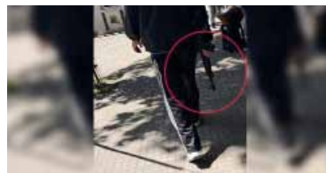
Momentos de conmoción se vivieron en los pasillos de la institución.

Personal del Comando de Patrullas llegó al establecimiento, en la calle 117 y 47, y, tras recabar datos y testimonios de testigos, constataron que la amenaza no era real: se trataba de un menor de edad de condición autista, que había ingresado a la facultad con un arma de juguete. En tanto, la situación llevó a que se paralizaran algunas clases y