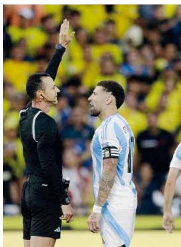
Desazón. Dura baja para Scaloni.

El zaguero del Benfica completó las Eliminatorias como uno