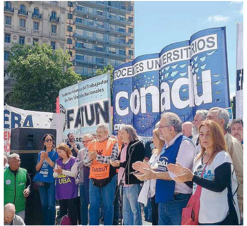
Jornada de lucha. Se iniciará hoy con una serie de acciones de reclamo.

Es el martes 14 de octubre en reclamo de mejores condiciones laborales. La protesta impactará en la provincia de Buenos Aires y el resto del país.