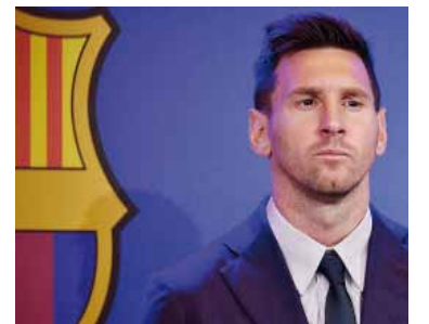
El astro argentino pendiente de la política en Can Barça.