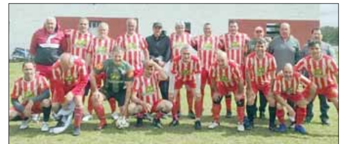
Empleados de Comercio.