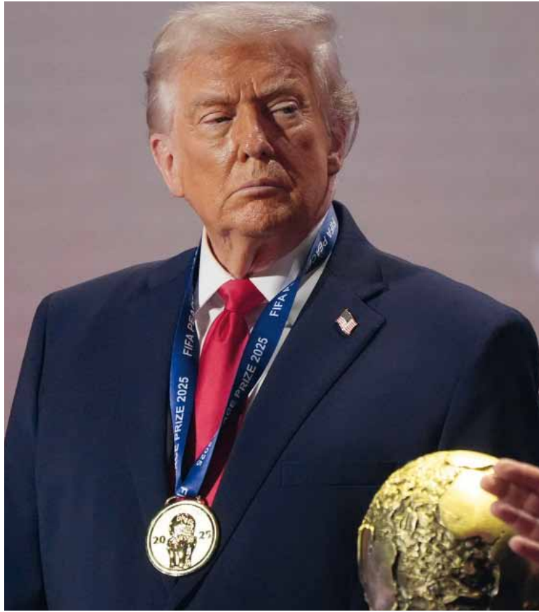
Autoelogio. El Gobierno de Trump reivindica sus esfuerzos para poner fin a la guerra de Ucrania, un conflicto que tuvo un "efecto perverso".

El informe anuncia el restablecimiento de la Doctrina Monroe de 1823 para consolidar a Estados Unidos como el principal poder del continente americano y evitar la presencia de fuerzas externas, una velada referencia para