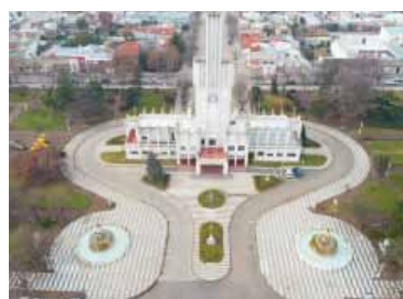
Premio. Para quienes tengan los impuestos al día.

Las órdenes de compra podrán ser canjeadas exclusivamente en comercios de Coronel Pringles que