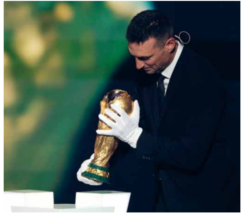
Motivado. Lionel Scaloni irá en busca de la cuarta estrella en norteamérica.

El Mundial 2026 marcará la primera participación de Jordania en la Copa del Mundo. El equipo clasificó tras finalizar segundo en su grupo de la tercera ronda asiática con 16 puntos y llega con un