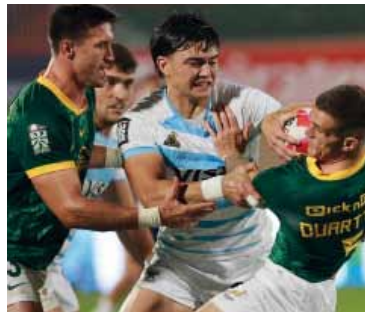
Revancha. A dejar atrás Dubai

En la competencia femenina, el Grupo A estará conformado por Nueva Zelanda, Gran Bretaña, Fiji y Estados Unidos, mientras que el Grupo B lo integrarán Japón, Ca-