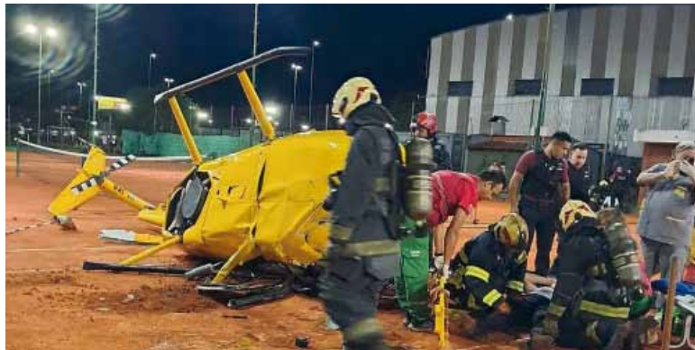
Por desperfectos. El helicóptero cayó sobre las canchas de tenis del ex KDT

La maniobra redujo la velocidad de caída y evitó una tragedia mayor, pero la aeronave terminó golpeando el suelo con