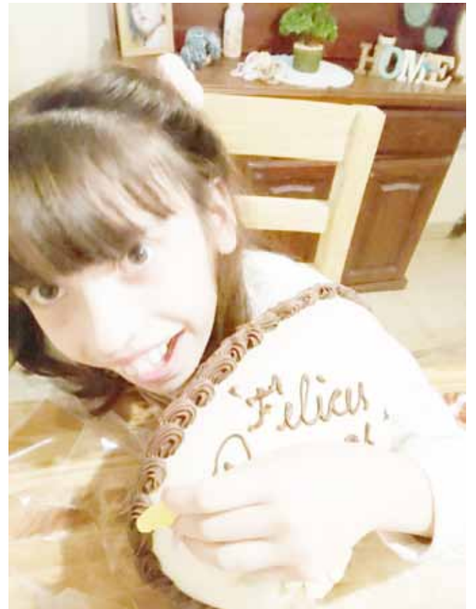
a través de Instagram @ alma.montru2013