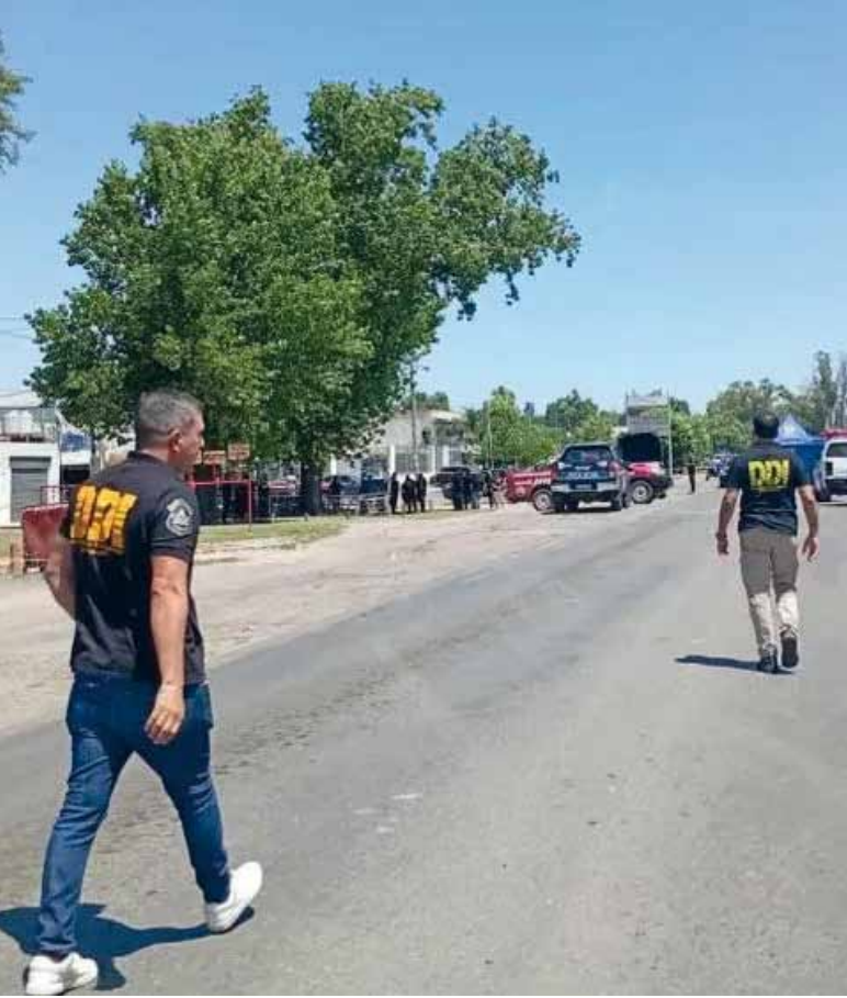
En Pilar. Un policía mató a un asaltante

Un violento intento de robo ocurrido sobre la Ruta 28, a la altura del barrio Peruzzotti de Pilar, terminó con un delincuente abatido luego de que un sargento del Grupo de Apoyo Departamental (GAD) repeliera el ataque de cuatro motochorros que lo venían siguiendo desde el partido de Tres de Febrero. El policía, de 30 años, circulaba de civil a bordo de su Chevrolet Agile tras retirar una importante suma de dinero de una sucursal bancaria, cuando fue interceptado por dos motocicletas con dos ocupantes cada una. De acuerdo con las fuentes de la investigación, los delincuentes habían “marcado” al efectivo en la entidad bancaria y lo siguieron durante varios kilómetros hasta encontrar el momento para asaltarlo. Según indicó el diario Resumen de Pilar, la emboscada ocurrió alrededor de las 17 del jueves, cuando el vehículo del sargento quedó detenido en un semáforo en Ruta 28 y Pasteur. Le robaron la mochila En ese instante, uno de los asaltantes rompió la ventanilla del acompañante y sustrajo una