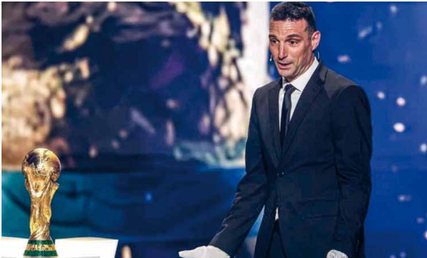
■ Lionel Scaloni, con guantes blancos y emocionado, presentó la copa en el sorteo

por la Legislatura bonaerense. La advertencia encendió alarmas sobre un eventual riesgo de default provincial y profundizó el conflicto político entre el presidente de la Nación y el gobernador. Página 3