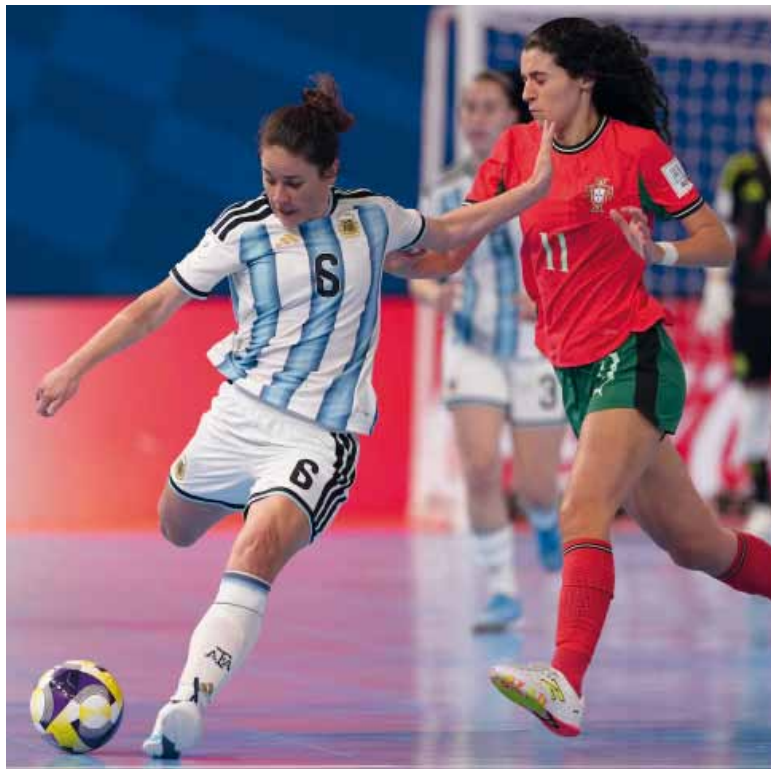
Impotencia. La Selección fue ampliamente superada en todas sus líneas.