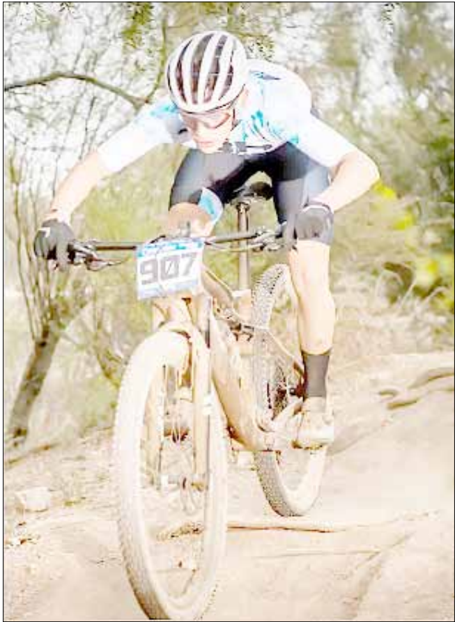
El bolivarense cerró el año con otra buena actuación en tierras tandilenses.

nil Campeón de la provincia de Buenos Aires Campeón de la provincia de Río Negro Campeón del Open Bonaerense Ganador Río Pinto (general 32km) Ganador VAC (general 32kn) Subcampeón Argentino de Ruta Subcampeón XCO Tercer puesto Sudamericano En resumen: 28 carreras realizadas, 21 ganadas, 3 segundos puestos, 2 terceros puestos, 1 cuarto puesto, 1 quinto puesto y a la espera de un 2026 de muchas nuevas experiencias.