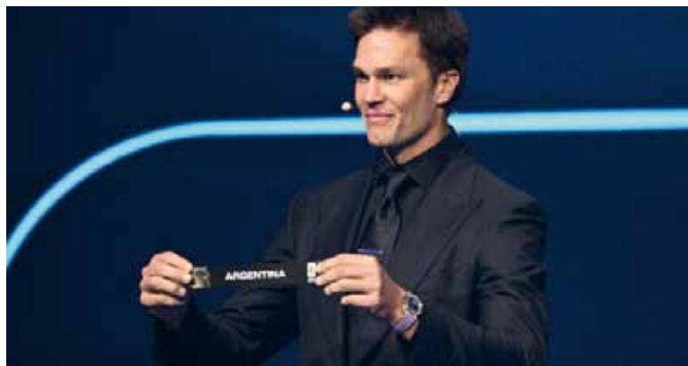
Sorteo. Momento en que salió el listón de Argentina en Washington.