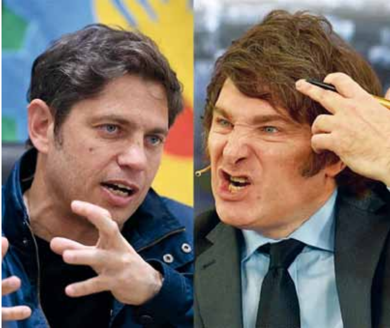
Alta tensión. Entre Axel Kicillof y Javier Milei

Según Caputo, la norma impide a las provincias tomar financiamiento si el "gasto corriente corre por encima de la inflación", algo que, según dijo, ocurre en territorio bonaerense.