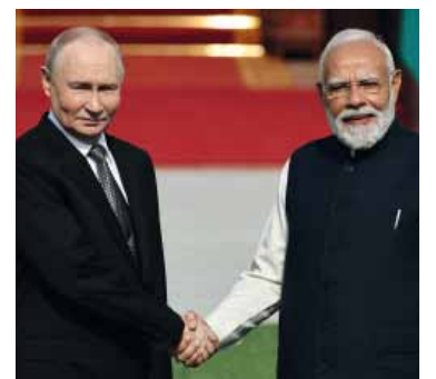
Unión estratégica. El jefe del Kremlin y el primer ministro indio ratificaron la alianza entre ambos países.

El presidente Putin aseguró que Moscú es un proveedor confiable de petróleo, gas y carbón para la India y que Rusia podrá continuar enviando combustible de manera "ininterrumpida" a la economía india.