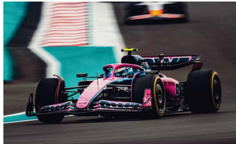
Frustrado. Franco no pudo progresar en Yas Marina.

Jornada irregular para el pilarense, mientras que el británico dominó ambas sesiones.