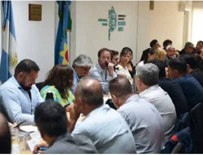
Alta tensión. Entre Axel Kicillof y Javier Milei

Los gremios afirman que ahora "están dadas todas las condiciones" para volver a negociar con Kicillof. Hasta octubre, los sueldos aumentaron 25,9%