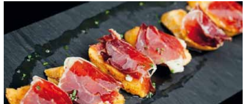
Suspendido. Jamón, un manjar para los argentinos.

El Senasa tomó esa decisión tras la detección de peste porcina africana en jabalíes de Barcelona