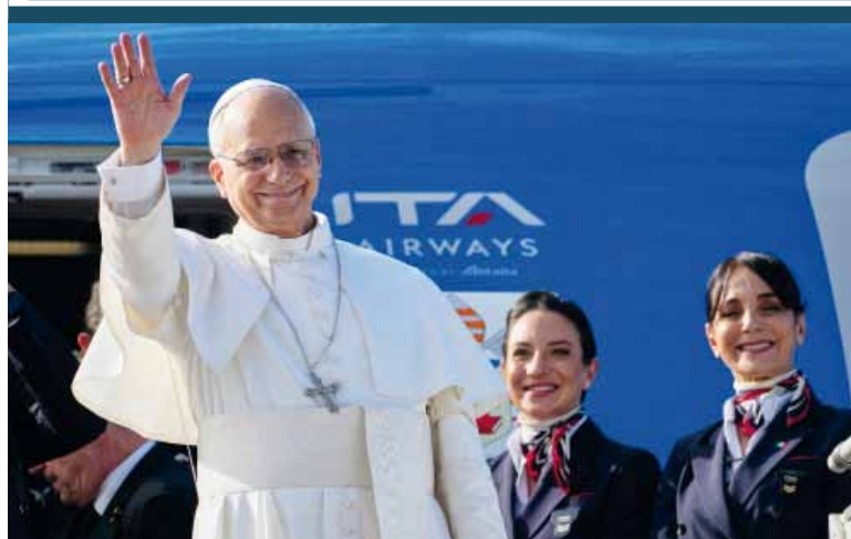
El papa León XIV finalizó ayer su primera gira pastoral que lo llevó por Turquía y Líbano y ya regresó a la Santa Sede. Antes de partir, "pronunció un discurso de despedida en el que saludó al País de los Cedros", tras haber visitado primero Turquía y Líbano. "Todas las conversaciones que mantuve durante mi estancia tanto en Turquía como en el Líbano, incluídas las que tuve con muchos musulmanes, se centraron precisamente en el tema de la paz y el respeto hacia las personas de diferentes religiones", explicó.