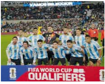
Por otra estrella. La Selección se ilusiona con ser bicampeona.

Amenaza Italia Finalmente, en el Bombo 4 to-