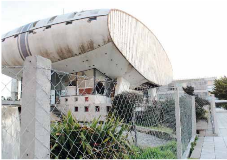
A subasta. El Casino se encuentra muy deteriorado.