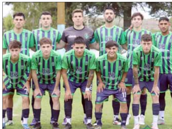
Embajadores enfrentará a Deportivo Norte (MdP) y Ferro hará lo propio con All Boys de Santa Rosa.

La Zona 4 de la Región Pampeana Sur, correspondiente al Torneo Regional Amateur 25-26, llevó adelante su último partido de la fase clasificatoria el domingo pasado, en Olavarría. Por la sexta y última fecha, que había comenzado el viernes con el triunfo de Ferro Carril Sud sobre Balonpié por tres a uno en la cancha de Alem, se jugó el encuentro entre Loma Negra y Embajadores. El partido llevado a cabo en Villa Alfredo Fortabat finalizó igualado sin goles, por lo que Embajadores