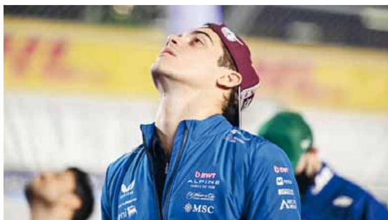
Concentrado. El piloto argentino enfrenta en Yas Marina el último desafío 2025 en la escudería francesa.

En la recta final del año mantuvo cierta regularidad, aunque lejos de la zona de puntos: 17° en Monza, 19° en Bakú, 16° en Singapur, 17° en Austin y Las Vegas, además de un abandono en la Sprint de Brasil. Con un año atravesado por altibajos, Colapinto encara la última fecha con la intención de