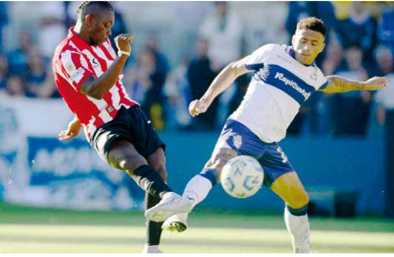
Disputa. Cetré y Pintado volverán a protagonizar un partido caliente.

Gimnasia y Estudiantes decidirán el finalista del Torneo Clausura en el Bosque.