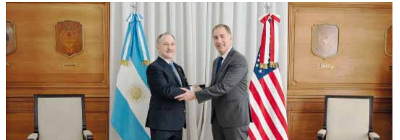
Encuentro. El ministro del interior se reunió con el funcionario estadounidense.

Desde la cartera que lidera el referente del PRO revelaron que