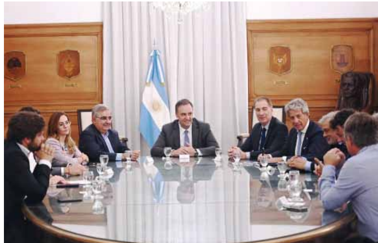
Cercanía. El gobernador catamarqueño viene forjando una buena relación con el Gobierno nacional.