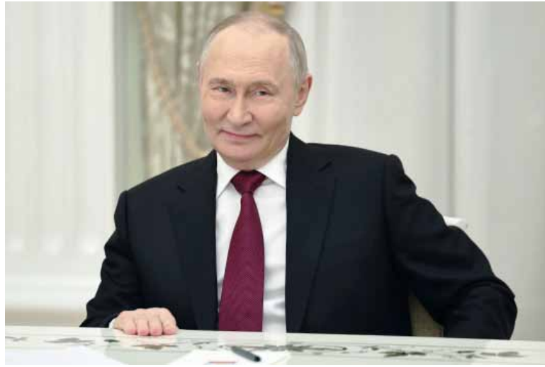
Encuentro. El mandatario ruso se reunió ayer en el Kremlin con los enviados estadounidenses Steve Witkoff y Jared Kushner.