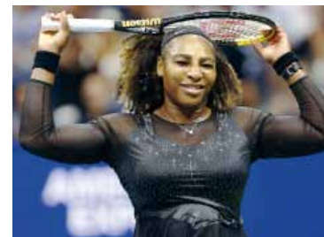
La estadounidense inició el proceso de reintegración a la ITIA.

A sus 44 años y tres temporadas después de su despedida, Serena Williams tendría todo encaminado para retornar al tenis. La estadounidense, una de las máximas figuras de la historia, dejó de competir oficialmente tras su eliminación en el US Open 2022, pero ya inició los trámites necesarios para volver al circuito.