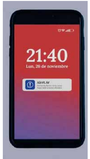
Alarma. El sistema AlertAR.