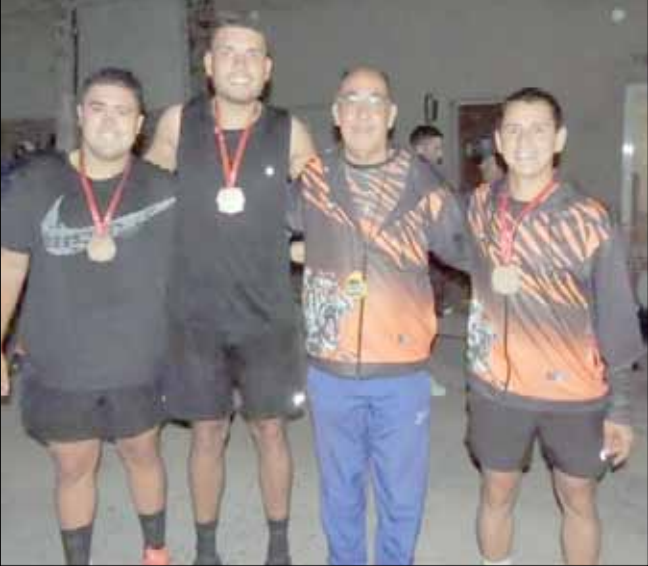
Satisfacción en el grupo bolivarense "Los Tigres" por lo realizado en esta competencia.