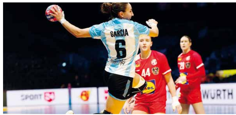
Recuperación. La selección reaccionó a tiempo y selló su clasificación.

mania y Japón se cruzarán con Hungría, Suiza y Senegal en el Grupo 1, Argentina -tercera del Grupo E- avanzará al Grupo 3, donde ya están confirmados Países Bajos (1°) y Austria (2°).