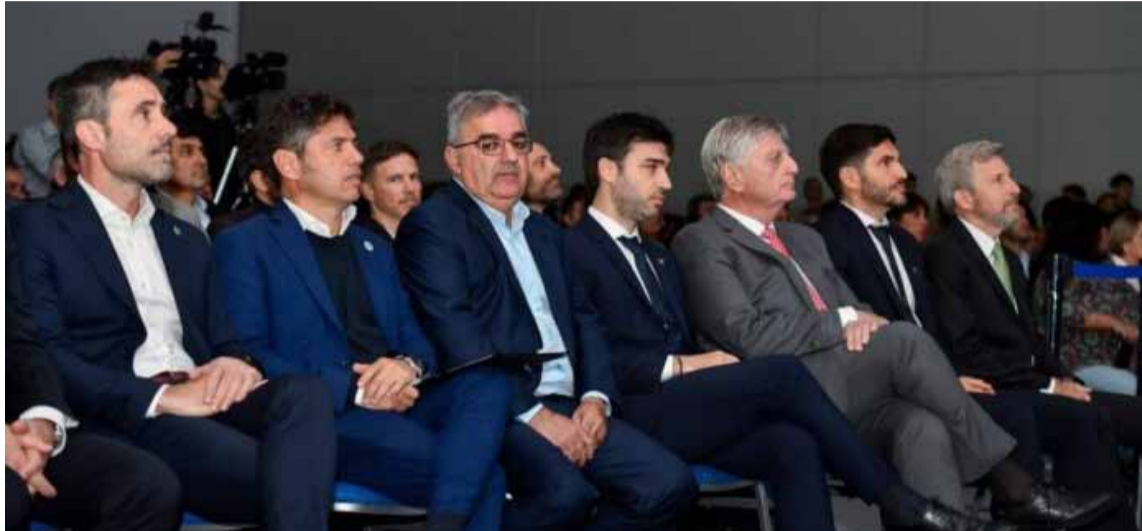
Kicillof, junto a otros gobernadores, en un encuentro realizado en Entre Ríos

Fue en Entre Ríos en un evento organizado por el Consejo Federal de Inversiones