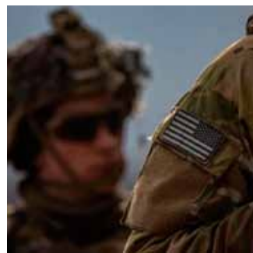
Polémica. En el Ejército de los EE.UU. por decisión de Trump

La demanda había sido presentada por seis miembros en activo y dos personas que querían alistarse, alegando que esa orden violaba sus derechos constitucionales.///