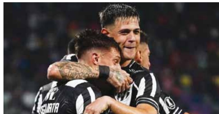
En Santiago del Estero se ilusionan con meterse en los octavos de final

Los santafesinos no se rinden a pesar de terminar últimos en su zona del Apertura. Con Madelón, sueña con avanzar a la siguiente fase de la Copa. No será un objetivo fácil de alcanzar ya que deberían de tener una racha casi perfecta de lo que queda de la fase de grupos. En los primeros tres partidos ganó de forma agónica ante Cruzeiro y cayó ante Palestino y Mushuc Runa, lo que significa un verdadero desafío poder revertir la situación y clasificar a octavos. Palestino está segundo en la Primera División de Chile, con igualdad de puntos con Audax Italiano y Coquimbo Unido. Los dirigidos por Bovaglio buscan encaminar su clasificación a los playoffs para luego disputar ante Mushuc Runa, rival que se encuentra a tres puntos de distancia.