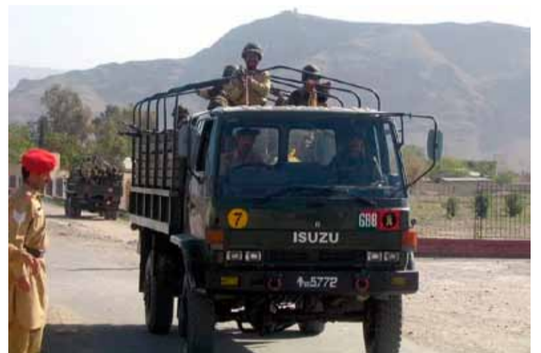
Explosión. Sacudió una zona fronteriza

El BLA y otros grupos separatistas dirigen sus ataques principalmente contra las fuerzas de seguridad, puesto que acusan a Islamabad de explotar los ricos recursos minerales de la región, sin que sus ciudadanos apenas perciban beneficios.///