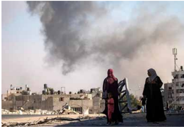
Escombros de escuela. Destruída en Gaza tras bombardeo

«La verdad es que los hospitales no pueden recibir tantos heridos, especialmente con las dificultades y las malas condiciones que vivimos en el sistema sanitario de Gaza», recordó el portavoz del Mártires de Al Aqsa, en referencia al bloqueo israelí al acceso de ayuda al enclave desde el 2 de marzo, que ha reducido a niveles mínimos las reservas