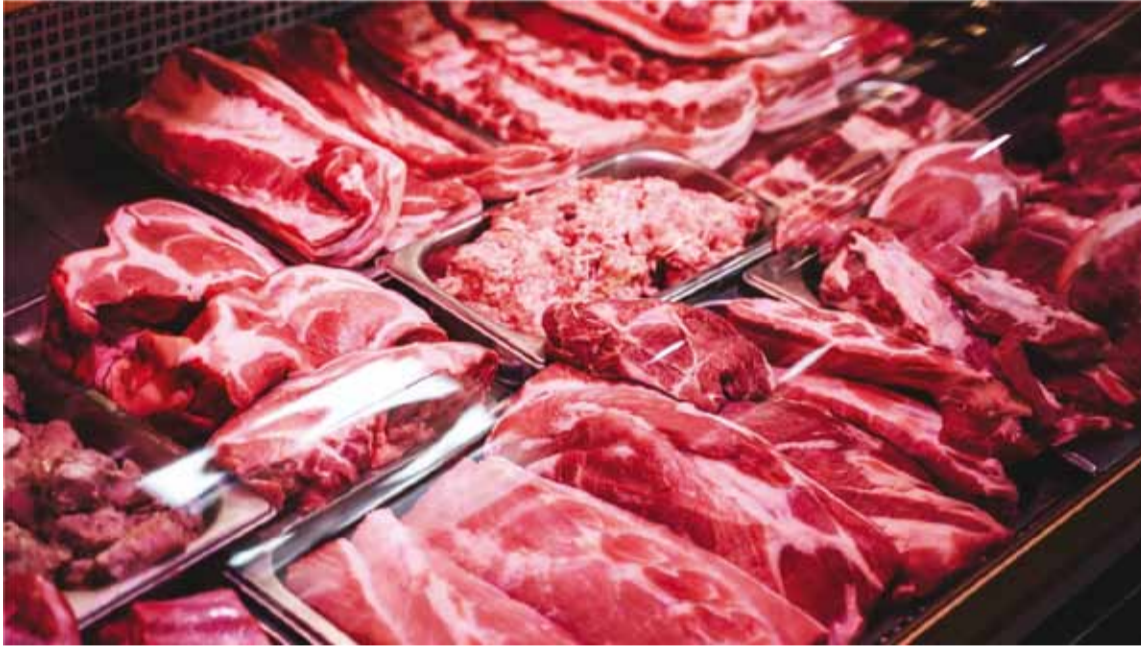
Los precios en las carnicerías, más altos

Hubo subas de hasta un 30 por ciento en algunos cortes