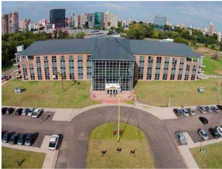
El ataque. Ocurrió el pasado 4 de abril en la Jefatura Militar de Vicente López

Uno de los imputados, que es el ex esposo de la mujer, recibió prisión preventiva por los delitos de lesiones graves triplemente agravadas por haber sido come-