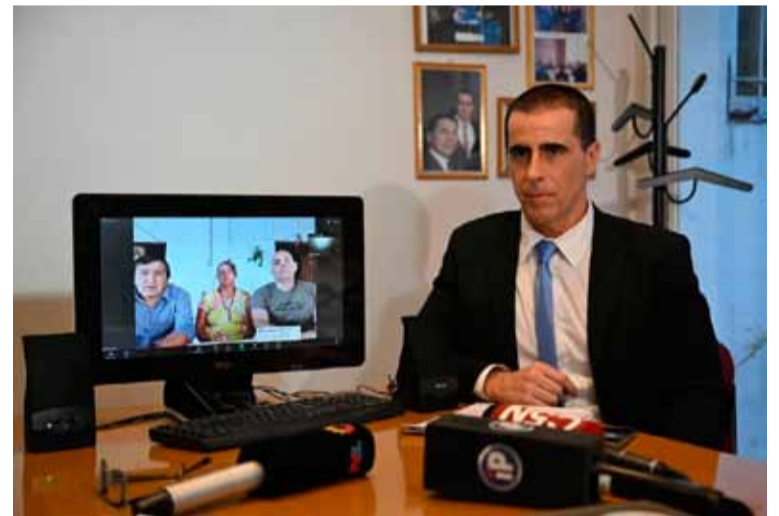
Acusación. Abogado Gallego en conferencia de prensa.

Sobre esto último, Gallego le confirmó a este medio que "la Justicia sabe de quién se trata y cuáles son sus intereses".