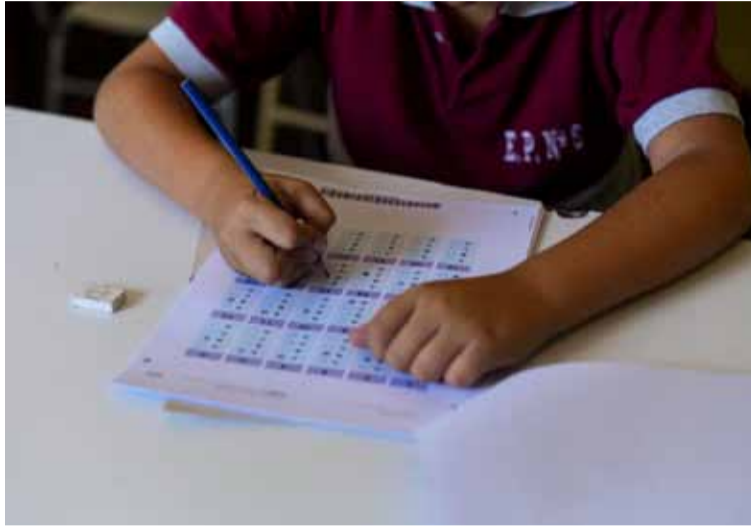
Niños en aula. Preocupación por los bajos niveles de alfabetización

En ese sentido, el restante 45% de los estudiantes alcanzó la habilidad lectora esperable al finalizar el primer ciclo de primaria. De esa cifra, se detalla que el 26,4% comprendió textos