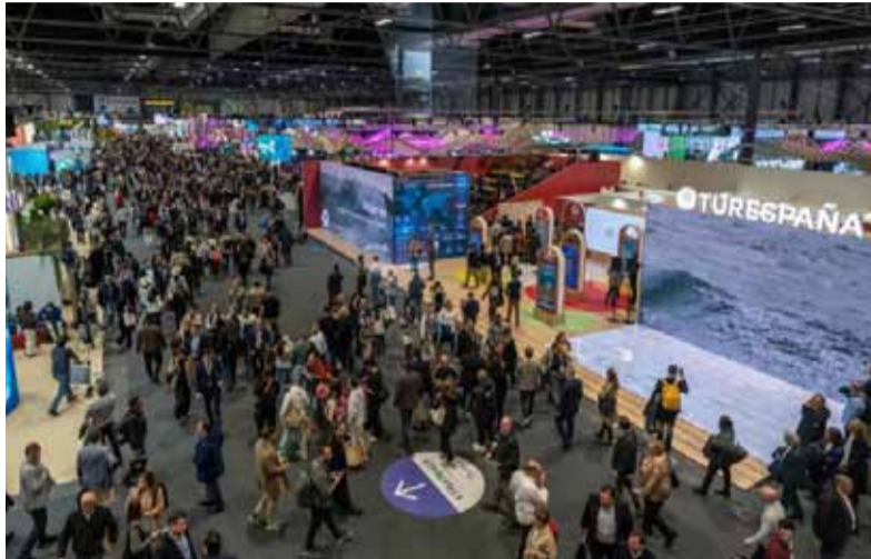
Fitur cerró con cantidad de visitantes récord.

El stand argentino se convirtió en un punto de atracción para las autoridades y el público, destacando la diversidad cultural y natural del país, con el agregado de haber sido el único stand extranjero visitado por los Reyes de España, du-