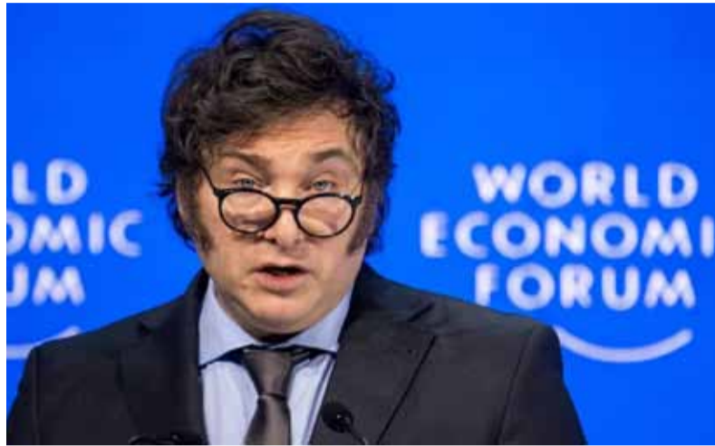
El presidente Javier Milei en Davos.

Fue sobre este punto que este domingo salió al cruce Jorge Macri. En diálogo con Radio Mitre,