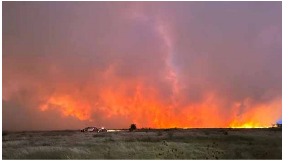
El incendio en la Reserva Natural de Punta Lara. - 0221 -

Fue en la Reserva Natural de Punta Lara. Trabajaron más de medio centenar de bomberos.