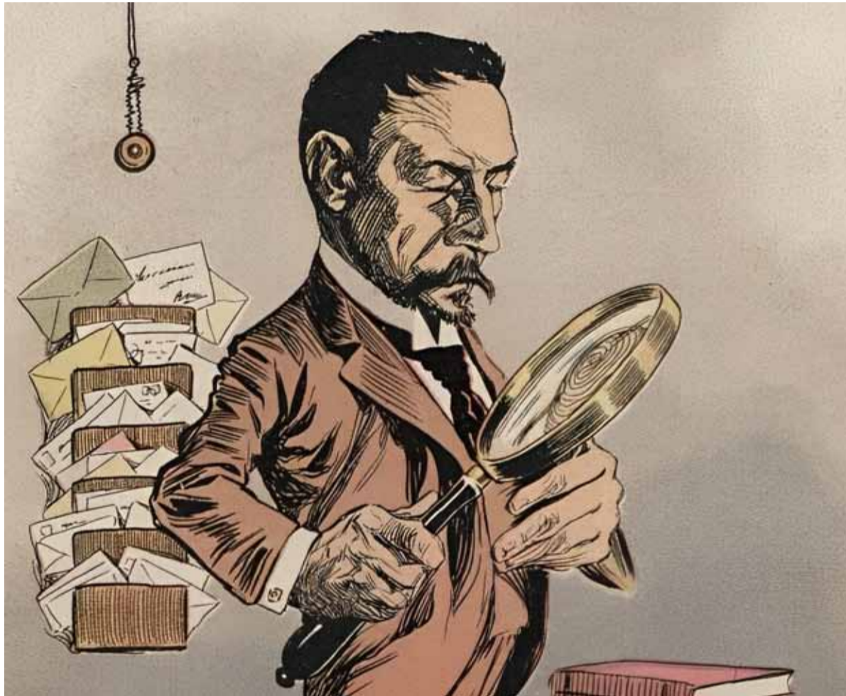
Juan Vucetich caricaturizado por el dibujante Cao para Caras y Caretas. (Revista C&C 224, 17 de enero de 1903)

En Identificación Antropométrica se trabajaba midiendo partes