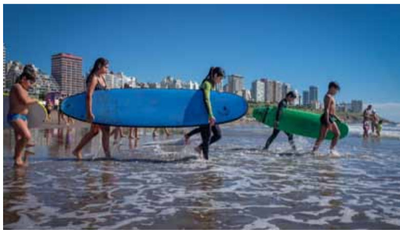
Verano 2025 en Mar del Plata. - Municipalidad de General Pueyrredon -

El sector extrahotelero también experimenta una temporada con ocupación en ascenso. Desde el Colegio de Martilleros y Corredores Públicos de Mar del Plata destacan que la mejoría del tiempo “fue muy importante para este repunte de la temporada”, explicó