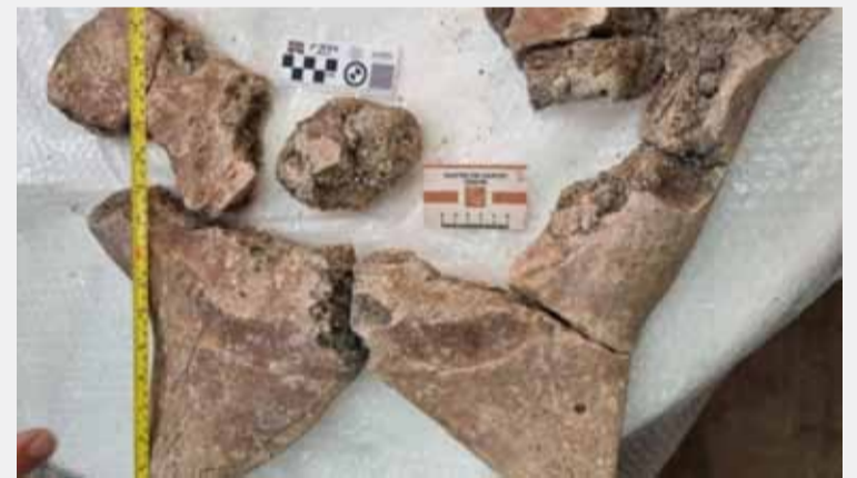
Restos fósiles hallados en Arenales.

El plastrón revela detalles sorprendentes sobre el tamaño y la anatomía de “Ascencio”. Las espinas anteriores miden 15 centímetros cada una, mientras que el espacio entre ellas, correspondiente al cuello, tiene 40 centímetros de ancho. El hueco donde se alojaba la pata delantera mide aproximadamente 55 centímetros. Estas proporciones permiten inferir un tamaño total que supera ampliamente al de cualquier tortuga conocida del mismo género. (DIB) GML