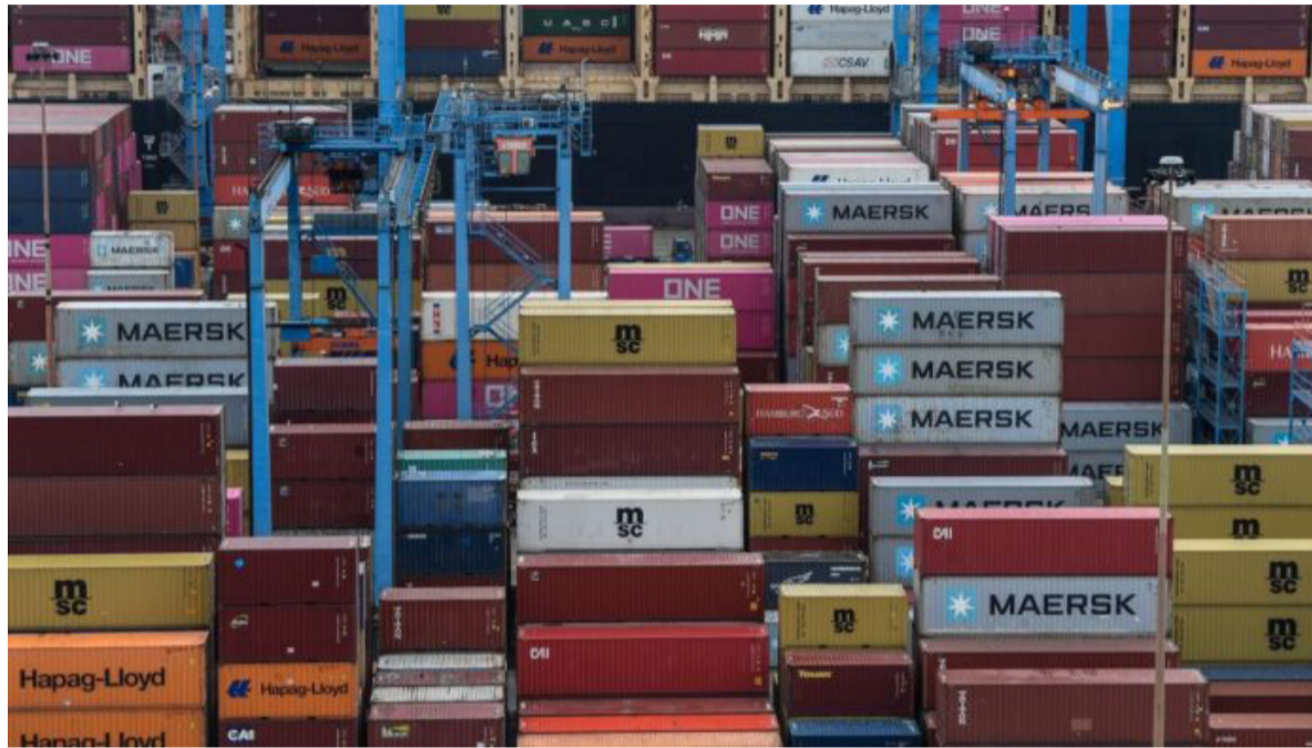
El Monitor de Exportación Pyme (MEP) es un indicador elaborado por el sector de Estadísticas e Informes de CAME.

El Monitor de Exportación Pyme (MEP) de la Confederación Argentina de la Mediana Empresa (CAME) analiza 16 rubros que agrupan las posiciones arancelarias desde el capítulo 1 al 99 de la Nomenclatura Común del Mercosur, enmienda 2024. Durante el año pasado, 4 de los 16 rubros analizados cerraron con caídas interanuales en sus exportaciones en dólares. “Tabaco y derivados” marcó el mayor descenso del año, con una