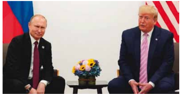
Reunión entre Trump y Putin

El presidente de Estados Unidos, Donald Trump, dijo en redes sociales que su administración "sostuvo discusiones muy buenas y productivas con el presidente Vladimir Putin de Rusia", y que existe una posibilidad muy buena de que "esta guerra horrible y sangrienta" finalmente pueda llegar a su fin.