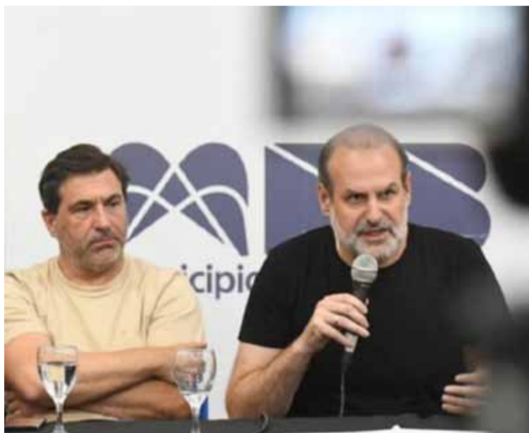
Federico Susbielles, intendente de Bahía Blanca

La casa matriz del histórico local comercial envió las zapatillas a Bahía Blanca para ser distribuidos en su sucursal de Chiclana al 200. También repartió 200 frazadas ayer, que otra recorrida de este medio dio cuenta de cómo agotaron el stock