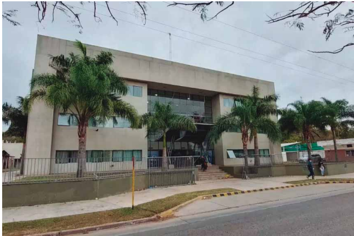
El sentenciado desobedeció una medida judicial para atacar a la mujer y fue juzgado mediante un juicio abreviado

Un hombre fue condenado a siete años por golpear y abusar de su expareja en 2023 y 2024, en la ciudad de Pálpala en la provincia de Jujuy.