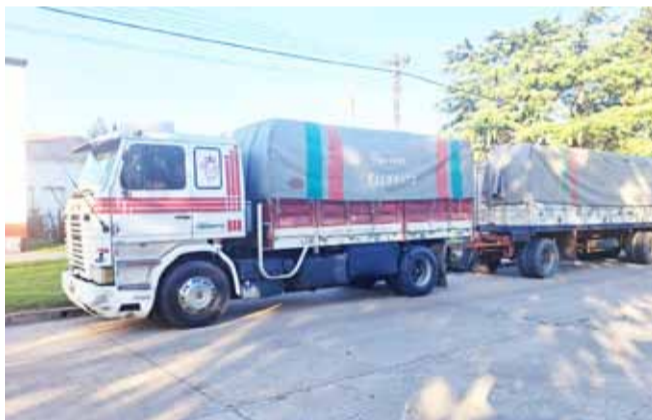
El camión, con acoplado incluido, cargado de donaciones, partía anoche rumbo a Bahía Blanca.