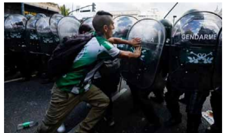
Sería antes del 10 de abril