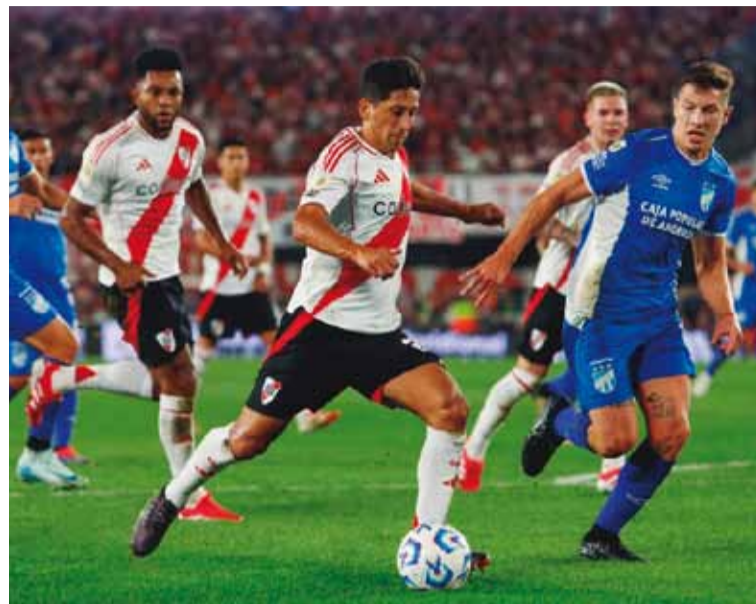
River Plate buscará sumar de a tres en su visita a Riestra