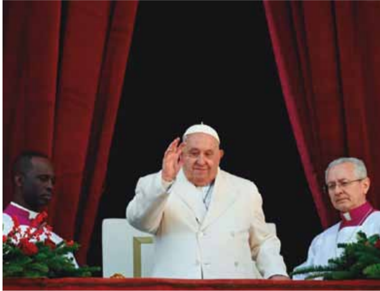
El Papa Francisco lleva un mes internado

Sin embargo, "mañana por la tarde debería difundirse el