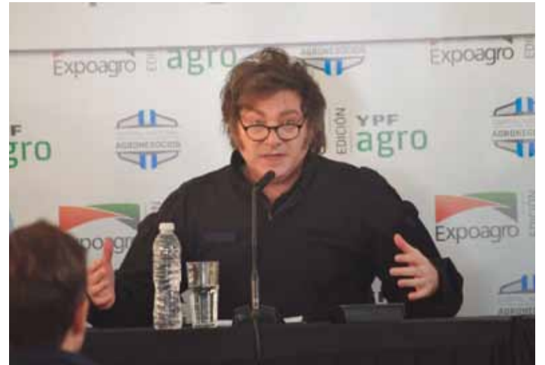
El presidente, Javier Milei, estuvo presente en el cierre de Expoagro

El presidente Javier Milei explicó este mediodía que demoró su presencia en la ciudad de Bahía Blanca, azotada por las fuertes lluvias, para evitar “estorbar” y afectar el trabajo de la reconstrucción, y planteó