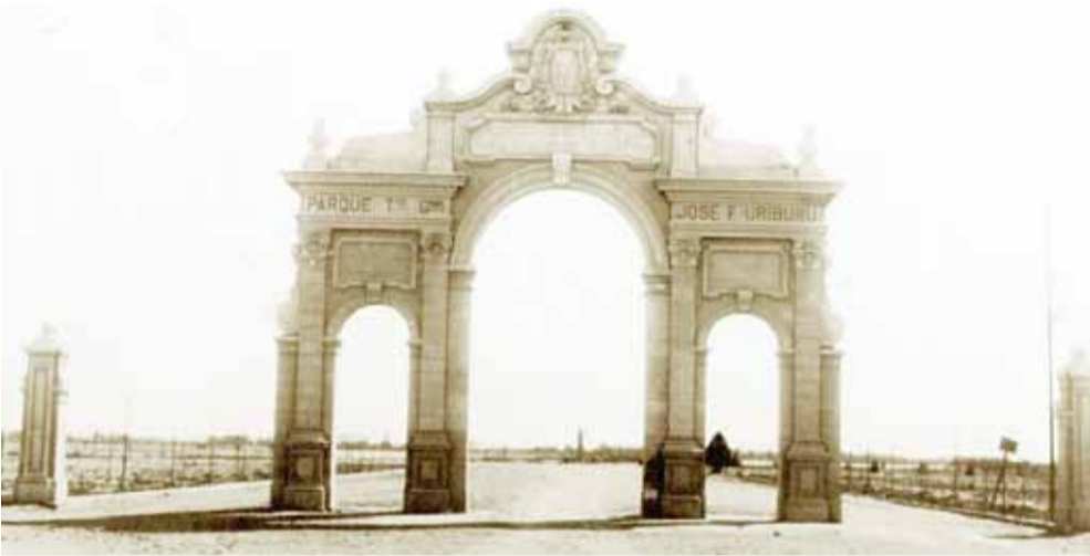
El Pórtico de ingreso al parque está próximo a cumplir 100 años.