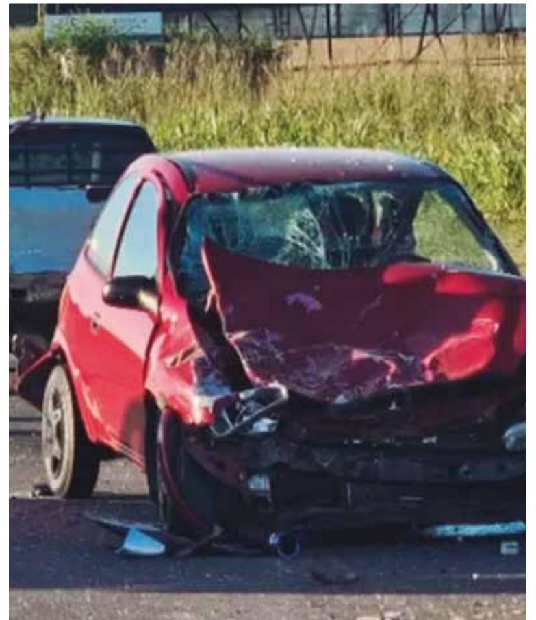
Murió un joven de 19 años

La Justicia ordenó la liberación condicional de los siete detenidos por la picada que provocó la muerte de un joven en la ciudad de Córdoba.