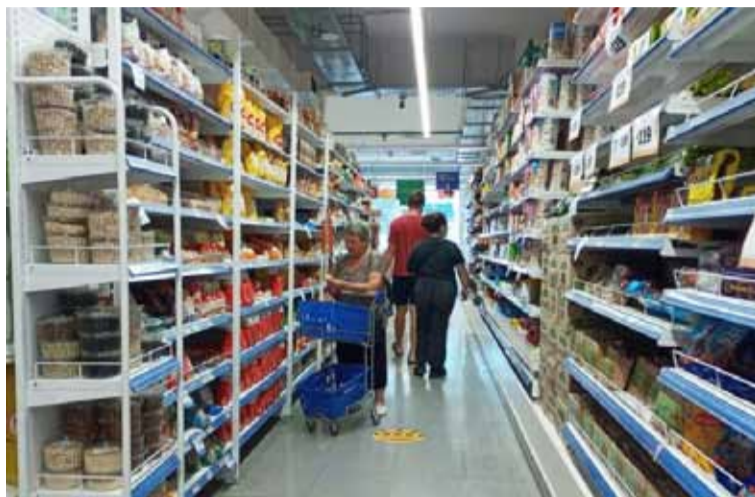
En la comparación interanual, el incremento alcanzó el 66,9%

El aumento en la carne y derivados tuvo incidencia en todas las regiones del país. Alquiler de la vivienda y gastos conexos, como servicios, fue el aumento de mayor impacto en Gran Buenos Aires y Región Pampeana, zonas en las que se ubican los distritos bonaerenses.