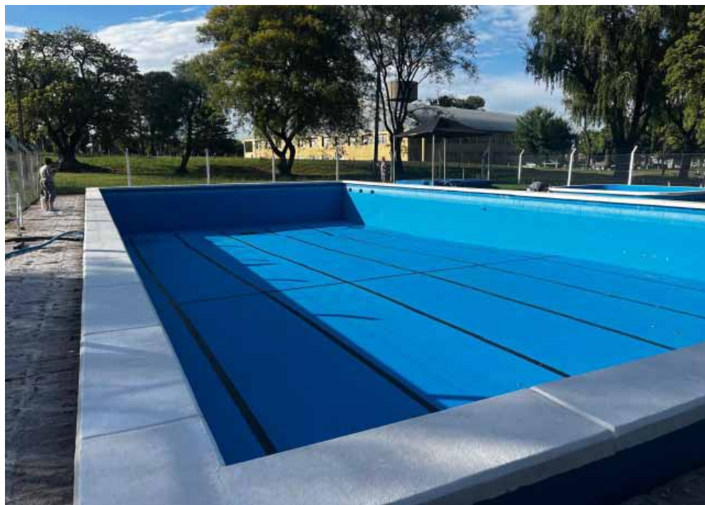
Vista panorámica de las piletas municipales ubicadas detrás del Polideportivo Soler.