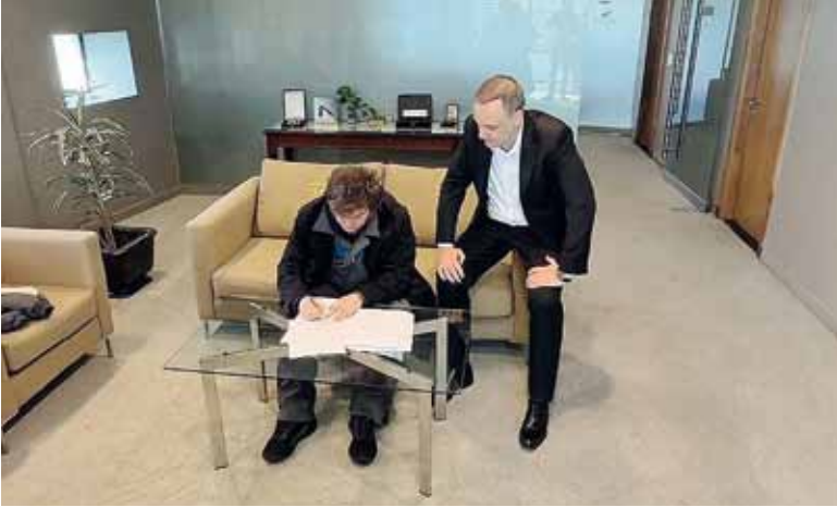
En Ezeiza. Milei firmó el proyecto apenas regresado de su viaje a Oslo.

Para incentivar la formalización se establece el Régimen de Incentivo a la Formalización Laboral (RIFL), que regirá durante un año y otorgará contribuciones patronales reducidas -del 2% por cuatro años- a quienes contraten