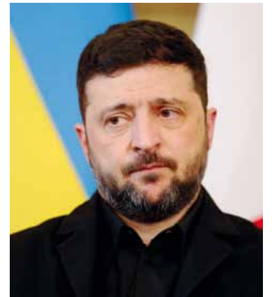
El presidente ucraniano sigue negociando.

Zelenski entregó a EE.UU. una revisión del plan de paz