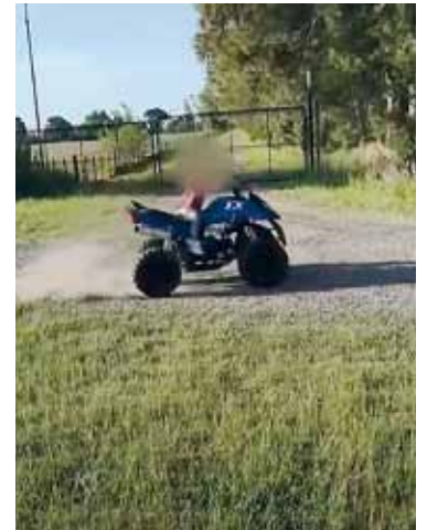
Peligro. El nene en el cuatriciclo.

La legislación vigente no autoriza que un niño de esa edad conduzca un vehículo con motor a combustión. Es más: en el registro filmico se observa a la criatura sin su casco en un descampado, protección que si se colocó cuando tomó la ruta.