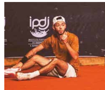
Quentin Folliot, el deportista suspendido.

El tenis mundial quedó sacudido tras conocerse la dura sanción contra el francés Quentin Folliot, quien llegó a ocupar el puesto 488 del ranking ATP en 2022 y que ahora fue castigado con 20 años de suspensión por la Agencia Internacional de Integridad del Tenis (ITIA).