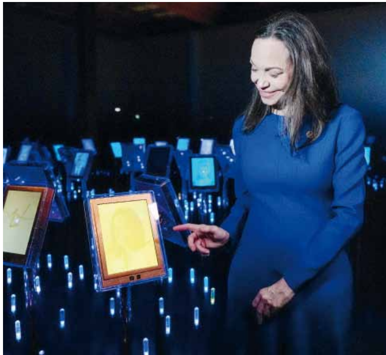
Operativo. La flamante Premio Nobel de la Paz reconoció que Estados Unidos intervino en su viaje a Noruega.

Machado llegó a Oslo horas después de la ceremonia de premios del miércoles e hizo su primera aparición pública en 11 meses la madrugada del jueves, apareciendo en el balcón de un hotel y saludando a una multitud emocionada de seguidores. Lleva-