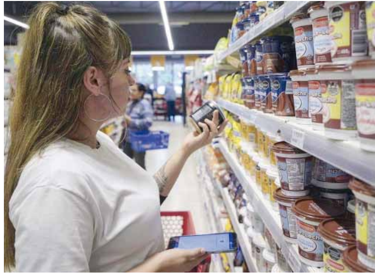
Para arriba. "Alimentos y bebidas no alcohólicas" marcó una suba del 2,8% a nivel nacional.

La división con mayor aumento en el mes fue "Vivienda, agua, electricidad, gas y otros combustibles", que avanzó 3,4%. Le siguió "Transporte", con un incremento de 3%,