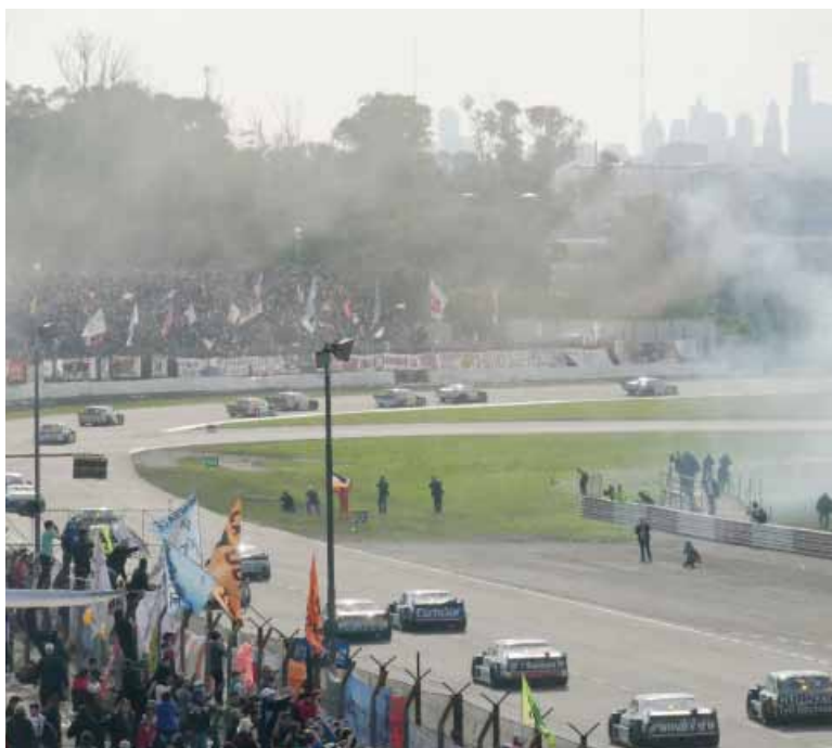
Quedó afuera. El circuito porteño no formará parte del calendario del Turismo Carretera.

Según publicó Automundo, la ruptura responde al aval del Gobierno de la Ciudad al TC2000 para montar un callejero en las inmediaciones del autódromo, jugada que reforzó la alianza entre esa categoría y el ACA, actor central de la disputa por la fiscalización del automovilismo nacional por lo que la ACTC tomó