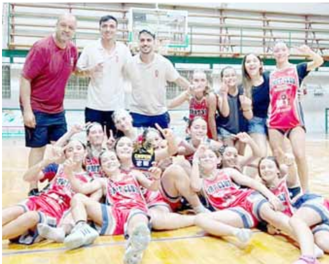
La formación de Sport Club