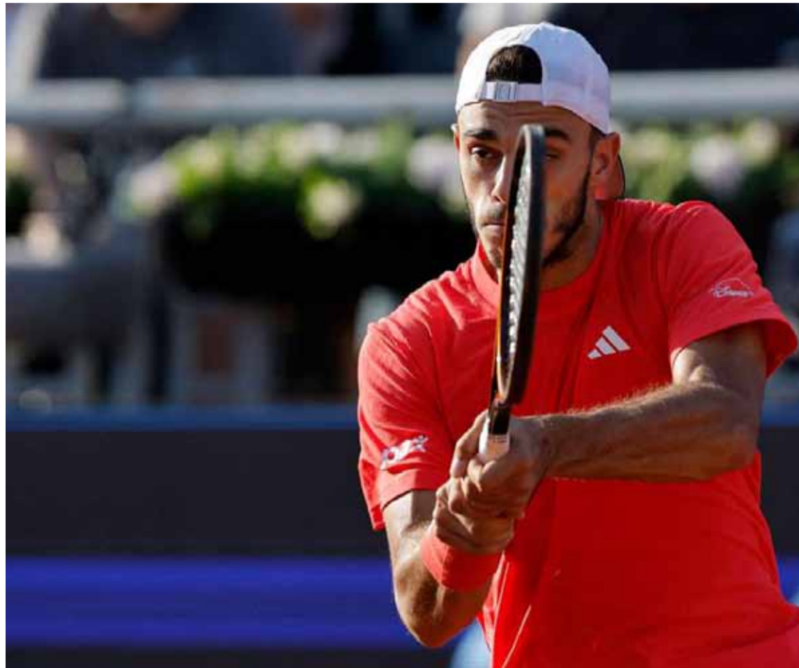
Francisco Cerúndolo sigue su camino en Indian Wells

El argentino le ganó por 6-3 y 6-4 al neerlandés Botić van de Zandschulp