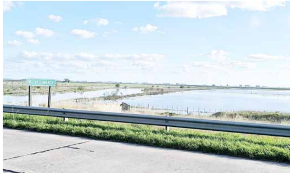
El Arroyo Vallimanca el pasado domingo a la tarde.

Al respecto, dieron a conocer que el caudal del mismo sigue creciendo moderadamente pero en forma constante y por esas razones aconsejan a productores agropecuarios de la zona que tengan animales en potreros que puedan ser afectados o maquinaria alojada en esos predios, que tomen las precauciones que consideren oportunas para su traslado, toda vez que el desborde del arroyo terminará anegando esas explotaciones. Puntualizan también que le pico de llegada de masas de agua procedentes de la zona de sierras, donde nace precisamente