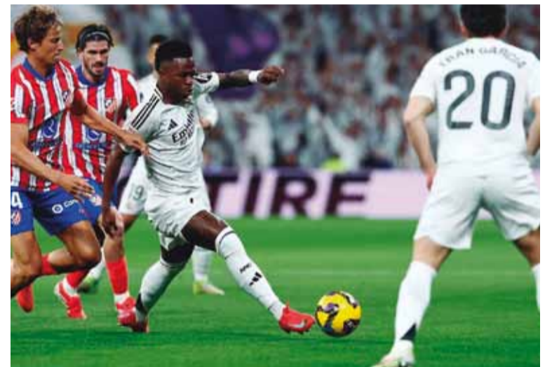
Se define el clásico de Madrid

La Champions League tendrá este martes los encuentros de vuelta de los octavos de final y se extenderá hasta el miércoles, en los que tendrá como platos fuertes los cruces de Paris Saint-Germain (PSG) - Liverpool y Atlético de Madrid ante Real Madrid.