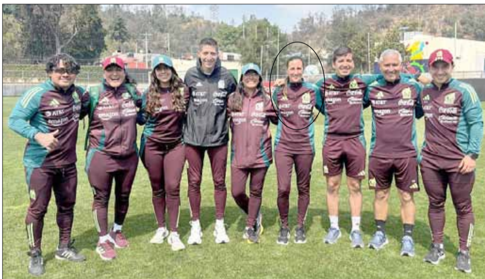
La primera experiencia de la bolivarensa con el fútbol femenino mexicano fue la concentración del mes pasado, con la Selección Sub 20.

dores físicos); en este país algunos estamos de manera eventual, no fijos. Es decir que te designan para trabajar con una categoría y tenés que presentarte cuando ese equipo tiene un torneo y debe concentrar. De esa manera, pedí quedar para poder seguir trabajando acá en Querétaro y viajar para concentrar con una selección cuando haya alguna competencia. Por el momento, estoy asignada a la Sub 20, con la que tenemos por delante todo el proceso pre Mundial y el Mundial del año próximo, así que creo que se vienen cosas lindas. Esto será aproximadamente hasta julio; para más adelante, están viendo si me dejan en Sub 20 o si me suben a Sub 23, porque en principio esa era la idea inicial. Ya veremos a qué categoría me designan, pero básicamente estoy trabajando adentro de la Federación.