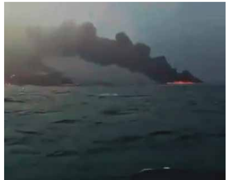
El momento del choque

Más de 30 víctimas fueron llevadas a tierra tras la colisión entre un buque petrolero y uno de carga en el mar del Norte, informaron este lunes medios de comunicación británicos.