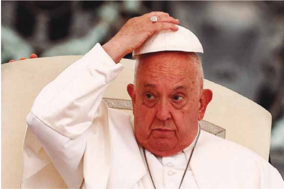
El Papa Francisco tuvo otra jornada con una mejoría en su condición de salud

“Las condiciones clínicas del Santo Padre siguen siendo estables”, dijeron