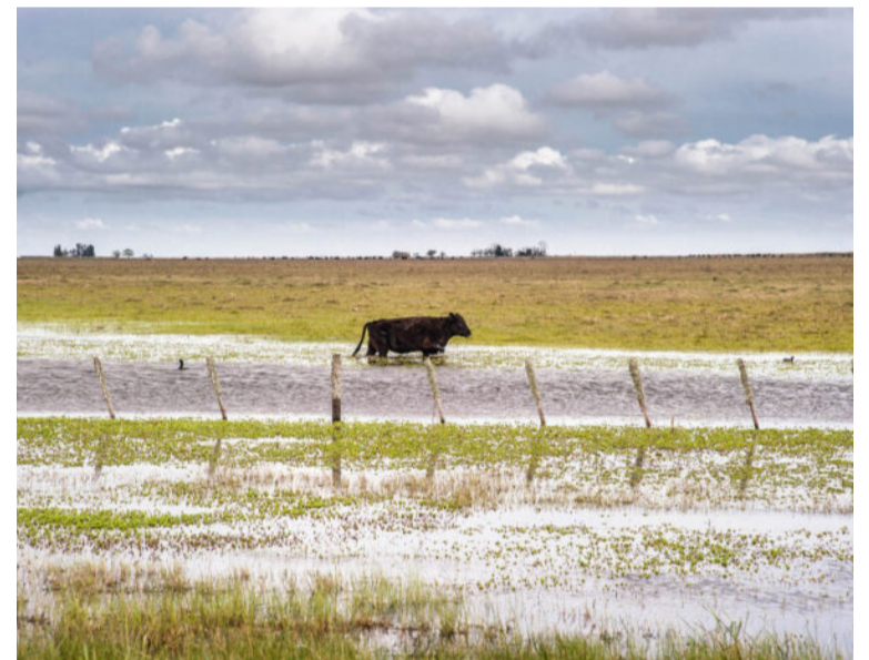
Mucha agua acumulada en los campos