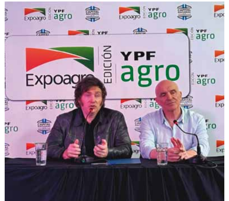
Milei y Espert, el año pasado

El presidente Javier Milei participará el viernes de una nueva edición de ExpoAgro 2025, que se celebrará a lo largo de toda la semana el autódromo de San Nicolás, al norte de la provincia de Buenos Aires.