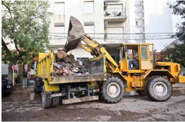
Algunos de los trabajos en Bahía Blanca tras el temporal

“Trajimos 775 policías extras a Bahía Blanca más gente de Policía Federal, Gendarmería y Prefectura, que estamos trabajando todos juntos en un comando unificado. La seguridad está garantizada. Hoy llegan 200 bomberos voluntarios, que van a trabajar en la segunda fase de