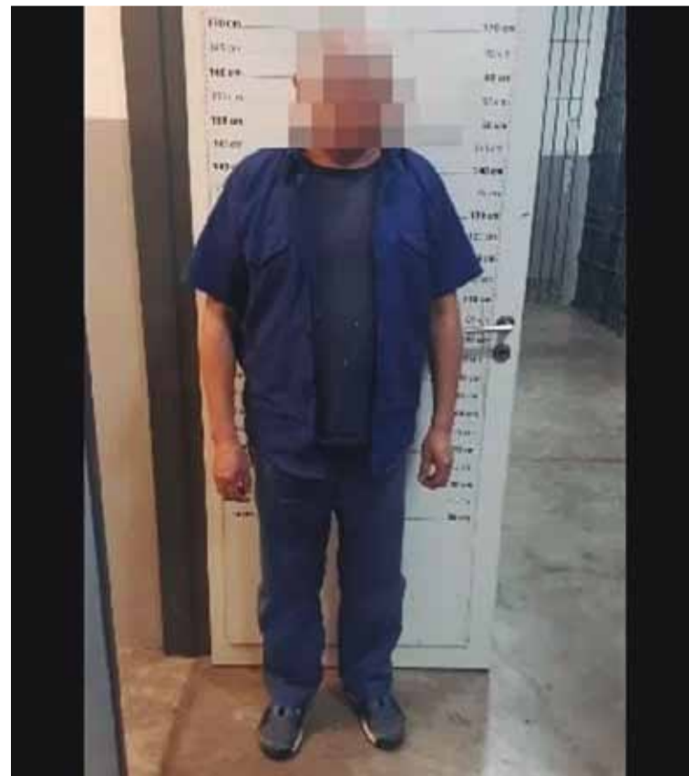
El hombre imputado

Un hombre de 51 años fue imputado hoy por causar daños a un auto y a un edificio en el barrio porteño de Floresta.