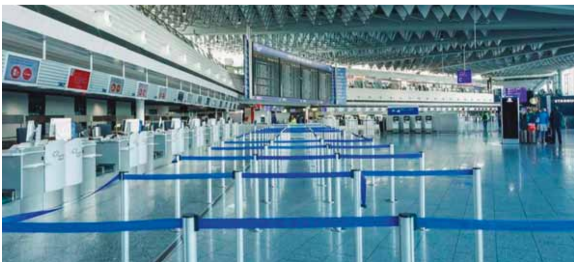
Un aeropuerto de Alemania, totalmente vacío

Más de 1.000 vuelos en el Aeropuerto de Frankfurt se vieron afectados por la huelga de trabajadores del aeropuerto este, informó la agencia de noticias Xinhua.