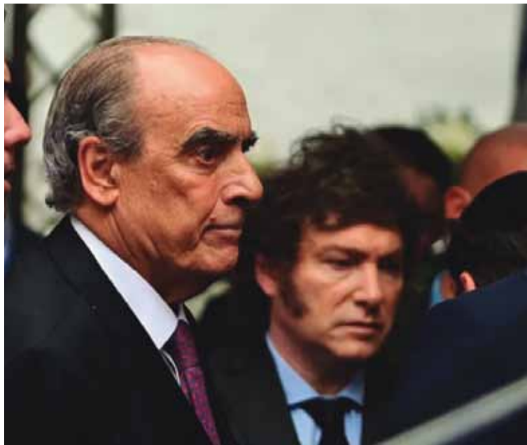
Guillermo Francos, jefe de Gabinete, y el presidente Javier Milei

Asimismo, Francos destacó que “la organización de eso es de la provincia de Buenos Aires; ellos tienen que decirnos de qué manera podemos colaborar y ayudarlos. La reconstrucción